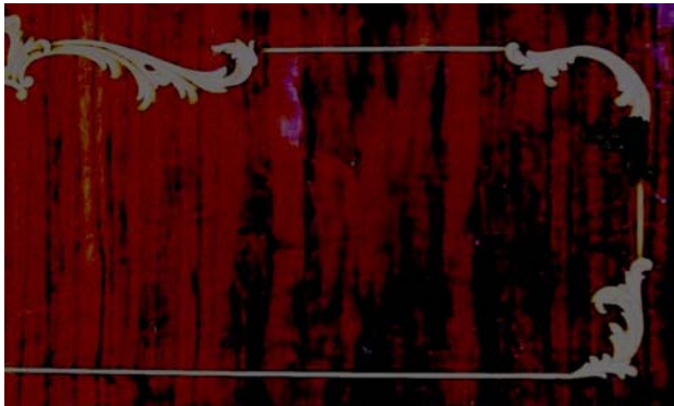
Munkadarab javítás előtt

12. Önt mint műbútorasztalos vállalkozót megkereste a helyi állatorvos a következő kérdéssel: örökölt egy bútort, de sérült rajta az intarzia (nem műemlék), ki lehet-e javítani? Mondjon szakvéleményt, határozza meg a javítás módját, technológiáját, eszközeit és anyagait!