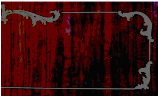
Munkadarab javítás után