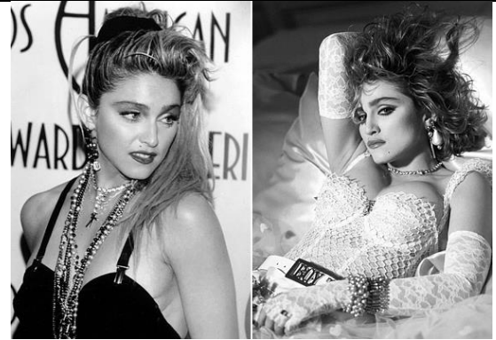
B. ( http://retikul.hu )