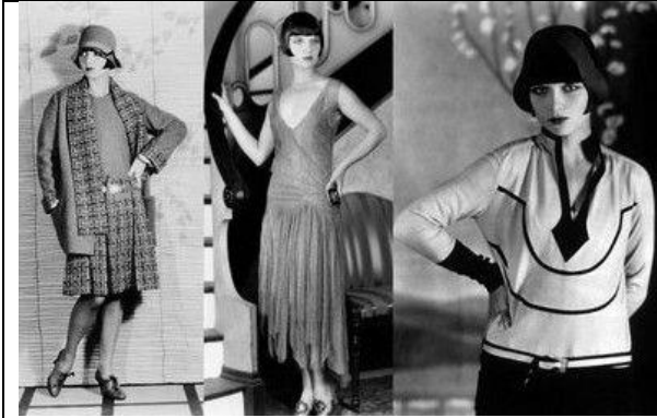
A. ( http://www.divatesstilus.hu )

Válogassa szét az alábbi képeket aszerint, hogy a XX. század mely divat-korszakára jellemzőek! Egy betűt egy cellába írhat be.