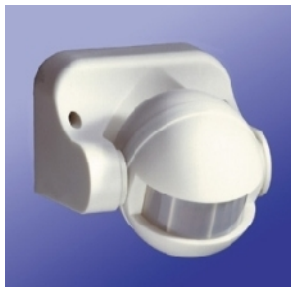
2. ábra: .....