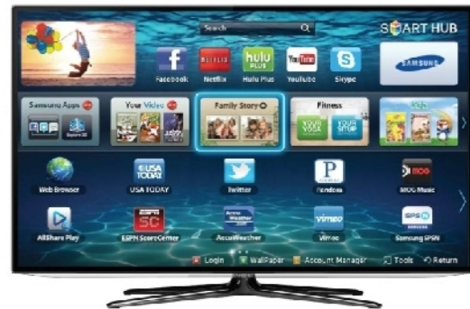
5. ábra: .....