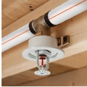
1. ábra: .....

A szállodák gépészeti hálózatának ismerete nélkülözhetetlen bizonyos munkakörök betöltésekor. Írja az alábbi képek alá, hogy mit ábrázolnak, majd a képek sorszámát rendelje hozzá a gépészeti hálózat megnevezéséhez! Az ábra számát írja a körökbe!