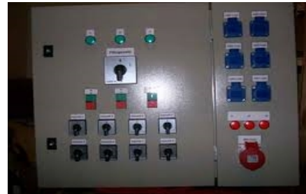
4. ábra: .....