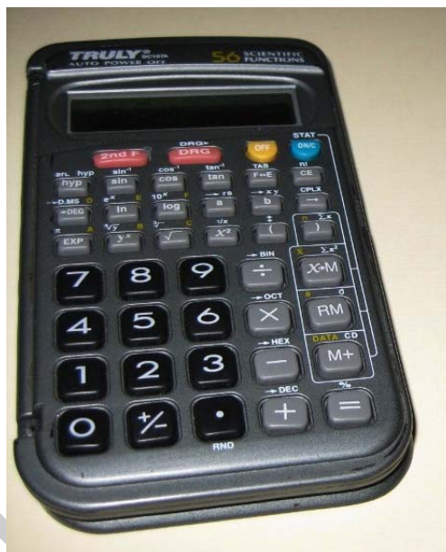
5. ábra. Zseb-kalkulátor, a költségvetés készítéshez használatos eszköz, 5

A költségbecslés a megrendelő által tervezett munka költségeinek hozzávetőleges árának meghatározása. Általában egy már korábban elvégzett hasonló munka alapján következtetnek a tervezett munka költségeire, vagy normatívát használnak segédletként. Ez a fajta költségvetés csak nagy gyakorlattal rendelkező szakember számára javasolt, mivel a nagy költségeltérés komoly problémákat okozhatnak.