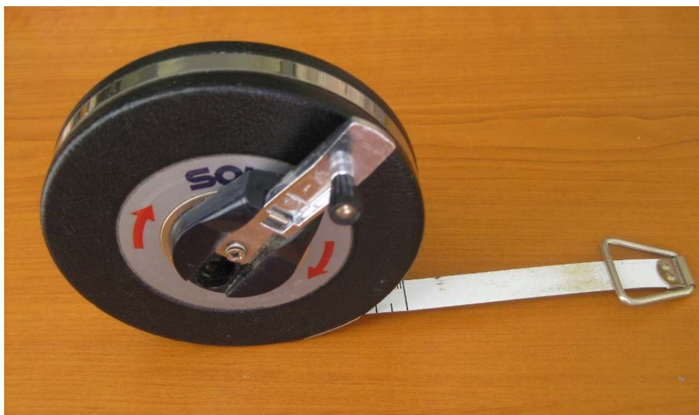
2. ábra. Mérőszalag 2

Az új építésű épületekben egyszerűbb a munka megszervezése, a régi épületek esetén viszont tekintettel kell lenni a meglévő fal- és padlóburkolatokra is.