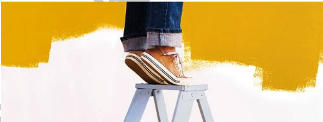
1. ábra Falfestés 1

Milyen tanácsokat adna kezdő szobafestő vállalkozó ismerősének, hogy esélye legyen a munkára vonatkozó megbízás elnyerésére, valamint az árajánlat készítésénél az árképzésében a kiadásokat és nyereséghányadot megfelelően szerepeltesse, illetve a munka szervezése és végzése kapcsán ne legyenek problémái.