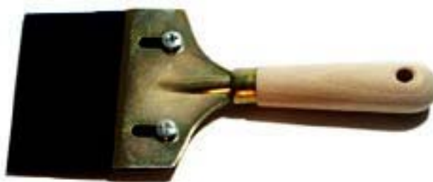
7. ábra. Kaparó 7

Minden vállalkozói szerződésnek bizonyos tartalmi elemeket kötelezően tartalmaznia kell. Ilyen tartalmi elemek a például a szerződés: