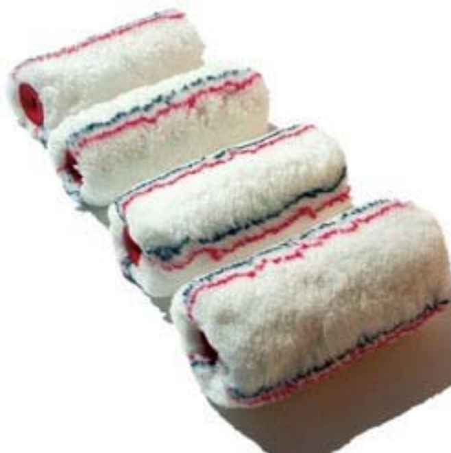
8. ábra. Festőhengerek 8

A felhasználásra kerülő festékeket új építésű építkezéseken a tervdokumentáció tartalmazza. Régi, felújításra kerülő épületek festő munkáinál felhasználandó anyagokra a helyszíni bejáráson, a szobafestő tesz javaslatot – az alapfelület megismerése után –, a megrendelőnek.