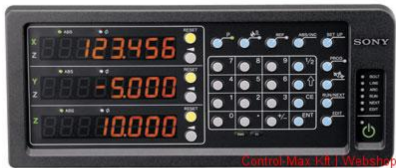
3. ábra. Digitális hossz mérő