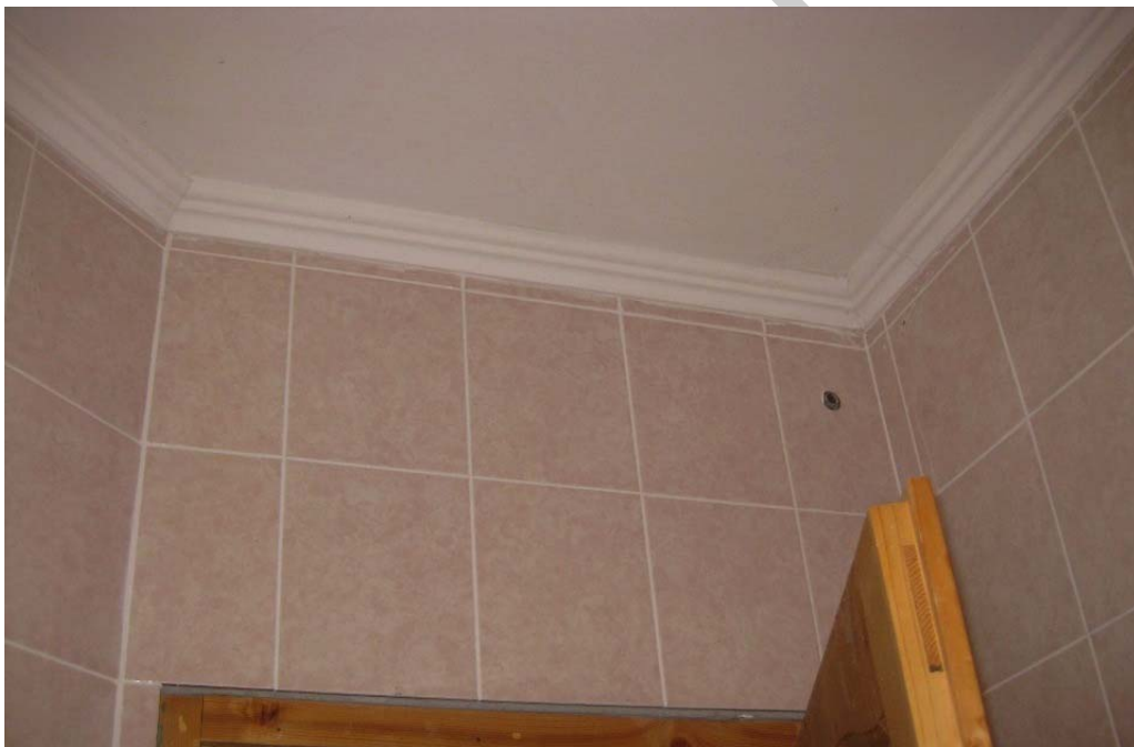
4. ábra. Mennyezetfestés diszperziós falfestékkel 4

Más a kültéri és más a beltéri vakolatok, falfestések esetében az elvárás, mivel más kémiai, mechanikai hatásoknak vannak kitéve. Ezért a falfelületet érő hatásoknak megfelelő minőségű habarccsal készülnek a vakolások és a falfestések.