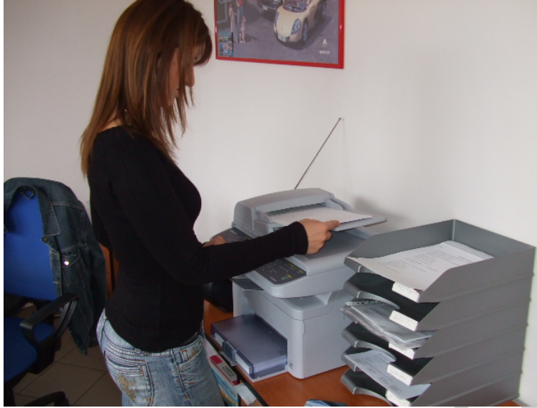
3. ábra. Jegyzőkönyv másolása