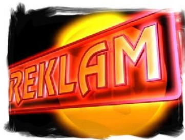
5. ábra. Reklám

Különböző megjelenési formájával az érzelemre és az értelemre egyszerre hat. A cégismertetőhöz hasonlóan megtérül a ráfordított költség, nagyobb ismertséget, több megrendelést, nagyobb forgalmat eredményez.