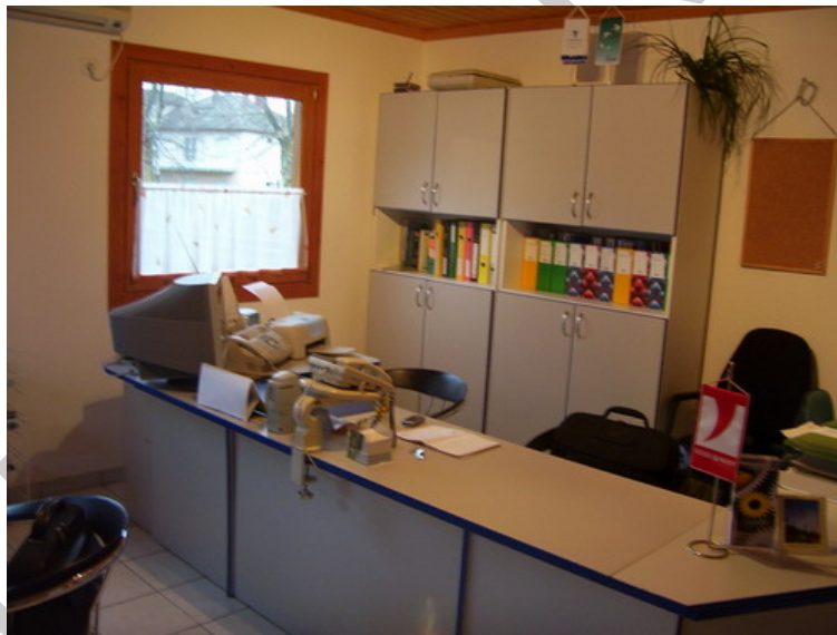
1. ábra. Iroda

A beruházási folyamat minden szakaszában megbeszélések, tárgyalások, zajlanak, ahol a résztvevők különböző információkat adnak át, vitáik során érvekkel, ellenérvekkel támasztják alá saját álláspontjukat, valamilyen egyezsége, megegyezésre jutnak, amely alapján később folytatják munkájukat. Az idő múltával nem emlékeznek tisztán mindenre, ez később vitára is okot adhat, ezért célszerű az elhangzottakat írásban is rögzíteni.