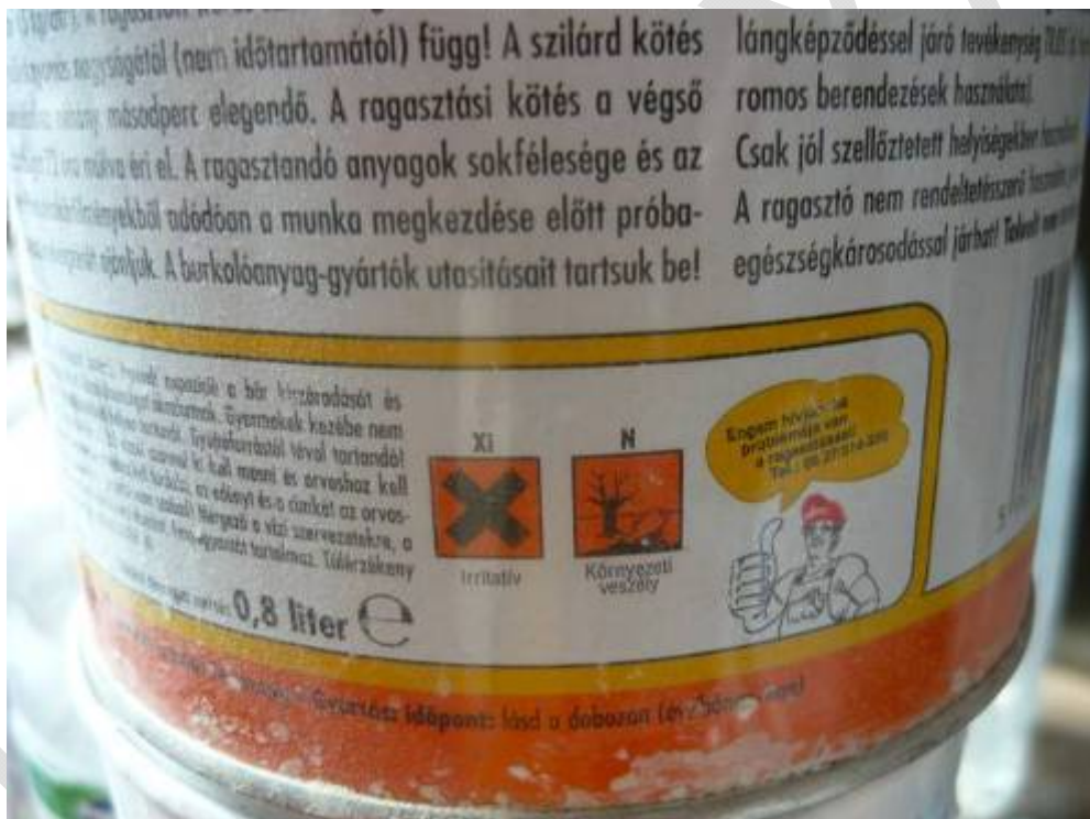
7. ábra. Veszély-jelképek egy ragasztóanyag dobozán

Az üzemben vagy az építkezés helyén sokféle csomagolásban találkozhatunk anyagokkal. A csomagoláson különböző veszély-jelképek láthatók, ezek ismerete támpontot ad ahhoz, hogy a maradványokat, a hulladékokat is képesek legyünk besorolni.