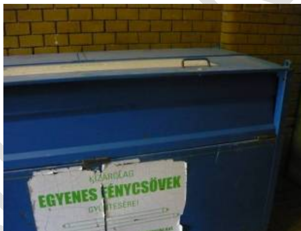
31. ábra. Fénycsövek gyűjtőládája

Az elektromos ipari vagy háztartási gépeken kívül jelentős mennyiségű hulladék keletkezik a javíthatatlan vagy egyszerűen csak korszerűtlen, már divatjamúlt elektronikai termékekből is. Ide sorolható a számítógép, valamint tartozékai és a szórakoztató elektronika számtalan berendezése, pl. videolejátszók, televíziók, CD-lejátszók.