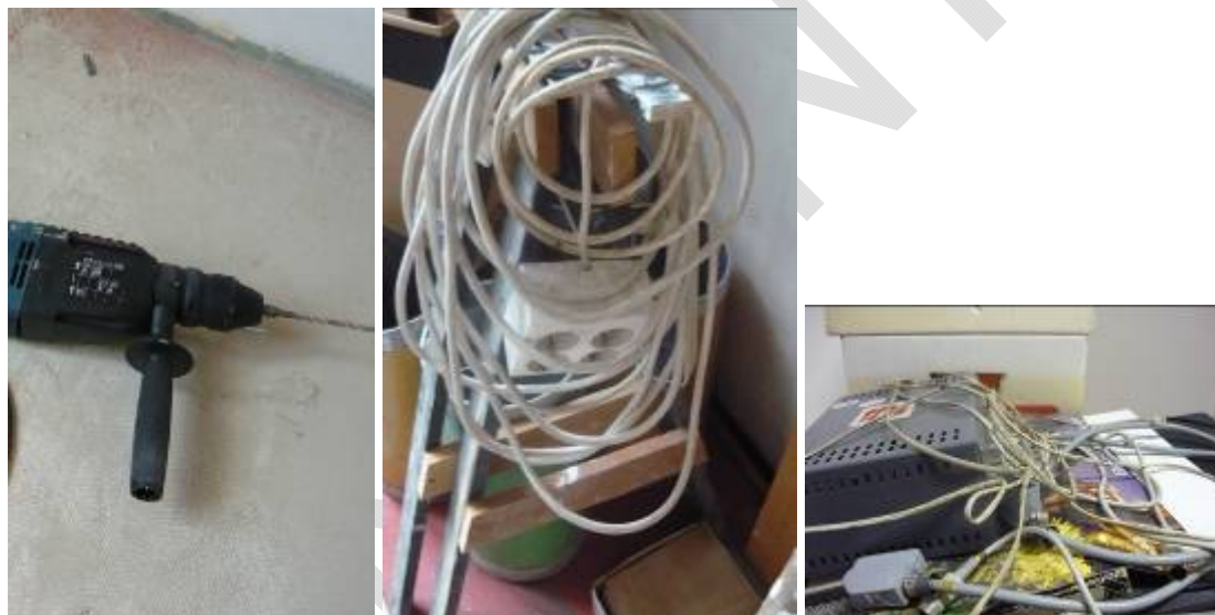
30. ábra. Javíthatatlan, leselejtezett elektromos kisépek, elosztók, kábelek

Az építkezésen nagy karbantartási szünet volt. Sok kisgépet megvizsgáltak, néhányat ezek közül használatra és javításra alkalmatlannak ítélték a szakemberek. Mi legyen a használhatatlan vágógéppel, csiszolóval, polírozóval, elektromos működtetésű kisépekkel? A raktáros ezeket az eszközöket, kisépeket a nyilvántartásból már törölte, nem biztosítja számukra a helyet. Hová kellene ezeket szállítani?