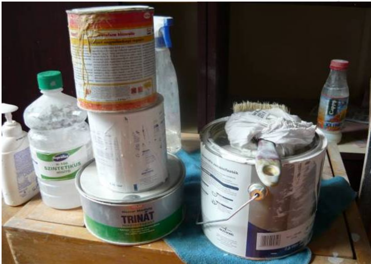
29. ábra. Építési szakipari munkákhoz használt anyagok

Csináljon rendet! Írja le a kijelölt helyre, hogy hová helyezi a fotón látható anyagmaradványokat?