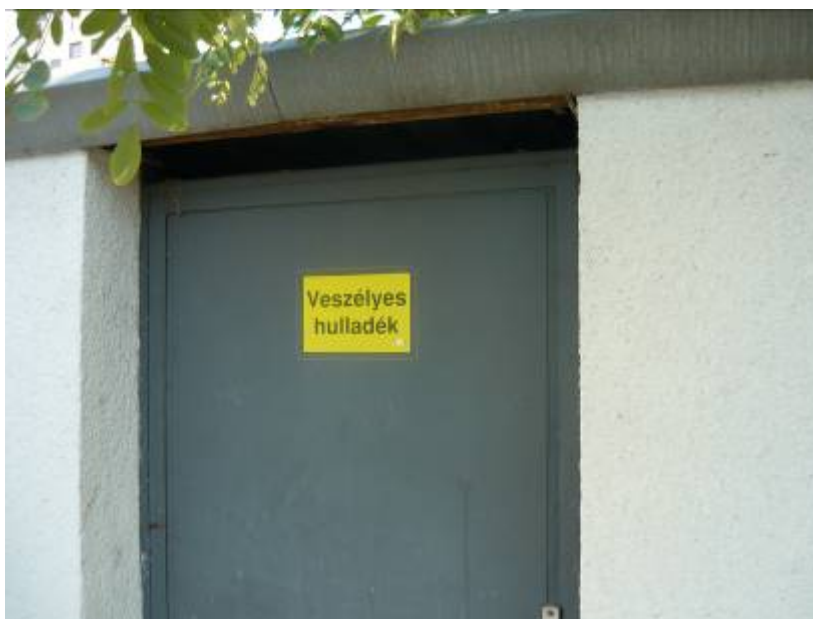
19. ábra. Iskolaudvaron, műhelyudvaron kialakított tároló