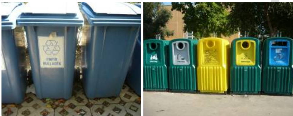
3. ábra. Lakossági szelektív hulladékgyűjtés tárolói, konténerai

A környezetre nem veszélyes hulladékokat az anyag tulajdonságainak, halmazállapotának és állagának megfelelően érdemes elkülönítetten kezelni. Hazánkban is egyre elterjedtebb a lakossági szelektív hulladékgyűjtés, amelynek színes konténerai a városok, falvak több pontján megtalálhatók. (Tanulásiirányító 2. és 3. pont)