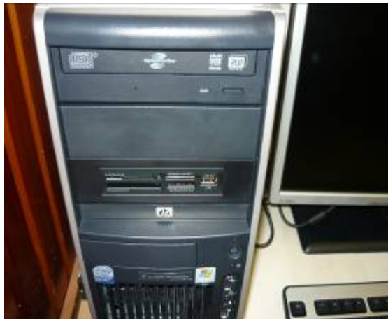
35. ábra. Számítógép és tartozékai

Írja le hová szállítja a fotón látható működésképtelen, leselejtezett irodai „maradványokat”?