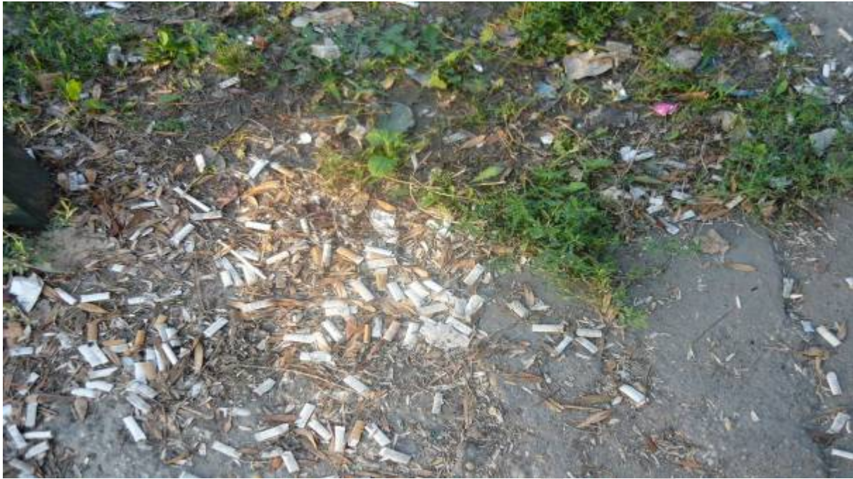
2. ábra. Szemetes, csikkokkal borított járdaszegély

Jelentős egészségi és anyagi természetű hatás lehet a környezeti elemek szennyezése, tehát a levegő, a felszíni és a felszín alatti víz, az élővilág, a táj, és az épített környezet szennyezése. Környezetre gyakorolt hatás alapján két nagy csoportot kell megkülönböztetnünk: