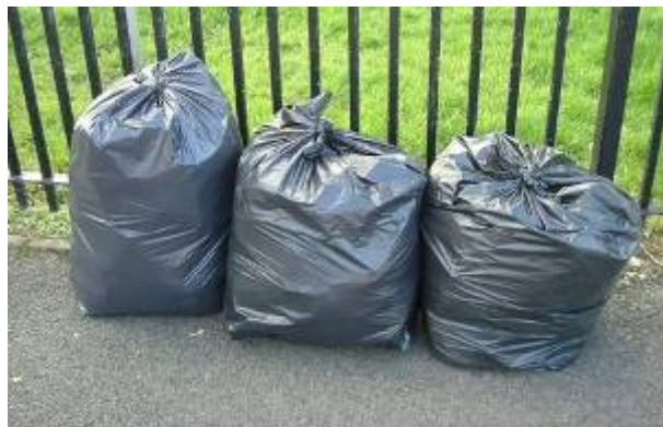
6. ábra. Műanyag zsákok az építési területen

Alkalmasak-e az ábrán látható zsákok a munkahelyen keletkező apróbb építési törmelékek, papírhulladékok (pl. tépett tapéta) tárolására és elszállítására? Milyen szabályok vonatkoznak a veszélyes hulladékok szállítására?