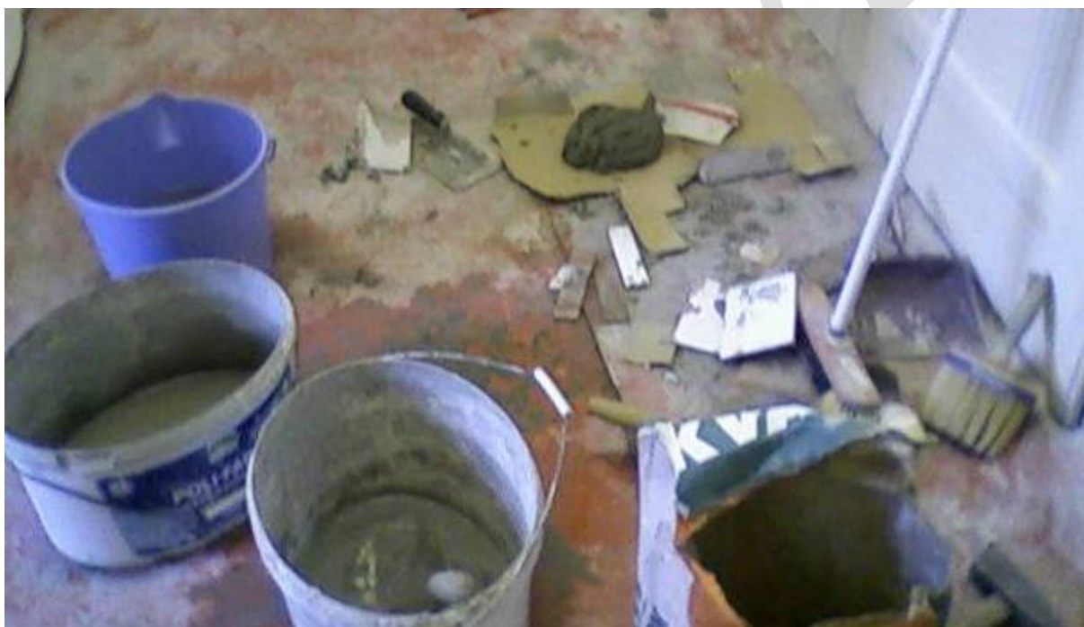
1. ábra. Építési terület a nap végén

A munkanap végére minden alkalommal keletkezik bizonyos mennyiségű szemét, hulladék. Sokszor az alábbi kép tárul elénk.