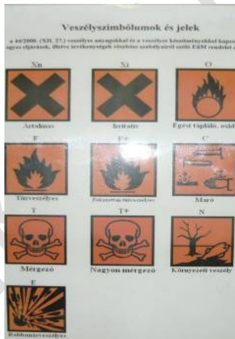
27. ábra Veszély-jelképek

Írja le a kijelölt helyre hol kell kifüggeszteni a fotón látható táblát, és mi a szerepe?