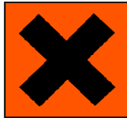
17. ábra. Irritatív anyag

A fejezet tanulmányozását követően a „ESETFELVETÉS — MUNKAHELYZET”-ben bemutatott dobozon látható jelképek már ismertek lettek számunkra.