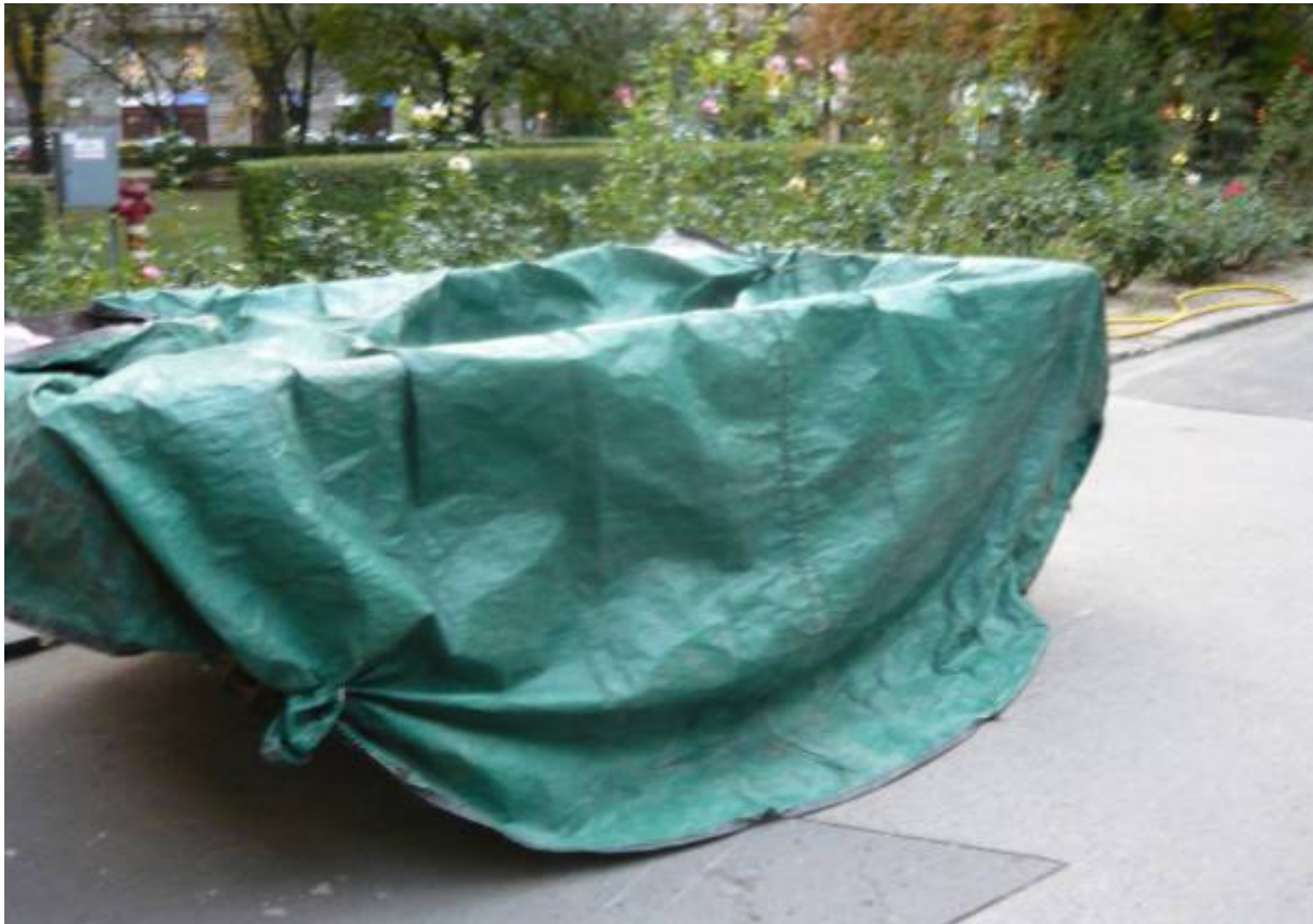
5. ábra. Környezetre nem veszélyes, szemcsés hulladékok helyes tárolása

Szemcsés anyagok tárolása esetén szükséges a ponyvás letakarás is, hogy a szél kedvezőtlen hatását kivédjük. Gondoskodni kell a pormentes átrakodásról, szállításról is, tehát finomszemcsés anyag esetén zárt rendszer szükséges. (Tanulásiirányító 4. pont)