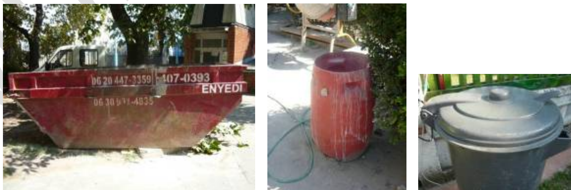
4. ábra. Környezetre nem veszélyes gyártási, építési hulladékok tárolására alkalmas edények, konténerok, hordók

Ezeknek az anyagoknak az összegyűjtése, szállítása nem igényel különösebb intézkedést, praktikus szempontokat azonban célszerű betartani. A tárolás és a szállítás mérettől, alaktól függően darabonként, kötegelve, zsákolva vagy tárolóedényekben történhet.