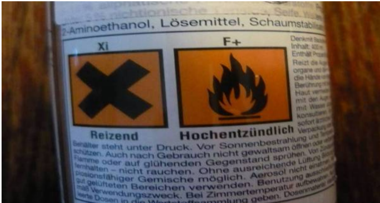
36. ábra. Jelzések az építőanyag csomagolásán

Írja le milyen jelképeket lát a fotón? Hová dobhatja a „üres” dobozt?