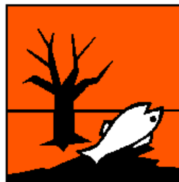
18. ábra. Környezetre veszélyes anyag

Első jelkép: irritatív anyag. Az emberi szervezetre káros vegyi anyagokat tartalmaz, a bőrrel való érintkezést és a felszabaduló gázok belélegzését is kerülni kell. Védőfelszerelésben kell végezni a munkát.