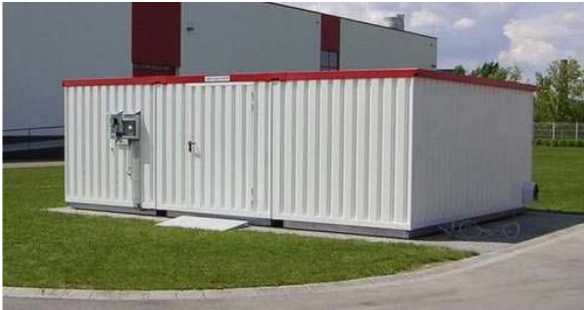
16. ábra. Környezetre veszélyes anyagok tárolására felállított építmény

A hulladékok nyilvántartásáról és adatszolgáltatásáról a 313/2005. (XII. 25.) és a 194/2007. (VII. 25.) Kormányrendelet rendelkezik. (Tanulásiirányító 6. pont)