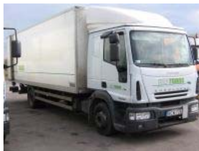
33. ábra Hulladék-begyűjtő, -szállító jármű