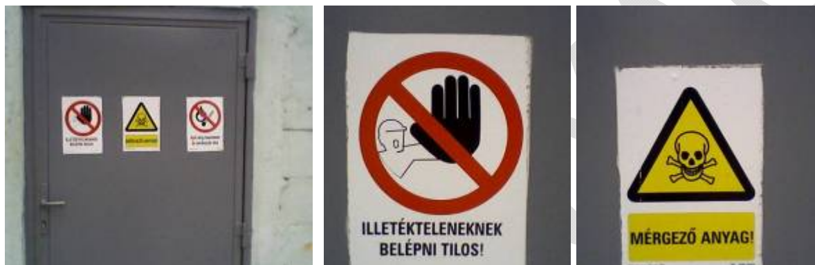
15. ábra. Környezetre veszélyes anyagok tárolására kijelölt helyiség figyelmeztető táblái

A fentiek alkalmazása esetén elkerülhetők a gondatlanságból bekövetkező szennyezések.