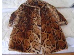
6. ábra. Szőrmebunda