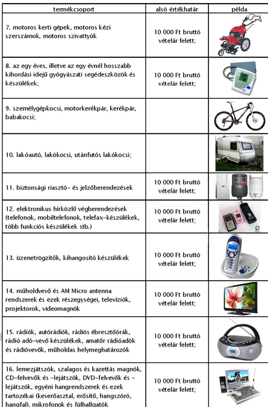
2. ábra. Jótállásra kötelezett termékek csoportjai 2.