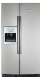
4. ábra. Korszerű hűtőszekrény

Az alábbi termékekhez kell-e jótállási jegyet adni? Ha igen, akkor mi a tartalma a jótállási jegynek? Válaszát írja le a kijelölt helyre!