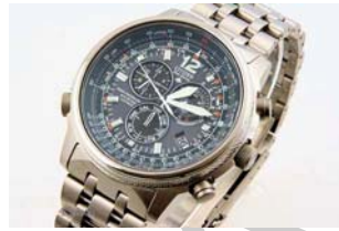
7. ábra. Férfi karóra