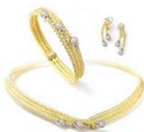
5. ábra. Ékszerek