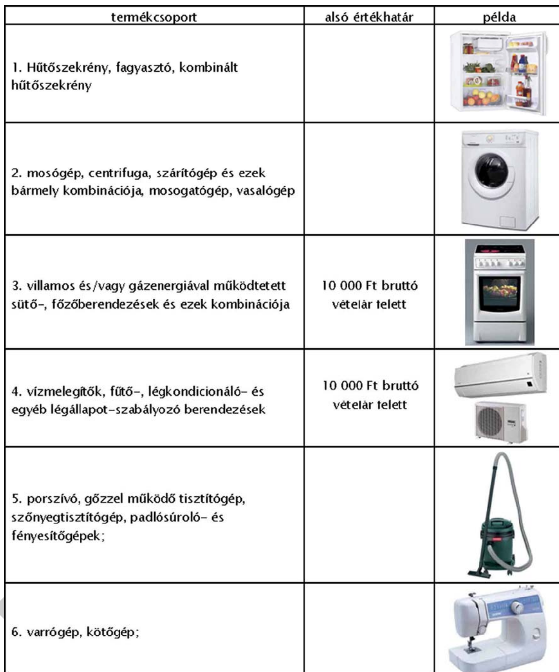
1. ábra. Jótállásra kötelezett termékek csoportjai 1.