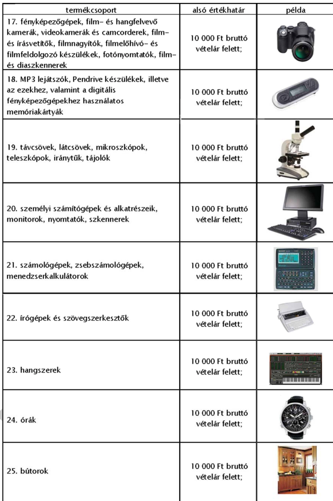
3. ábra. Jótállásra kötelezett termékek csoportjai 3.