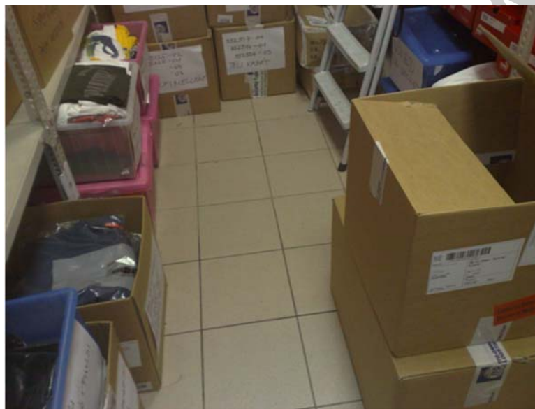
5. ábra. A raktárban a polcok mellett tárolt áruk miatt igen szűk a mozgástér

A tényállás: árukat tartalmazó dobozok polcokra rakodása a kézi raktárban – szakszerűen kifejezve: kézi anyagmozgatás segédeszköz nélkül. A raktár szűk, tele árut tartalmazó dobozokkal. Egyszerű, kissé sérült (a csúszásgátló papucs már korábban letört a létra egyik ágáról) háztartási kétágú létra áll rendelkezésre a magasabb polcok megközelítésére.