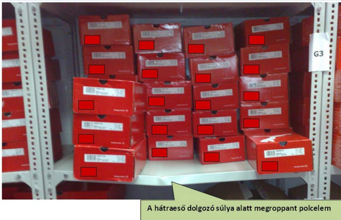
7. ábra. A zuhanás erejét mutatja a sérült polc