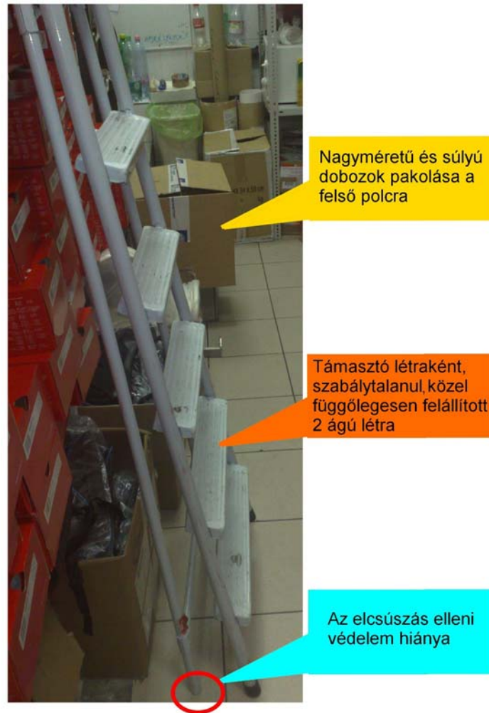
6. ábra. A baleset helyszíne