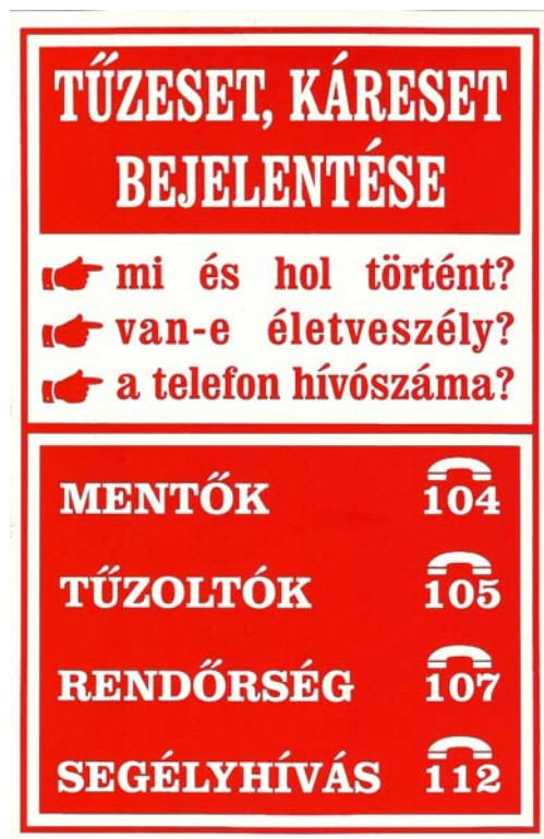
2. ábra. Tűzeset, káreset és személyi sérüléssel járó baleset bejelentése telefonon