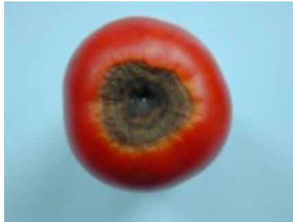
2. ábra. Nem megfelelő minőségű termék 2

A termék minőségével kapcsolatos észrevételeket helyes gyakorlat esetén úgy kell kezelni, hogy a vásárló megelégedjen a kapott szakszerű válasszal, a megoldással. Ha pl. kifogásolja a bemutatott élelmiszer épségét, frissességét, vagy a méteráru mintázatát, vagy összetételét, akkor az eladónak alaposabban kell tájékozódni a vásárló igényeiről és bemutatás során ki kell emelni az áru előnyös tulajdonságait, illetve másik azonos rendeltetésű terméket is be kell mutatni számára.