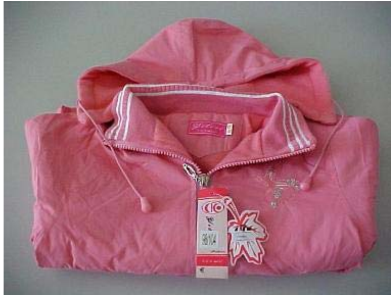
5. ábra. Nem biztonságos áru 7