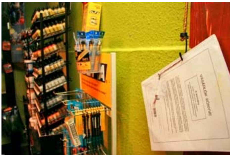
3. ábra. Az írásbeli panasz benyújtásának egyik lehetséges módja 3