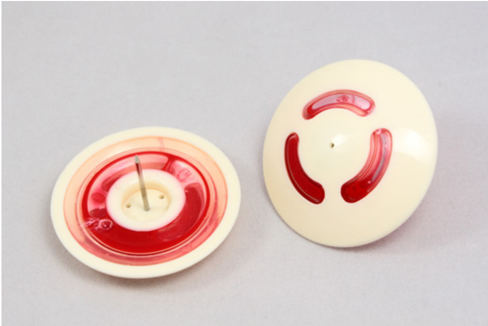
3. ábra. Tintapatronos kemény címke

A lágy címkék: általában papírcímkék. Ezek jól nyomtathatóak. Az igényektől függően márkajel, ár, a termék mérete, vonalkód stb. felvihető a felületre. Kedveltek a műanyag bevonatú dekorcímkék. A lágy címkék különböző méretű és színű változatait alkalmazzák. Az egyszer használatos etikettek bármelyik árura felhelyezhetőek, mert öntapadós kialakításúak. Az öntapadós címkék választékán belül megtaláljuk a deaktiválható és a nem deaktiválható típusokat is. Egyes változataikat a gyártó helyezi el a terméken és a kereskedelmi egységekben aktiválják. A kemény címkékhez hasonlóan a lágy címkék is alkalmasak forráscímkézés céljára. A forráscímkék a termék vételárának kifizetése után is aktív címkék maradhatnak. Biztonsági okok miatt előfordul, hogy egy termékre több címkét is felhelyeznek. Ezek egyikét úgy rejtik el, hogy a profi eltulajdonítók se tudják észrevenni. Készülnek ál-vonalkódos kivitelűek is. A lágy címkék hatástalanítóit is a pénztárnál helyezik el. Ezek pl. lap- vagy padszerű kialakításúak (úgynevezett deaktivátorpad), amelyek felülete felett csak át kell húzni a címkét és megtörténik a hatástalanítás. Ezután már a címke nem tudja működésbe hozni az áruvédelmi kaput. A vásárló szempontjából ez a legkedvezőbb, mert egy másik kereskedelmi egységben nem hozza szükségtelenül működésbe az áruvédelmi rendszert. Tehát a hatástalanított címke nem okoz téves riasztást.