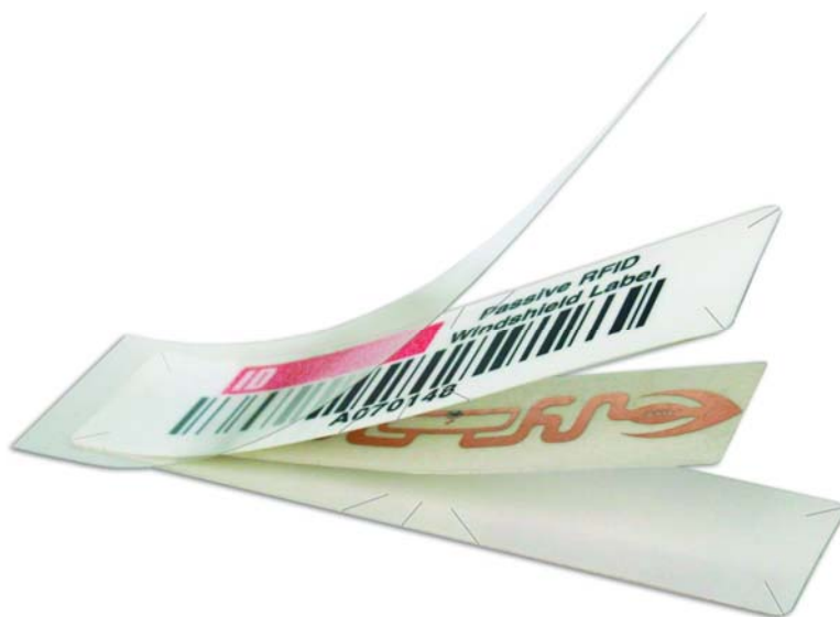
5. ábra. Passzív RFID címke