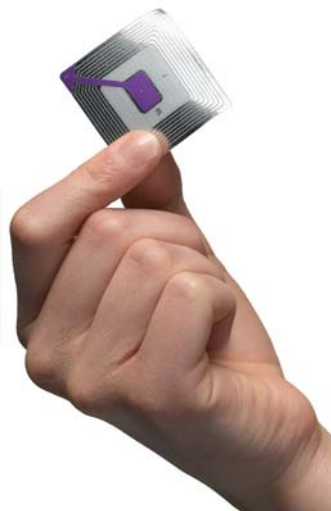
4. ábra. RFID címke

Az RFID tag-eknek három típusát használják: