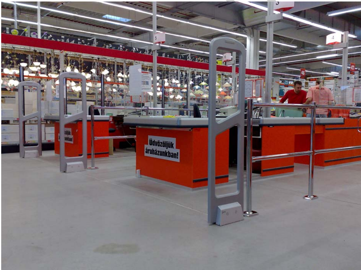
1. ábra. Elektronikus vagyonvédelmi rendszer alkalmazása egy kereskedelmi egységben 1

Nagyon kedvező megoldás a kettős EAS-RFID (Radio Frequency Identification) technológia is, amely biztosítja a termékazonosítást és a lopás elleni védelmet is. Ez a technológia biztosítja a termékek nyomon követését, korszerűsíti az áruforgalmi tevékenységet.