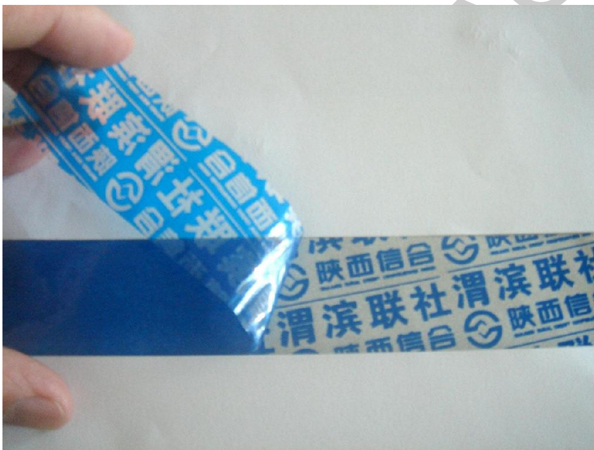
6. ábra. Szétszakadós címke