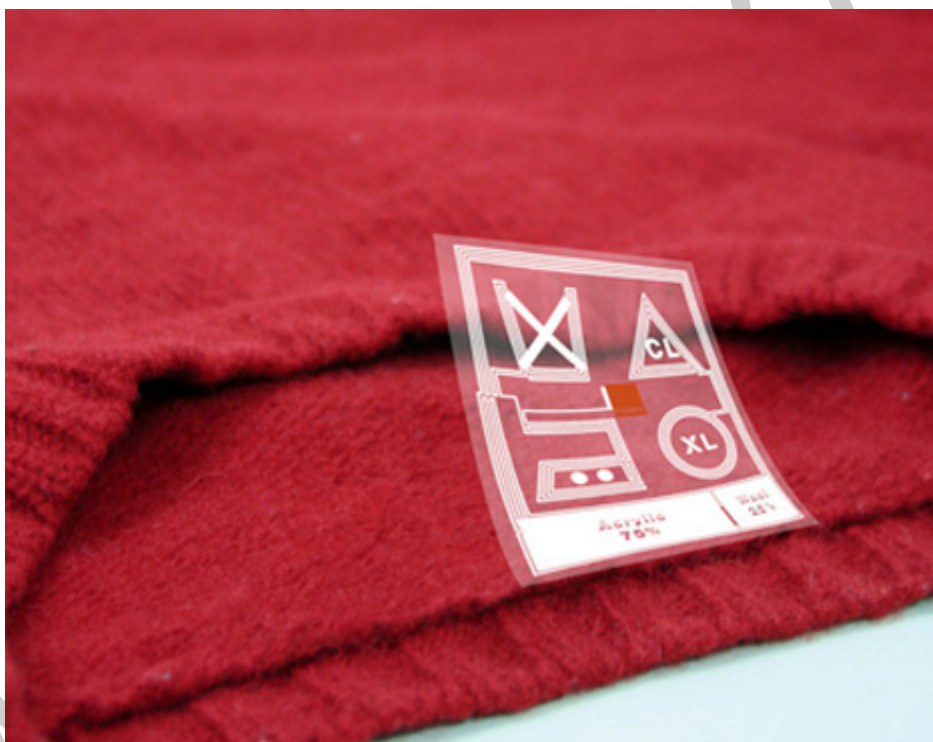
2. ábra. Áruvédelmi címke a ruházati terméken