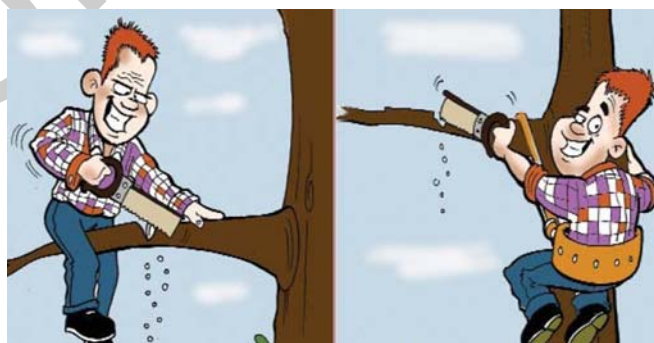
1. ábra. Munkavállaló felelőssége 1