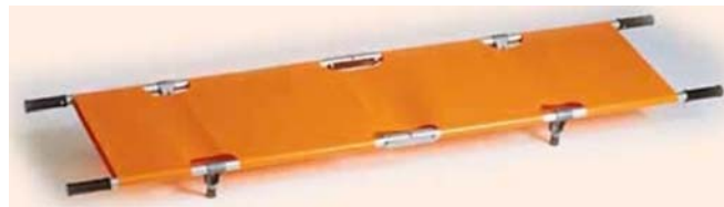
5. ábra. Hordágy 6

Az elsősegélyhelyen az elsősegélynyújtáshoz szükséges tisztálkodásra is elegendő mennyiségben ivóvizet, szappant és szükség esetén ipari kéztisztítószer, fertőtlenítő hatású kéztisztítószer és papír vagy egyszer használatos törülközőt, vagy kézszáritási lehetőséget is kell készenlétben tartani. Ha vezetékes ivóvíz nem megoldható, akkor zárt csapos tartályt vagy kézmosó tálat és ivóvizet kell biztosítani.