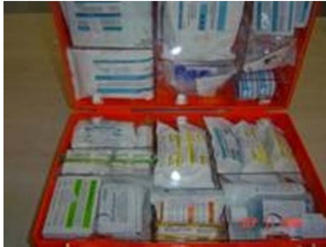
7. ábra. Söhngen színkódos láda 8