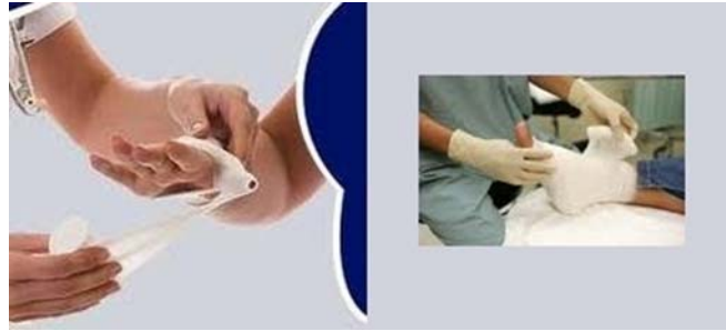
1. ábra. Sebkezelés kézen és lábon 1

Az elsősegélynyújtás alatt azt az egészségügyi beavatkozást értik, amelyet a szakszerű orvosi ellátás megkezdése előtt bárki végezhet, a baleset vagy hirtelen egészségkárosodás közvetlen körülményeinek elhárítása és az állapot további romlásának feltartóztatása érdekében.