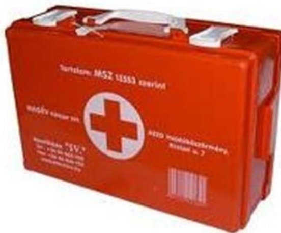
6. ábra. elsősegélyláda 7

Minden mentőláda záró szalaggal van lezárva. A záró szalag mutatja, hogy a mentőláda tartalma megfelel az MSZ 13553 szabvány előírásainak valamint azt, hogy a mentőláda mettől meddig érvényes.