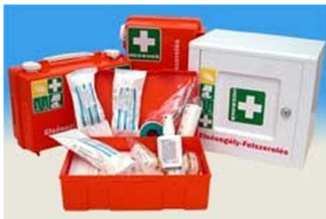
2. ábra. Elsősegélyláda 3

Az MSZ 13553 szabvány határozza meg a dolgozók létszámának megfelelő I-IV típusú mentőládáknál az elsősegélynyújtáshoz szükséges eszközöket, és azok darabszámát. Ezt a következő táblázat tartalmazza.