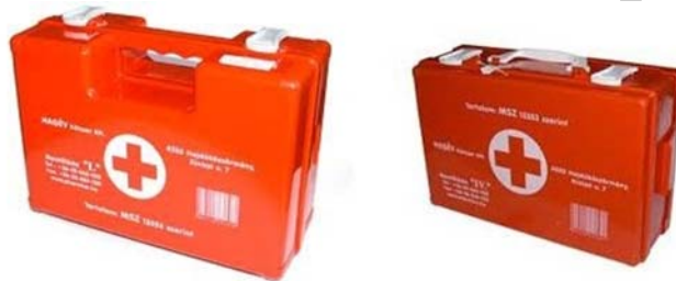
11. ábra. Elsősegély ládák 13