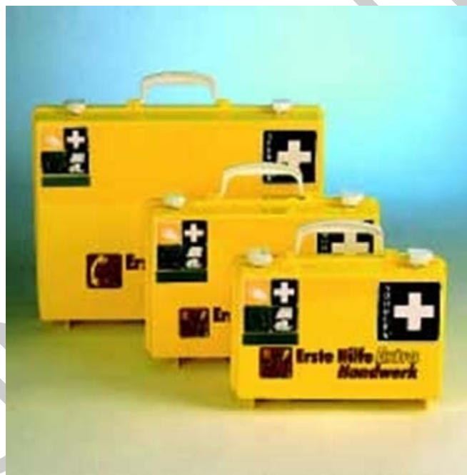
10. ábra. Extra elsősegély 12

EXTRA elsősegély-felszerelés citromsárga színben és piros felirattal, fényvisszaverő csíkkal