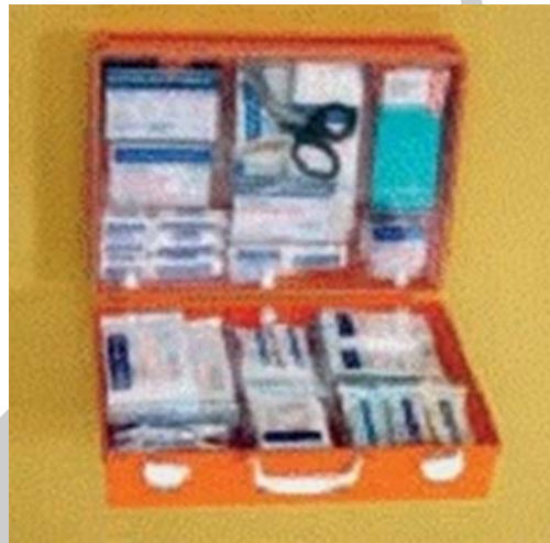
8. ábra. Színkód nélküli láda 9

Az alsó ládában minden kötszer kék-fehérbe van csomagolva, első ránézésre nem tudjuk, mihez nyúljunk. Ennél rosszabb a helyzet a régi típusú mentő ládáknál, mert ott egymásra szorosan pakolva helyezik el az elsősegély eszközöket. Emiatt értékes percek telnek el a megfelelő eszköz kiválasztásával.