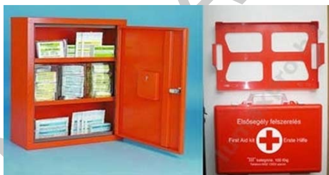
3. ábra. Falra szerelhető elsősegélyláda 4