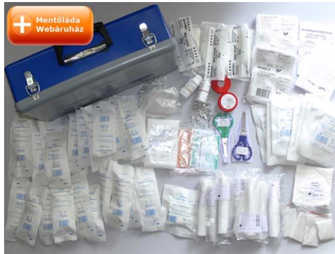
9. ábra. Kötszerek 10