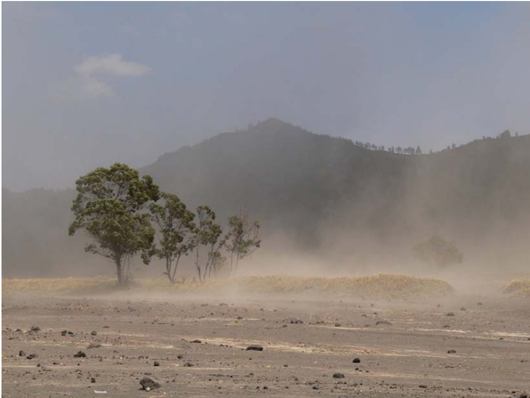
2. ábra. Homokvihar

Futóhomokon a szél által elmozdított kvarcsemecskék megsértik a növények föld feletti részeit, a kelőfélben levő fiatal növényeket teljesen meg is semmisíthetik. Ez az úgynevezett homokverés .