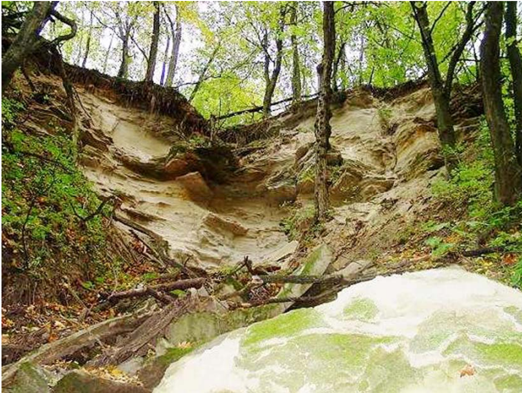
1. ábra. Vízmosásos erózió