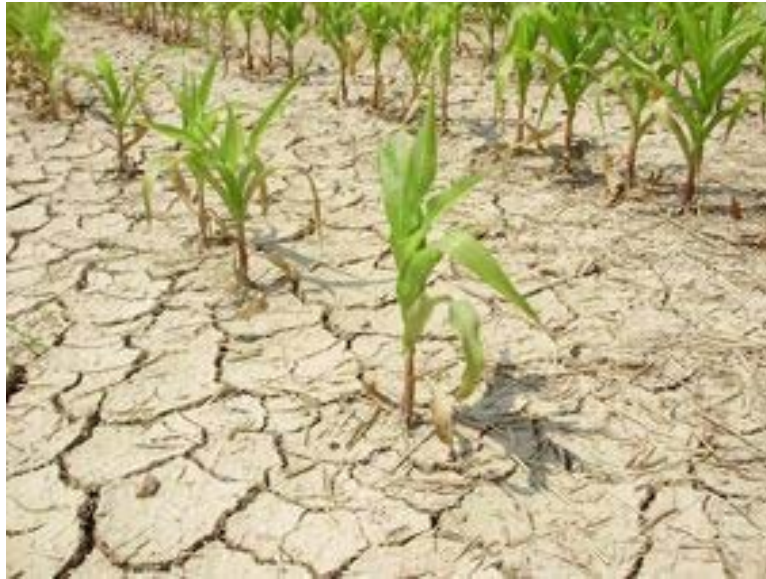
6. ábra. Fejlődésben visszamaradt kukorica