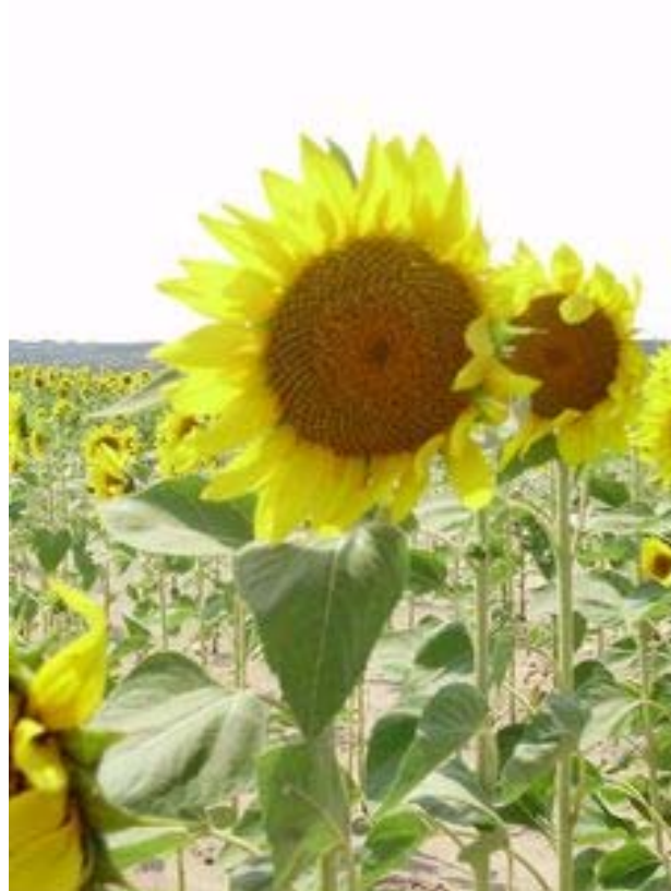
5. ábra. Napraforgó