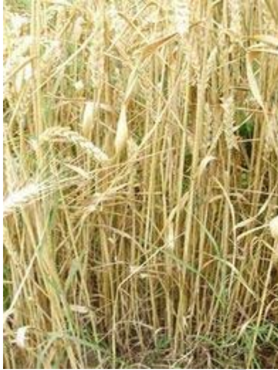
4. ábra. Őszi búza

Nappalhosszra közömbös növények: Azokat a kultúrnövényeket soroljuk ide, amelyeknek a virágzást nem befolyásolja a naponkénti sötétség- és megvilágítás tartama. Ide tartozik például a napraforgó és a paradicsom.