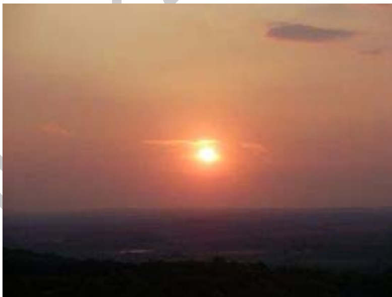
2. ábra. Lenyugvó Nap

A napsugárzás intenzitása igen nagy, négyzetméterenként 1,4 kW a Földet elérő teljesítmény, amely egy évben 1,6-szor 10^{18} kilowattóra energiát jelent. Ez a szám óriási, közel húszszerszer akkora, mint az emberiség teljes energiafelhasználása.