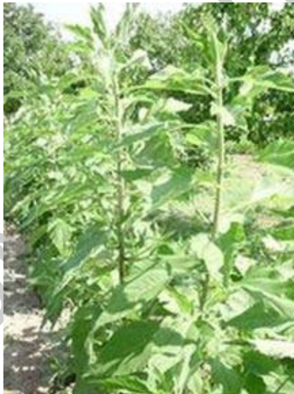
3. ábra. Csicsóka

Rövidnappalos növények: A virágképződéshez naponta 12 óránál rövidebb ideig tartó megvilágításra, de ugyanakkor naponta legalább 8-12 óráig tartó megszakítás nélküli sötétségre van szükségük. Ebbe a csoportba tartoznak a mérsékeltövi növények, valamint a trópusi és szubtrópusi származású növények, mint például az ananász, a bab, a köles, és a csicsóka.