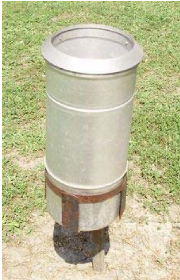
7. ábra. Csapadékmérő edény

A víz sokféle és nagyon összetett módon játszik szerepet a növények életében, anyagcseréjében. Befolyásolja az asszimilációt, a légzést, a párologtatást, a különböző szállító (transzport) folyamatokat. A magasabbrendű növények növekedési üteme sokkal érzékenyebben és gyorsabban reagál a vízellátás változására.