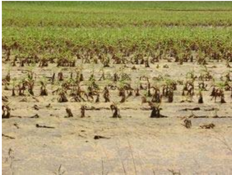
8. ábra. Belvízzel elárasztott kukorica

Hazánk szárazságra hajló éghajlata ellenére is előfordulhat olyan évjárat, amikor is a sok, hirtelen lehulló csapadék okoz károkat. A túlságos vízbőség belvizek, vagy árvizek formájában jelentkezik.