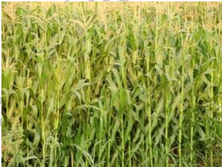
1. ábra. Kukorica

Véleménye szerint a növények fenológiája és az agrometeorológiai adatok között milyen összefüggések lehetnek?