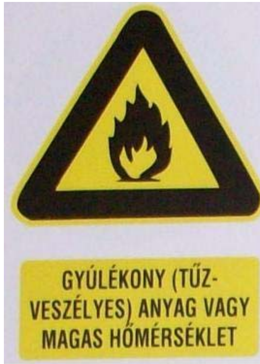
5. ábra. Gyúlékony anyag vagy magas hőmérséklet

Ugyanakkor a nem kellően hevített páka sem megfelelő, mert akkor nem jön létre adhéziós kötés, csak "ragasztás".