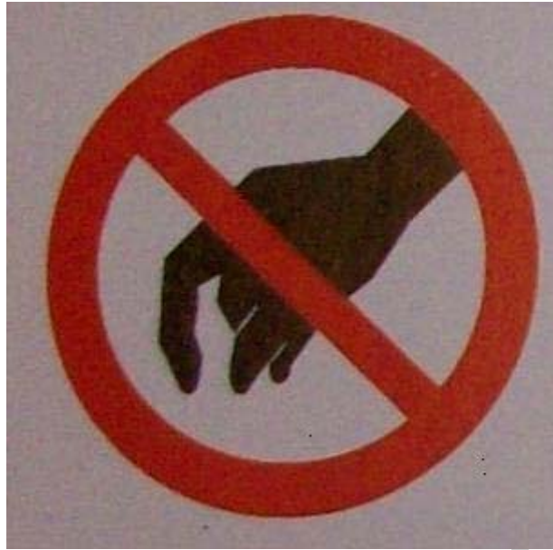
4. ábra. Palackhoz nyúlni szennyezett, olajos kézzel tilos!