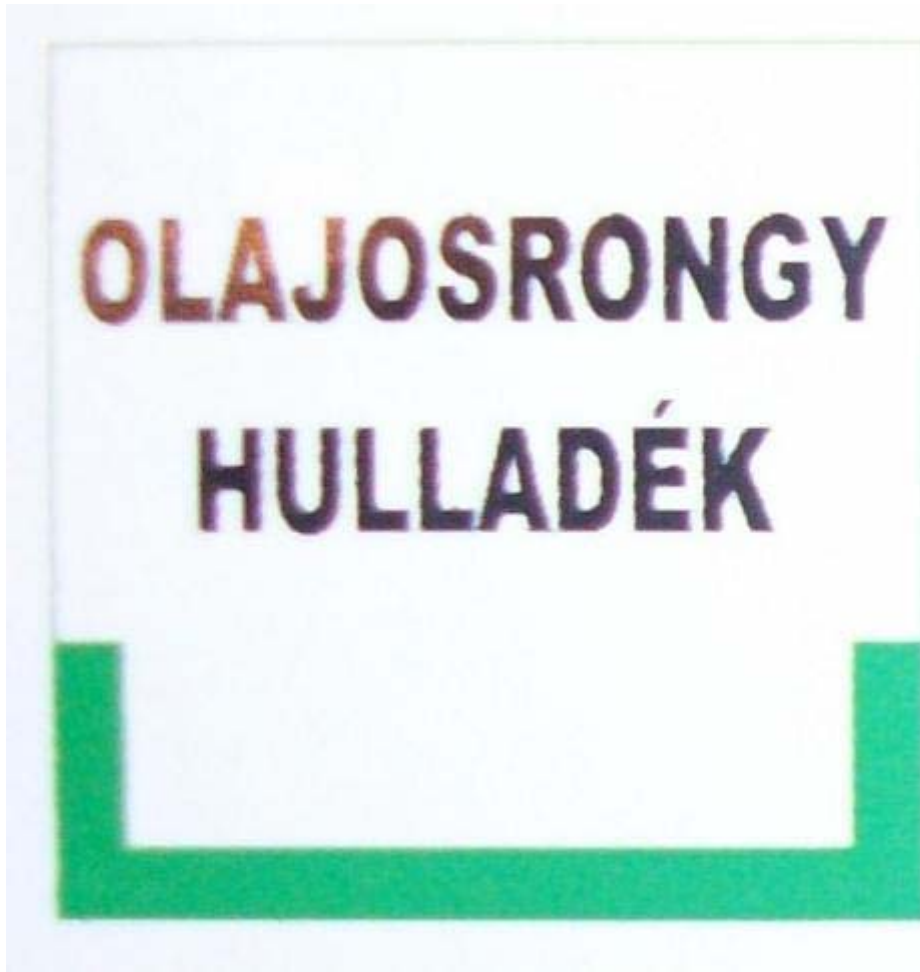
3. ábra. Olajosrongy hulladék gyűjtőedény jelölése