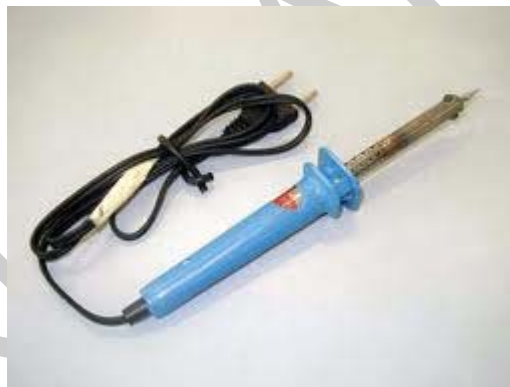
1. ábra. Villamos forrasztópáka

A lágyforrasztás, mint kötések létesítése alkatrészek között, a mindennapokból is ismert. Bármilyen hobbit művel az ember, már fiatalkorában is találkozik olyan helyzettel, hogy újra kell forrasztani egy fejhallgató, rádió, vagy egyéb elektromos eszköz vezetékét. Gond, probléma ez? Nem! Ha nekem nincs gyorsforrasztó pákám, akkor van a barátomnak, vagy a szomszédomnak. Ha bátor vagyok, meg sem kérdezem, hogy kell csinálni, majd rájövök magamtól... És rá is jövök. Csak közben "megég" a kezem, "tönkre teszem" az íróasztalom fényezését, stb. Lehet, hogy kérdezniem kellett volna...?