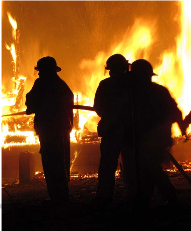
1. ábra: Munkában a tűzoltók

Tűz keletkezése esetén az azt észlelő személynek rögtön riasztania kell munkatársait. Értesíteni kell a tűzoltóságot a 105-ös vagy a 112-es segélyhívó számon.