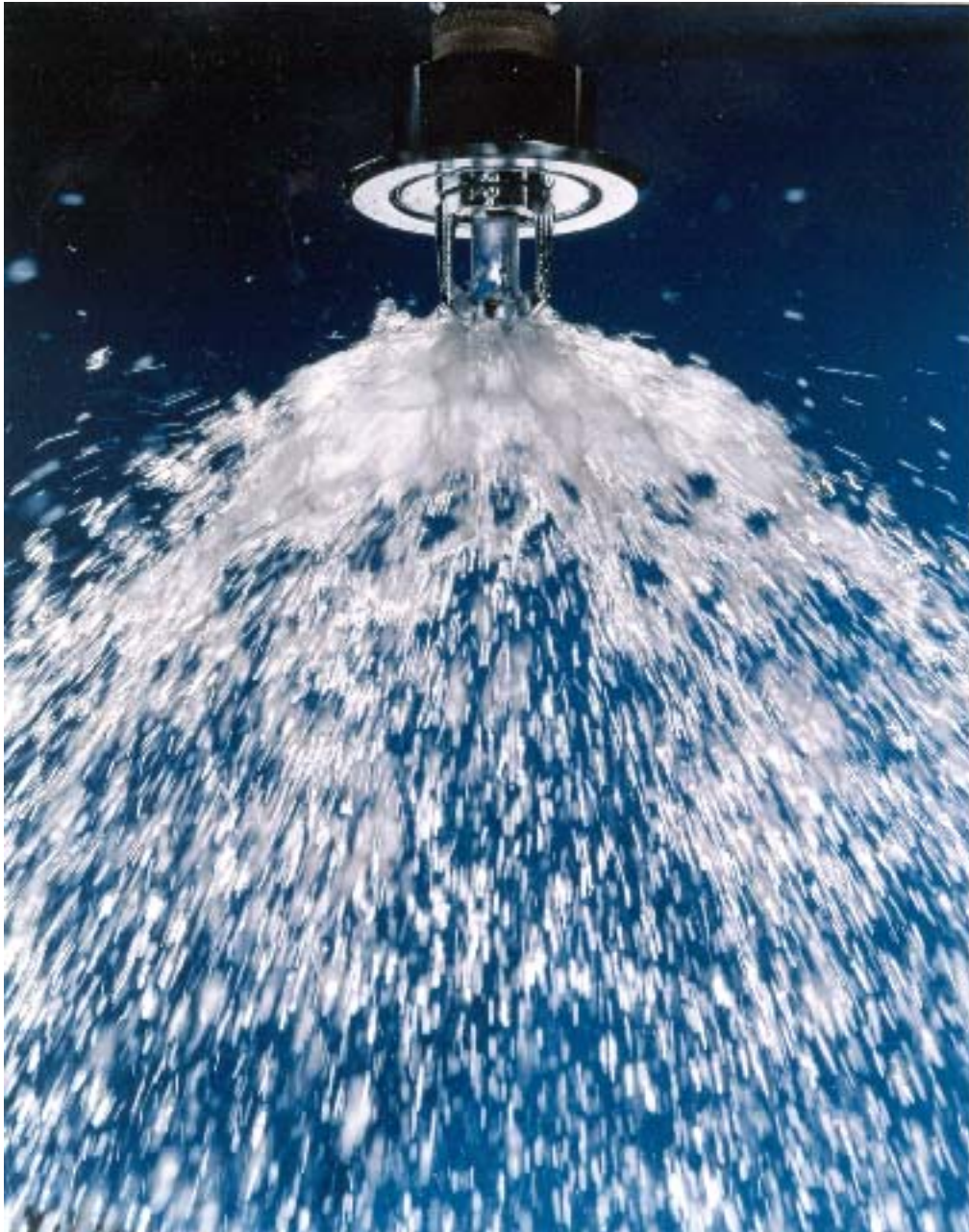
2. ábra: Sprinkler működés közben

A sprinkler fej folyamatosan nyomás alatt van, ezzel csaknem azonnal olt, amint az érzékelő kiolvadt. A csőben lévő nyomásváltozás beindítja a riasztóberendezést is.