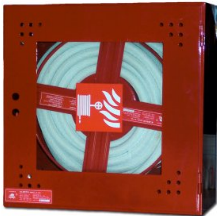
3. ábra: Tűzoltó szekrény felcsévelt tűzoltó tömlővel

Tűzoltó készülékek: nyomás alatt álló tűzoltó berendezések, melyek tűzoltó anyagot tartalmaznak. Ezt a tűzre irányítva és általában egy biztosító szeget eltávolítva megkezdhető az oltás. Különbözőképpen kialakult tüzekre különböző oltóanyagok használhatók.