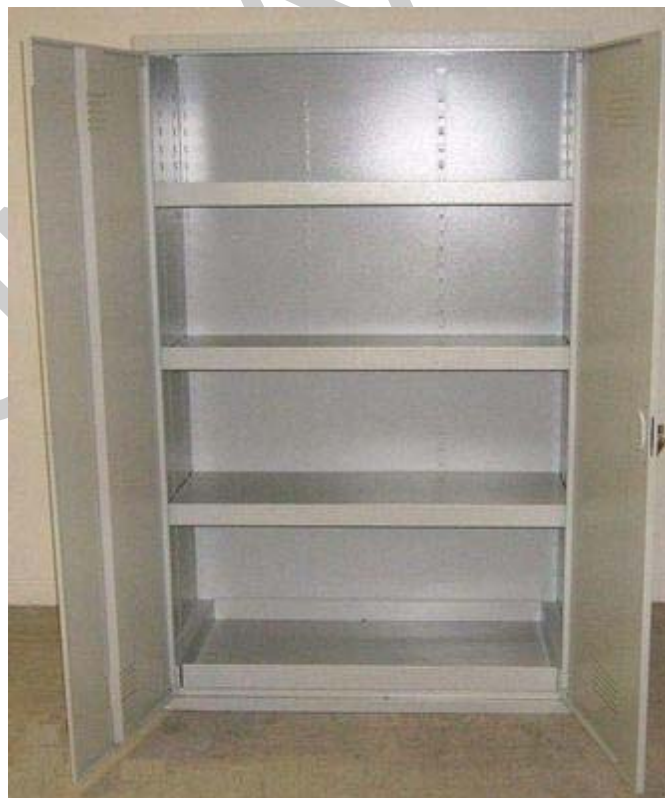
19. ábra. Zárható veszélyes anyag tároló szekrény