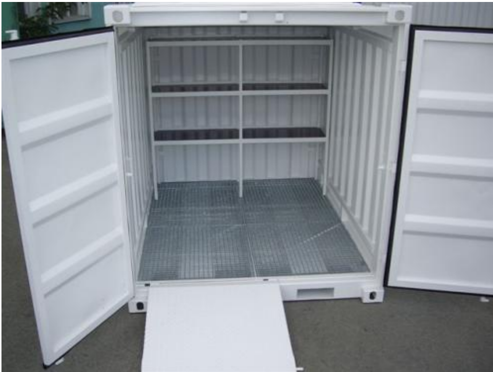
18. ábra. Kármentő tartályos konténer veszélyes anyagok (olaj, festék termékek, akkumulátorok) tárolására