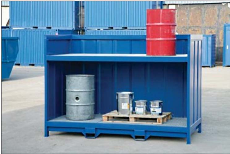
20. ábra. Szabad téri munkahelyeken is használható veszélyes anyag tároló

Tűz- és/vagy robbanásveszélyes anyagok, készítmények esetén a tárolás, raktározás, használat tűzvédelmi előírásait is ismerni és betartani szükséges.