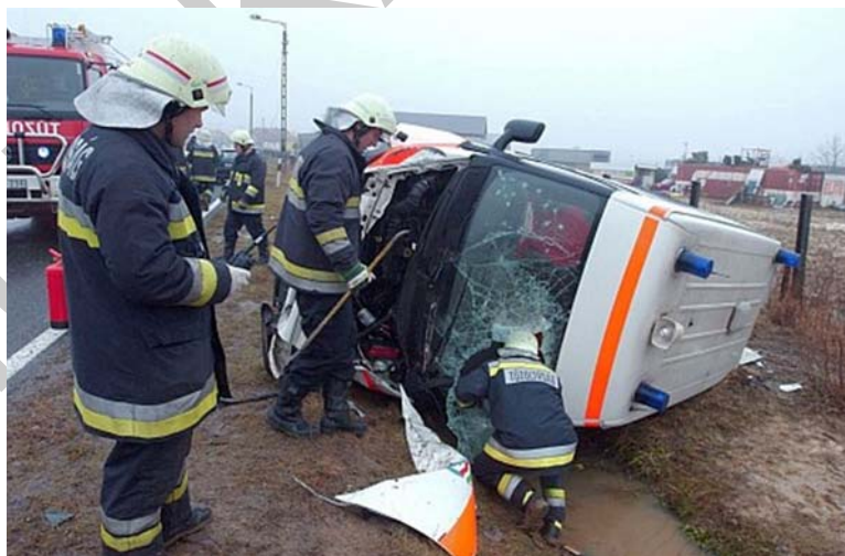
1. ábra. Műszaki mentés 1

A tűz elleni védekezésről, a műszaki mentésről és a tűzoltóságról szóló 1996. évi XXXI. törvény az élet- és vagyonbiztonságot veszélyeztető tüzek megelőzése, a tüzesetknél, a műszaki mentéseknél való segítségnyújtás, és a tűz elleni védekezésben résztvevők jogait, kötelezettségeit, valamint a védekezés szervezeti, irányítási rendjének, személyi, tárgyi és anyagi feltételeit szabályozza.