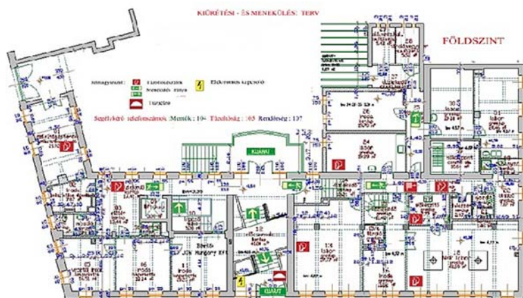
6. ábra. Tűzriadó terv melléklet 6

A tűzriadó tervben (30/1996. (XII. 6.) BM r. a tűzvédelmi szabályzat készítéséről) az alábbiakat kell leírni: