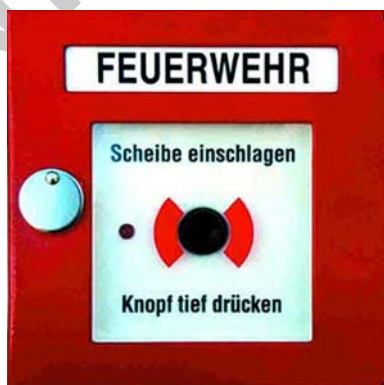
7. ábra. Tűzjelző rendszer nyomógomb 7

A tüzet épületen belül jelezhetjük szóban (tűzilármával, ezzel azonban vigyázni kell, nehogy pánikot okozzunk), telefonon, és ha van az épületben tűzjelző berendezés, annak kézi jelzésadóival. Utóbbi esetben lehetőleg a tűz közeléből (és ne három emelettel lejjebb) jelezzünk – ugyanis ezzel a tűz tényleges helyét is megadjuk azoknak, akik a tűzjelző központnál vannak és intézkednek.