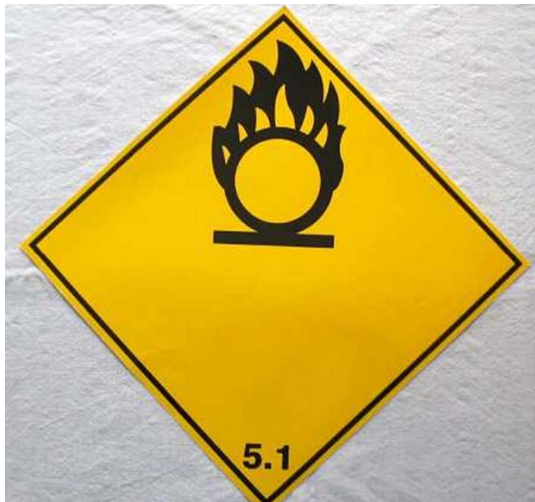
4. ábra. Oxidáló anyagok jelképe 4