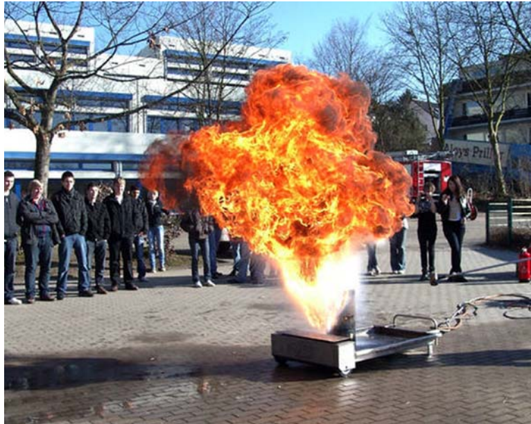
2. ábra. Tűzvédelmi oktatás 2

A munkáltató köteles előírni a tűzvédelmi szabályzatban, hogy melyik munkahelyen milyen gyakorisággal és ki köteles a dolgozók tűzvédelmi továbbképzését elvégezni.