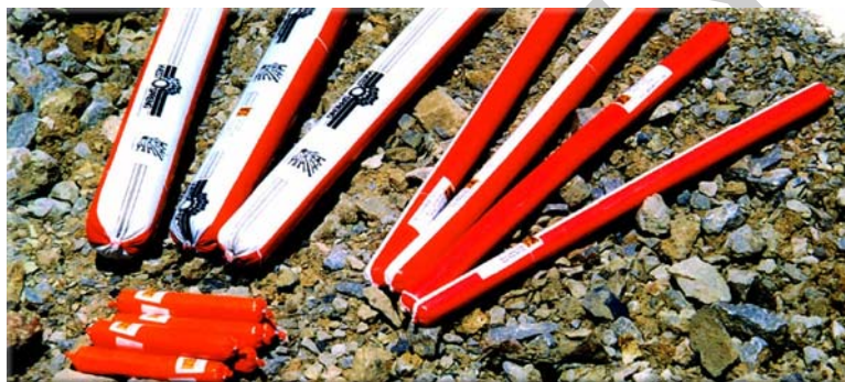
3. ábra. Robbanóanyag 3