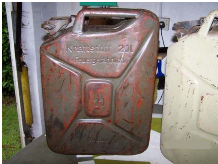
5. ábra. Tűzveszélyes anyag 5

kevésbé tűzveszélyes anyagok és készítmények: