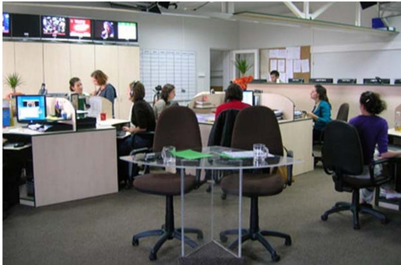
1. ábra. Szerkesztőség 1

A médiában elengedhetetlen az információk minél gyorsabb rögzítése, feldolgozása és továbbítása a közönség felé. Tegyük fel, hogy Ön e területen dolgozik. Az egyik tudósítójuk szenzációs hírral hívja Önt, amit minél gyorsabban írásban rögzítenie kell a pontosság és hitelesség érdekében. Szerencsére megértette a gépírástanulás során a jól használható sebességű adatbevitel fontosságát, és lelkiismeretesen gyakorolt, ezért Ön versenyképes pozícióban van írássebességét illetően. Pillanatok alatt legépeli és közölhetővé teszi a hírt, felettesei legnagyobb meglepedésére. Hurrá, ismét értékes időelőnyre tettek szert a konkurens médiával szemben!