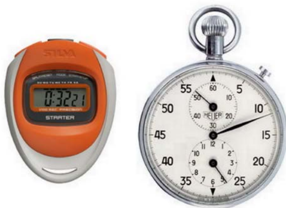
2. ábra. Modern és hagyományos stopperóra 2

A sebességfokozás során nagy szerephez jut az idő, és annak mérése. Jó szolgálatot tesz e célból egy stopperóra, noha nincs szükségünk századmásodperc pontosságú mérésre, mint a sportban. Viszont jól láthatja, hogyan fejlődik írástempója, illetve azt is, hogy a gyorsaságra vagy a hibátlanságra kell nagyobb hangsúlyt fektetnie a gyakorlás során.