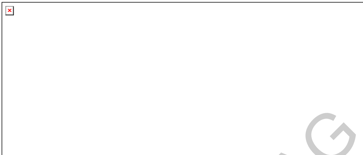
4. ábra. Ujjtorna – ujjkörzés