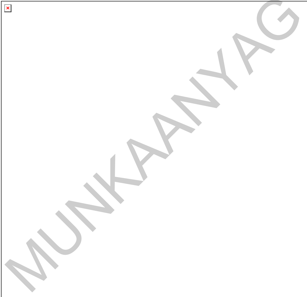
3. ábra. Hibahatárok javítható feladatokhoz

Munkája minősítésére a már jól ismert táblázatot használhatja: