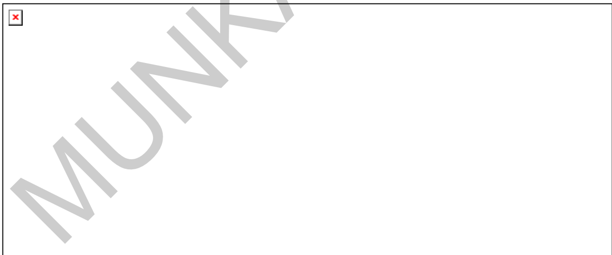
7. ábra. Ujjtorna – terpesztés