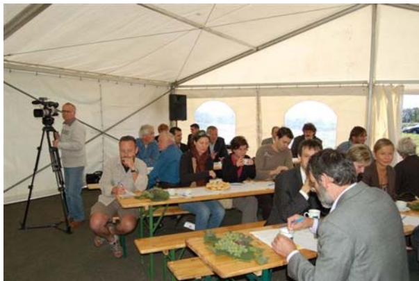
8. ábra. Sajtókonferencia 10

Az újságíró legfontosabb információ forrásai: sajtóirodák, sajtókonferenciák. Az irodák kérésre rendelkezésre bocsájtják a médiumoknak a kért információkat. A sajtókonferenciák a hírgyűjtés mellett személyes kollegiális kapcsolatépítést is szolgálnak. A szerkesztőségek rengeteg PR rendezvényre kapnak meghívást, szelektálásukra is gondot kell fordítani.