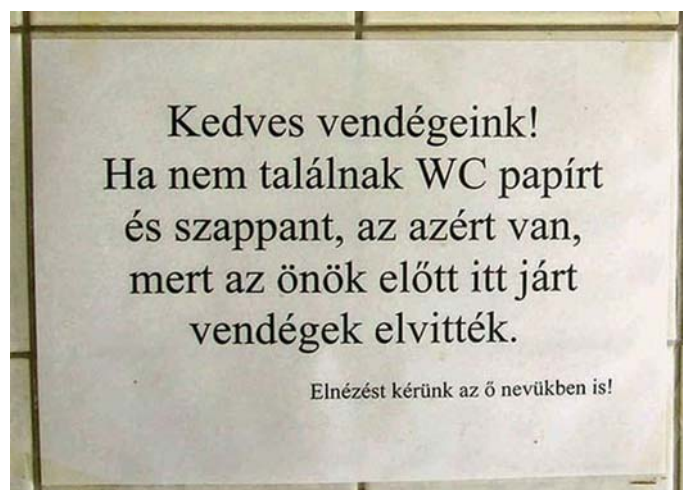
9. ábra Téma glosszához 11

Glossza: ironikus, túlzó, leleplező, humoros, gúnyolódó, szubjektív műfaj. Szórakoztatja az olvasót. Események hatására keletkeznek, de lehetnek spontán ötletből kiindulóak.