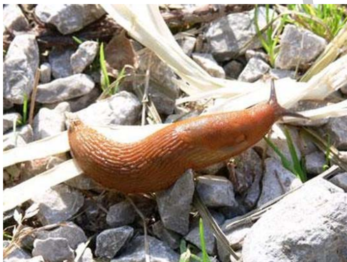
10. ábra. spanyolcsiga 12

2. Az egyik kereskedelmi tv hírműsorában megjelent egy hír, hogy az Ön megyéjének egyik településén úgy elterjedt a spanyol csiga, hogy esős időben már a közlekedés is életveszélyessé vált gyalogosan, biciklivel. A kiskertekben a növényeknek csak a csupasz szárai vannak, a leveleket, termést mind lerágták a csigák. Keressen információkat a spanyol csigáról! Gyűjtse össze azokat a cikkeket, riportokat, melyek a csiga elszaporodásáról szólnak országosan is, és a megyében a fertőzött területeken, Rendszerezze, elemezze ezeket a dokumentumokat! Kérjen időpontot közegészségügyi és növényvédő szakembertől, kérje ki a véleményüket az emberre és talajra nem káros védekező szerről. Tegyen javaslatot főnökének, hogy milyen információ tartalmú cikket lehetne e témából írni.