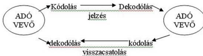
1. ábra Shannon-Weaver modell 1

Minden élőlény kommunikál. A tudomány legtöbbet az állati kommunikációval foglalkozik. Az állati kommunikáció leginkább a faj társas voltától függ, de fontos a genetikai fejlettsége is. Mi a tananyagban az emberi kommunikációval foglalkozunk, csak érintőlegesen teszünk említést az állati kommunikációról.