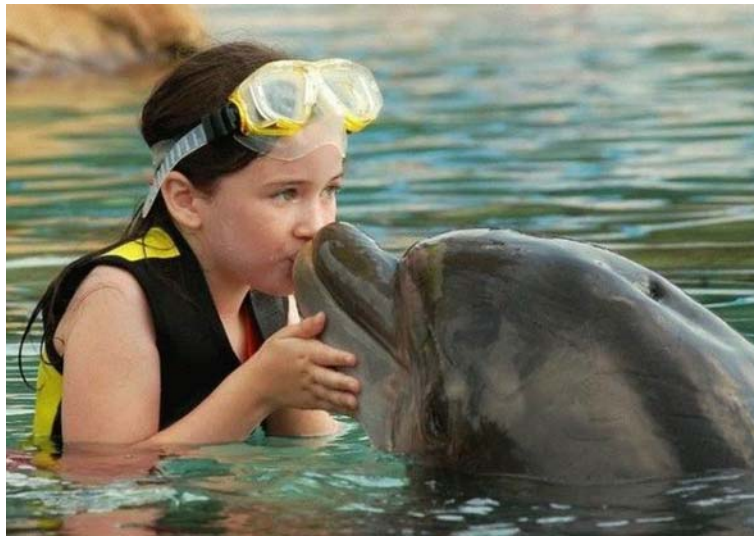
3. ábra érzelem kifejezése állatnak 3