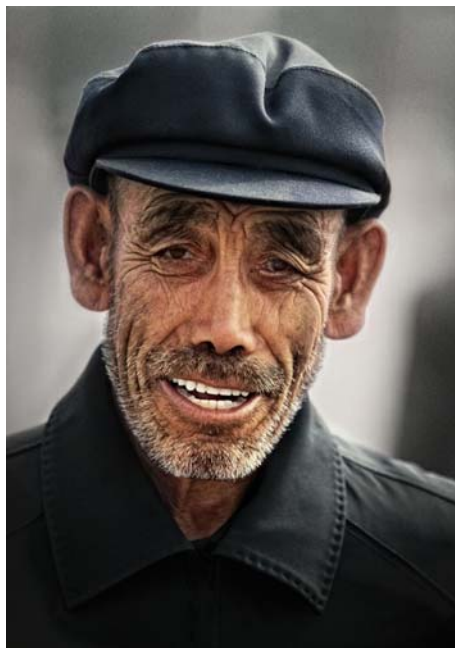
4. ábra. Aramiss: Kínai férfi 4