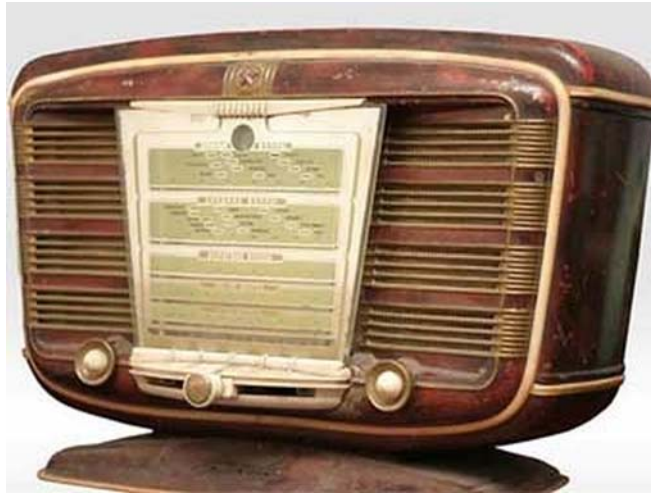
6. ábra. Ma már muzeális tárgy e rádió 6

4. A számítógép, internet megjelenése újabb jelentős változást hozott, mely mára már képes a világot összefogni, híreket terjeszteni és tárolni.