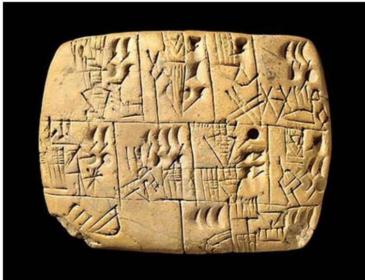
5. ábra. agyagtábla 5

1. Amikor még kézzel írt agyagtáblákról, papírtekercsekről, kódexekről és az információk szóbeli terjesztéséről beszélünk.