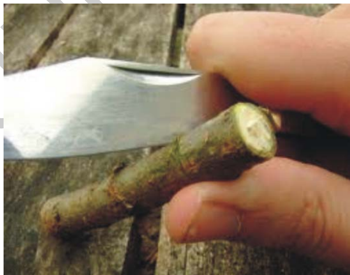
8. ábra. Faragókés

A szúróárak hegyét megfelelően kell kialakítani és típustól függően közök tágitására vagy munkadarab felszűrésére használjuk.