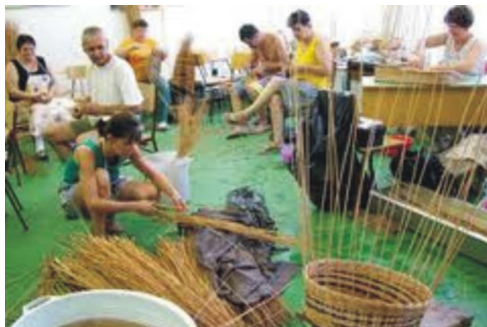
4. ábra. Nyári alkotótábor – kosárfonás

A műhely kialakításához a helységet úgy kell megválasztani, hogy megfelelően szellőzzön, de a megfelelő klíma érdekében a mesterséges klíma berendezésről is gondoskodni kell. A szálás anyag feldolgozó, de különös tekintettel a kosárfonó és fonott-bútorkészítő műhelyek állandóan párásak, nyirkosak és az ebből származó egészségkárosodás (ízületi bántalmak kialakulása) érdekében a gyakori szellőzés, a klíma beállítása nagyon fontos.