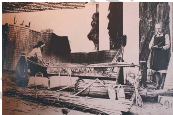
9. ábra. Gyékényszövés Sarródon