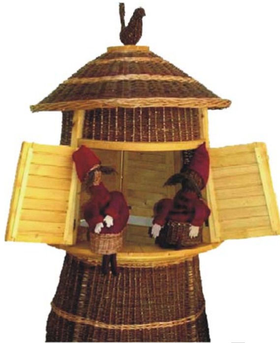
16. ábra. Bábszínház (Esély Kövessi Erzsébet Szakképző Iskola kosárfonó diákjainak munkája)