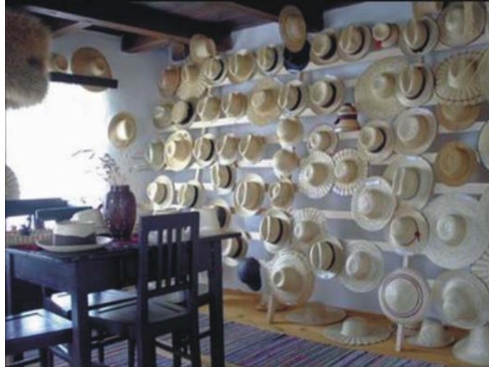
13. ábra. Szalmakalap Múzeum, Kőrispatak (A múzeum magánkezdeménnyezésre jött létre.)

Hogyan is lehet létrehozni, először is nagyon fontos végig gondolni a helyszínét, a műhely színterének, esetleg társművészetek bemutatására is. Ha megtaláltuk az alkalmas helységet, amelynek alkalmasnak kell lenni kisebb nagyobb közösségek befogadására. A szükséges papírforma, engedélyek elintézése után neki láthatunk a feladatnak.