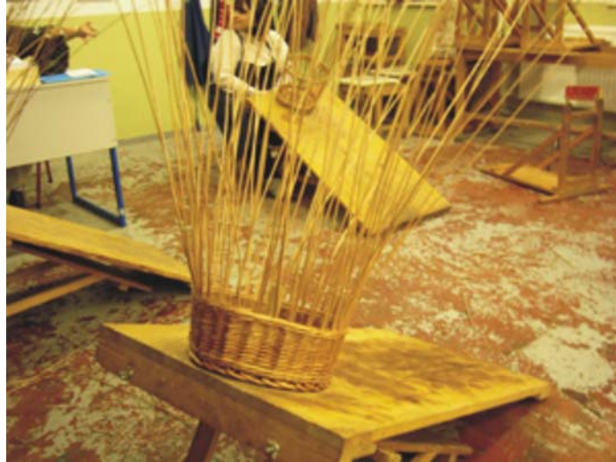
7. ábra. Kosárfonó munkadeszka

Ezekre az eszközökre és berendezésekre a műhely kialakításához feltétlenül szükség van. A felsorolt szerszámok közül legfontosabb a metszőolló . Ennek nagyon jó minőségűnek kell lenni és a jó minőséget a megfelelő acél és a csavarozással való szétszerelhetőség biztosítja. Csak abban az esetben lehet a karbantartást elvégezni, ha szét tudjuk szedni az ollót.