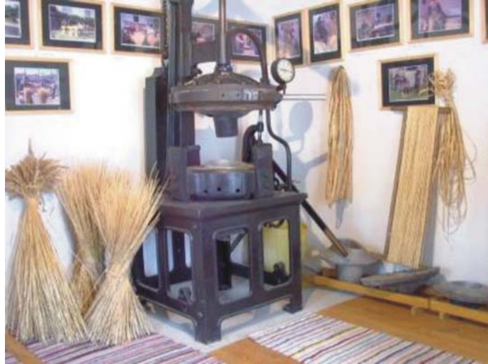
10. ábra. Kalapprés, Kőrispatak, Szalmakalap Múzeum