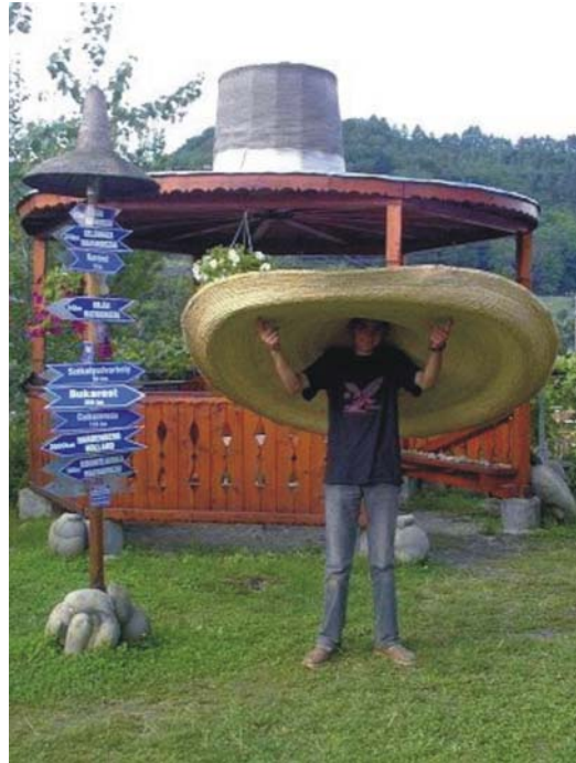
15. ábra. Egy kalap alatt minden el lehet intézni – mondják Kőrispatakon

A kézműves játszóházak is nagyon nagy szerepet töltenek be a különböző mesterségek megismerésében. A játszóház ismétlődő vagy egyszeri találkozásra ad lehetőséget mesternek és érdeklődőnek egyaránt. A játszóházat vezető mesternek hihetetlen empátiával kell rendelkezni, hogy pár órán keresztül irányítani tudja az alkalmi közönséget, pl. a karácsonyi készülődés programjában szalma, csuhé vagy gyékény karácsonyfadíszek készítésénél. Először is meg kell ismertetni az anyagot, tulajdonságait és meg kell tanítani az alapvető technikákat, csomózásokat. Közben óriási felelősséggel ügyelni arra, hogy a következő generáció okosodjon tőle, sőt akár még kézműves is válhasson belőle. A kézműves játszóház vezetésére fel kell készülni eszközzel, anyaggal, a mesterséget bemutató fotókkal, a mesterségről szóló történetekkel, esetleg mesével vagy egy odaillő dallal.