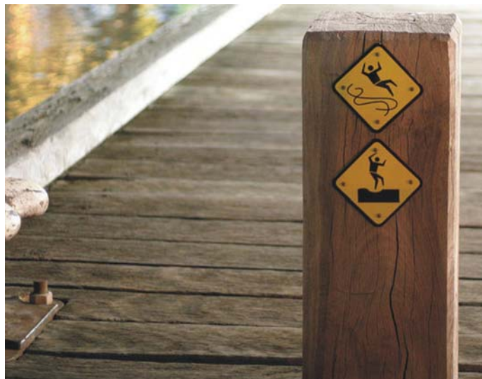
5. ábra. Veszélyhelyzet jelölése

Ahhoz, hogy a ránk bízott feladatot magas színvonalon lássuk el, megfelelő munkagépeket, eszközöket, berendezéseket kell biztosítani és ezeknek üzembe helyezéséről gondoskodni kell, a megfelelő feltételeket meg kell teremteni. A kosárfonó műhely esetében az áztatókád lehetőség szerint külön helyiséget igényelne, megfelelő hideg-meleg vízellátással, csöpögtető ráccsal ellátva.