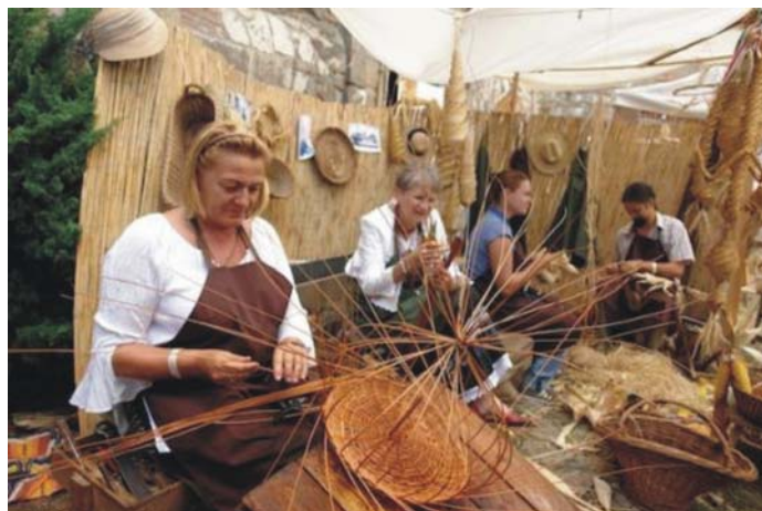
3. ábra. Mesterségek Ünnepe 2010.

Meghívják egy mesterség bemutatóra, játszóházba iskolák gyerekekhez. Készüljön fel a feladatra! Milyen szempontok szerint alakítja ki a 2–3 óra időtartamú találkozást a gyerekekkel?