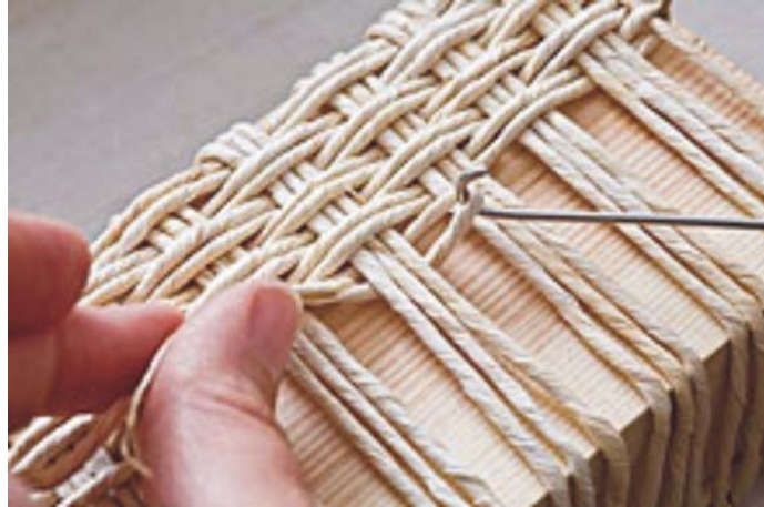
12. ábra. Kaptafán készülő szatyor

A gyékény–szalma–csuhé feldolgozó mesterség lényegesen kevesebb munkaeszközt igényel, mint a kosárfonó. Az alapanyag beszerzése ma is önellátással működik.