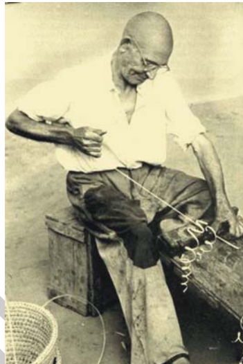
11. ábra. Szijácsot készítő szalmakötő

A kukoricacsuhé feldolgozásához szükség van: