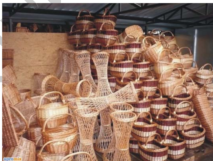
6. ábra. Raktározás

A raktározás a műhelytől és áztatóhelységtől független száraz helységben történjen az anyag és áru megóvása érdekében. Fontos a biztonságos áru és anyagmozgatás kialakítása is.