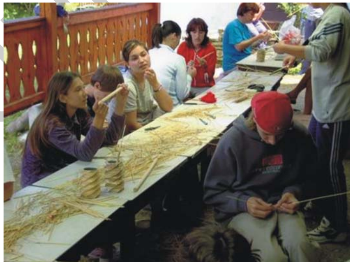
14. ábra. Mesterség bemutató a Szalmakalap Múzeum udvarán. Kőrispatak

Mit is szeretnénk? Bemutatni a mesterségünket úgy, hogy az érdeklődő túl azon, hogy valamilyen fonott terméket vásárolhasson, betekinthesse a szakma múltjába és jelenébe: szippantson egy keveset abból a múltból, ami a mesterségünk múltját jelenti és érezze meg azt az alkotó folyamatot, amiben időről-időre megújul.