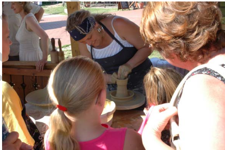
8. ábra. Mesterség-bemutató a gyulai Sokadalomban

A fazekas mesternek fel kell készülnie a mesterség-bemutatóra, össze kell készítenie a felszerelését, a szerszámaikat. Minden olyan szerszámot és eszközt magával kell vinnie, amelyeket az edénykészítés során használni szeretne. Általában a fazekasnak van olyan korongja, amelyet ilyen esetekben hordozni tud. A fazekas is, mint a többi mester, vagy "művész" kényes azokra a szerszámaira, amelyekkel nap, mint nap dolgozik, tehát valószínűleg rendelkezik két garnitúra szerszámmal és eszközzel, amelyek közül az egyiket mobilan vihet magával vásárról vásárra. Manapság már a mesterek előszeretettel viszik magukkal az elektromos korongot, mert az kisebb, könnyebben szállítható, bár nem igazán autentikus. Tehát sokszor előfordul, hogy mégis a lábbal hajtós korongot viszik, mert az az igazi, a hagyományos forma