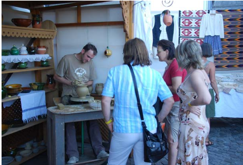
7. ábra. Mesterség-bemutató a Mesterségek Ünnepe

A fazekas mesternek fel kell készülnie a mesterség-bemutatóra, össze kell készítenie a felszerelését, a szerszámaikat. Minden olyan szerszámot és eszközt magával kell vinnie, amelyeket az edénykészítés során használni szeretne. Általában a fazekasnak van olyan korongja, amelyet ilyen esetekben hordozni tud. A fazekas is, mint a többi mester, vagy "művész" kényes azokra a szerszámaira, amelyekkel nap, mint nap dolgozik, tehát valószínűleg rendelkezik két garnitúra szerszámmal és eszközzel, amelyek közül az egyiket mobilan vihet magával vásárról vásárra. Manapság már a mesterek előszeretettel viszik magukkal az elektromos korongot, mert az kisebb, könnyebben szállítható, bár nem igazán autentikus. Tehát sokszor előfordul, hogy mégis a lábbal hajtós korongot viszik, mert az az igazi, a hagyományos forma