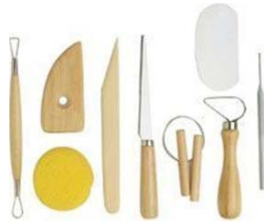
5. ábra. Kéziszerszámok 1

Egy fazekasműhely kialakításának fontos feltétele, hogy mind szakmai, mind pedig munkavédelmi szabályoknak mindenben megfeleljen.