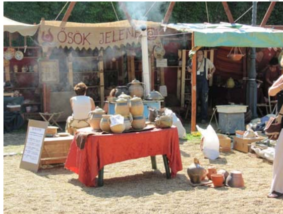
9. ábra. Fazekas stand és bemutató sátor a Mesterségek Ünnepe

Vinnie kell magával az eszközeit, amelyeket korongozás közben használ, valamint egy focsos tálat. Sokan beleesnek abba a hibába, hogy műanyag tálat visznek magukkal, de az még kevésbé autentikus, mint az elektromos korong. Tehát a cseréptál az alkalmas ebben az esetben. A kéziszerszámokat is vinnie kell, ezek kishelyen elférő szerszámok, általában a szivacs mellett a tálban szokták hordani. Célszerű, ha a fazekas visz magával egy vödröt is, amiben vizet készít a korong mellé, hogy kezét tudja mosni. Törölközőre és munkásruhára is szüksége van, de legalább is egy jó kötényre, amely megvédi a ruháját az agyagos szennyeződéstől. Nagyon fontos, hogy a megfelelő agyagot is odakészítse a mester a bemutatóhoz, ennek megfelelő csomagolásáról is gondoskodnia kell, hiszen a rosszul csomagolt agyag nagyon rövid idő alatt megszárad és akkor használhatatlan lesz a visszadolgozásig. Erre különösen nyáron, szabadtéri mesterség-bemutatókkor fontos odafigyelni, mert a melegben és a szélben sokkal gyorsabban szárad meg az agyag.