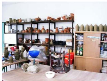
1. ábra. Fazekasműhely polcrendszer