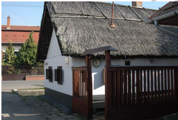
4. ábra. Fazekas ház Mezőkövesden

A hagyományos fazekasműhelyek másik alapvető eszköze az őrlőkő volt. Ez valójában egy kézi malom, amelyet az engóbok és a mázak őrlésére használtak. Az őrlőkő ma már nem alapvető szüksége a műhelyeknek, ahogyan a klasszikus agyagyúró sem az. Viszont ma már vannak olyan gépesített agyagyúró eszközök, melyek jó szolgálatot tesznek a műhelyben az agyag visszadolgozásakor; valamint használhatnak a fazekasok olyan golyós vagy dobalmokat, amelyek az elektromos áram segítségével őrlik meg a mázakat. A gyúrópad elengedhetetlen része a helyiségnek. Ez egy olyan asztal, ami stabil, sima felületű, legtöbbször vastag deszkából kiképzett asztallap, ezen gyúrták meg a korongozás előtt az agyagot a fazekasok, akár egész napra is. Ahogy említettem az égetőkemence a legkritikább esetben volt bent a műhelyben, ennek külön helyiséget kell biztosítani. Egyéb szerszámok és segédeszközök is vannak a műhelyekben, de az alapvető felszerelést itt felsoroltuk, amit még fontos megemlíteni, az a gipsznegatívok, melyekkel a fazekasok domború díszítményeket készítenek, vagy plaketteket.