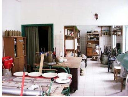
2. ábra. Fazekasműhely berendezése elektromos korongokkal

Szakmai szempontok a fazekasműhely berendezésénél. Egy igazán jól felszerelt fazekasműhelynek sok mindent kell tartalmaznia. Ezek közül van, ami lemozdíthatatlan, a másik része mozdítható. Erre jó példa, hogy régen a fazekasok nyáron kiköltöztek az udvarra korongozni, ha jó idő volt. A fazekasműhely legfontosabb berendezése a korong. Ez lehet lábbal hajtós és modern, elektromos is. A korongok többnyire mobilak, elmozdíthatóak, oda tehetőek, ahol éppen szükség van rájuk. De előfordul a mai napig olyan korong is, amely nem mozdítható, bele van ásva a műhely padlójába.