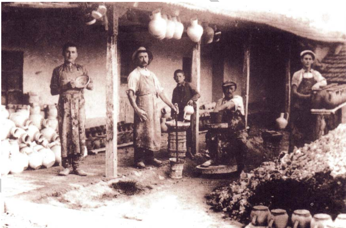
3. ábra. Fazekas műhely udvara Békéscsabáról

Szakmai szempontok a fazekasműhely berendezésénél. Egy igazán jól felszerelt fazekasműhelynek sok mindent kell tartalmaznia. Ezek közül van, ami lemozdíthatatlan, a másik része mozdítható. Erre jó példa, hogy régen a fazekasok nyáron kiköltöztek az udvarra korongozni, ha jó idő volt. A fazekasműhely legfontosabb berendezése a korong. Ez lehet lábbal hajtós és modern, elektromos is. A korongok többnyire mobilak, elmozdíthatóak, oda tehetőek, ahol éppen szükség van rájuk. De előfordul a mai napig olyan korong is, amely nem mozdítható, bele van ásva a műhely padlójába.