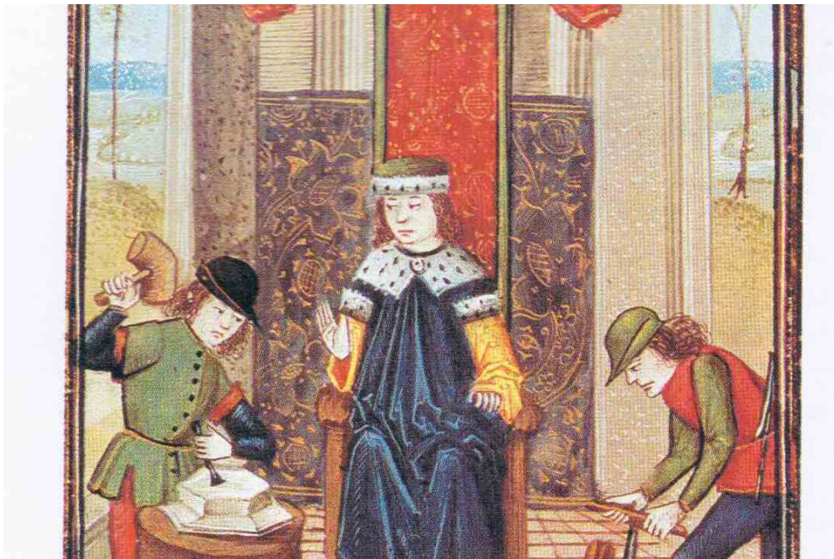
2. ábra. Mesterremeket készítő kőfaragó és ácslegény (15. század) 2