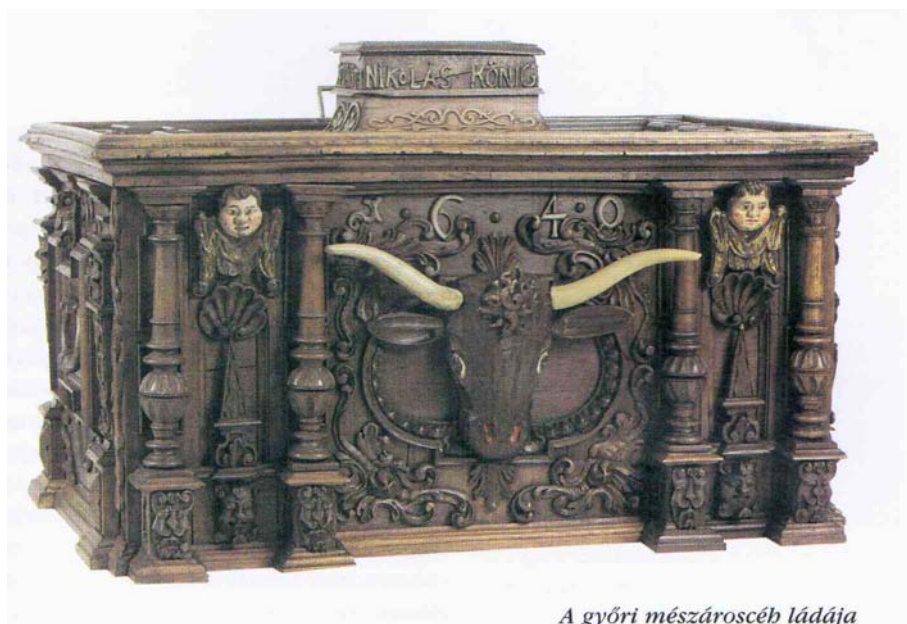
A győri mészárosceh ládája