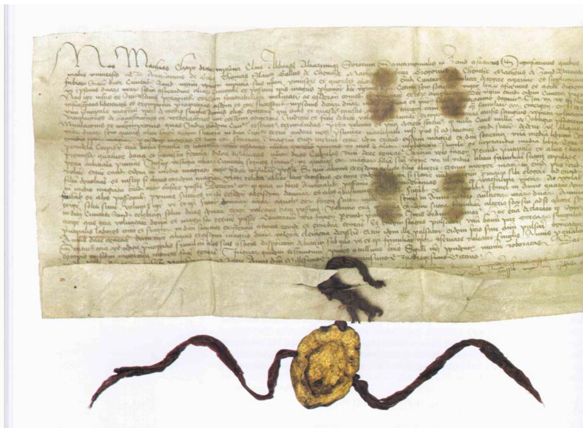
1. ábra. Szondi vargacéh szabályzata, 1448-ból!