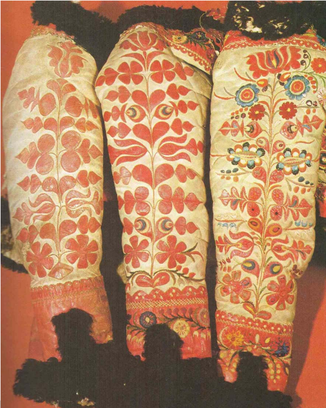
3. ábra. Dunántúli női kődmön ujjak, 1800 évek vége