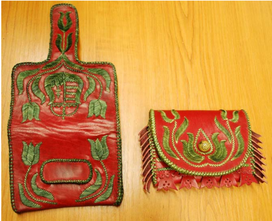
4. ábra. Hímzett bőrmunkák, 2010-ből

Termék készítője: Joó Olga, tanuló (Nádudvari ÁMK), pályázati anyag a 2010. évi ONK-ra