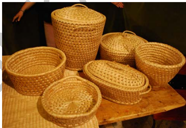
6. ábra. Kas formák 2010.-ből

Termékek készítője: Hodoroga Péter, pályázati anyag a 2010. évi ONK-ra