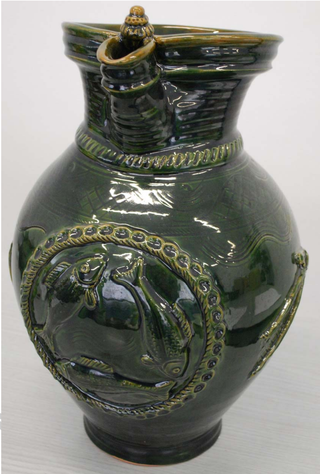
2. ábra. Kancsó 2010-ből

Termék készítője: Kató Balázs fazekas, pályázati anyag a 2010. évi ONK-ra