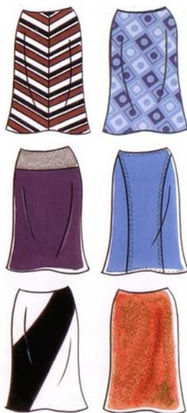
1. ábra. Azonos modell, különböző anyagvariációkkal