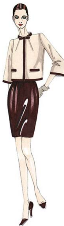
3. ábra. Kosztümszoknya 2