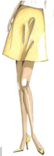
4. ábra 3

Készítse el a modellrajzon látható szoknya terméktechnológiáját! Írja le a készítéshez szükséges adatokat és a készítés technológiai sorrendjét!