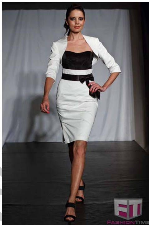
2. ábra. Egyenes vonalú szoknya divatfotója 1