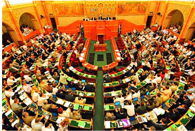
4. ábra. A törvényhozó hatalom megtestesülése, az Országgyűlés 4

Törvénnyel az Országgyűlés a különösen jelentős társadalmi viszonyokat, az egész társadalmat érintő kérdéseket szabályozza. Vannak olyan viszonyok amelyek kizárólag törvények által szabályozhatóak, ezek: