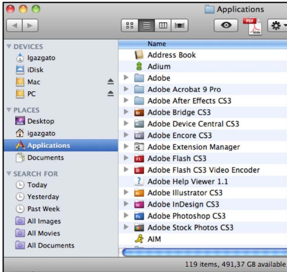
3. ábra. MAC OS X operációs rendszer felhasználói programok könyvtára