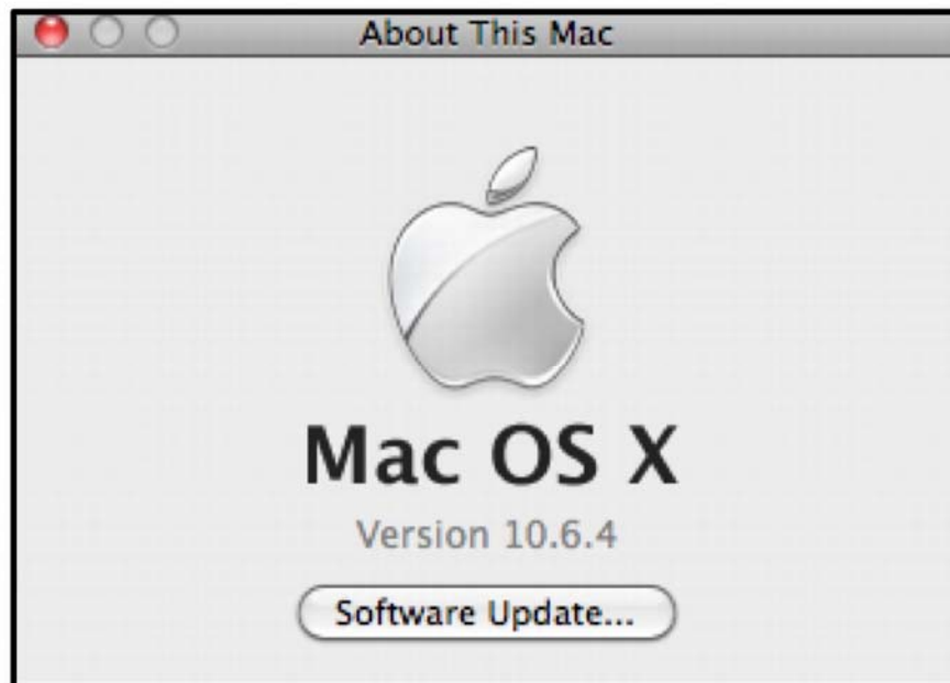
1. ábra Mac OS X. operációs rendszer információs panelje

Rendszerprogramok : a számítógép saját működését szervezik. Ezek közül a legalapvetőbb az operációs rendszer.