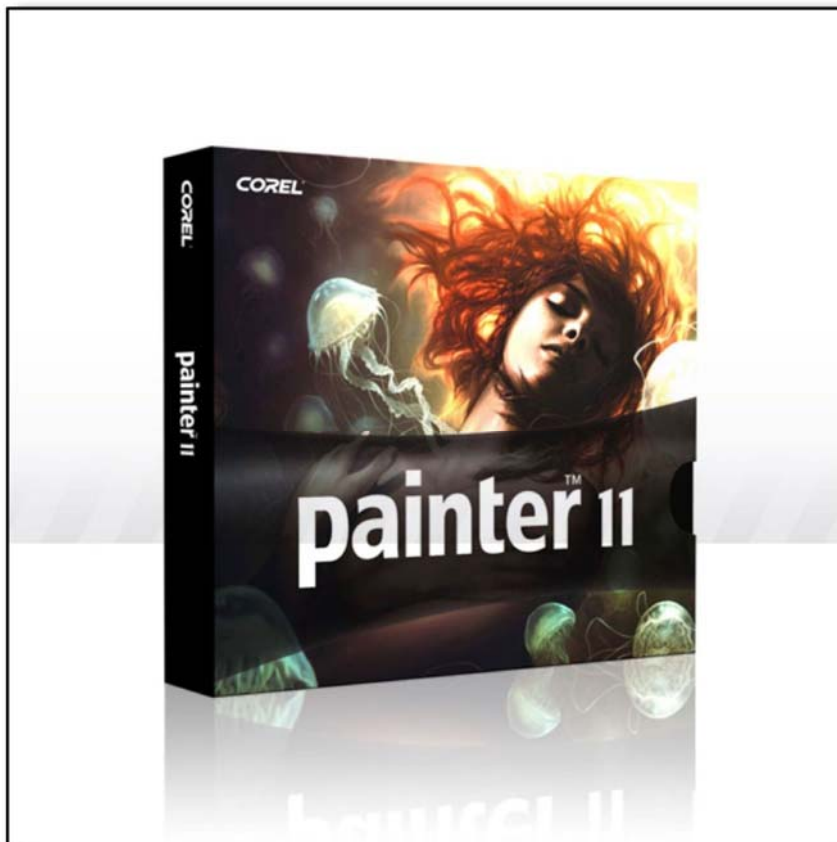
5. ábra. Corel Painter program

A Corel Painter 11 a legfejlettebb digitális festő- és illusztrációszoftver. A fejlesztők célja, hogy a Painter rajzeszközeivel minél élethűbben utánozhassuk az igazi ecsetet, ceruzát, tollat stb. Ennek érdekében elengedhetetlen a Painterhez egy nyomásérzékelny digitális tábla használata (pl. Wacom Intuos, Cintiq), melyet a szoftver maximálisan támogat, beleértve a tábla dőlésszögének érzékelését, megfelelően módosítva az éppen aktuális rajzeszköz viselkedését. Természetes és művészi ecsetek, amelyekkel ugyanúgy festhetünk, rajzolhatunk, mintha igazi ecsetet, tollat, ceruzát stb. használnánk.