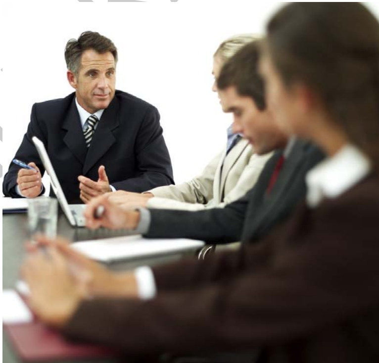
4. ábra. Tárgyalás

Célja: valamiben megegyezésre jutni. A tárgyaló személyek minden esetben ismerik a tárgyalás témáját, arra felkészülhetnek. Nézetkülönbség esetén meggyőzés eszközeivel kell élni. Kötöttebb, mint a megbeszélés. A tárgyalások írásos formában is rögzítésre kerülnek.