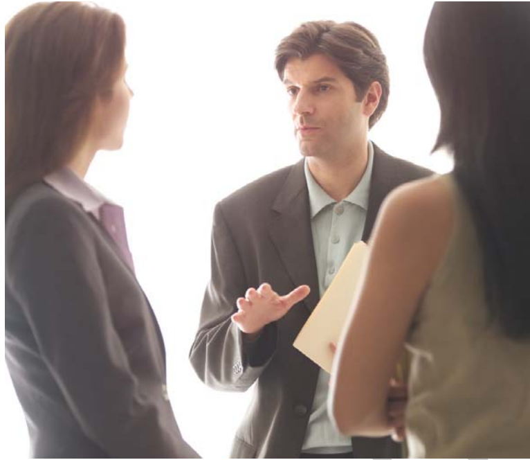
3. ábra. Megbeszélés