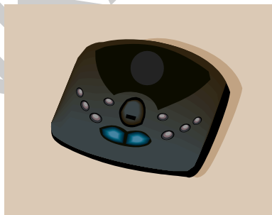
10. ábra. Üzenetrögzítő

Sok esetben nem rendelkezik egy vállalkozó alkalmazottakkal, tehát egyedül végzi az ügyfelekkel való tárgyalást, az ügyek intézését és a munkavégzést. A kapcsolattartás, az információk eljuttatása igényli az üzenetrögzítő, vagy a hangpostafiók alkalmazását, ha nincs senki, hogy felírja, átvegye az érkező időpontokat, munkahelyszíneket és egyéb fontos információt. Sok esetben az üzenetrögzítő hatékonyabb és elkerülhető vele, hogy az átadott információ formailag és tartalmilag is torzuljon.