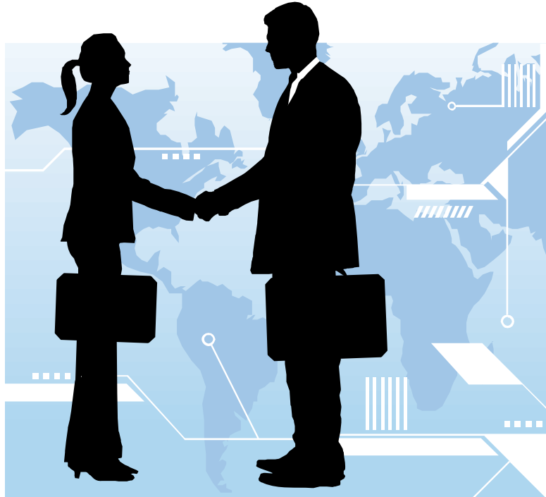
8. ábra. Bemutkozás

Bemutkozásnál először a nő nyújt kezét a férfinak, azonos neműek esetében az idősebb a fiatalabbnak és hivatalos bemutatkozásnál a magasabb rangú az alacsonyabb rangúnak, tehát a főnök a beosztottnak.