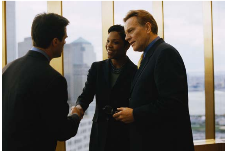
7. ábra. Bemutató

A bemutató a bemutatást követően bármikor magára hagyhatja a két bemutatottat, nem udvariatlanság.