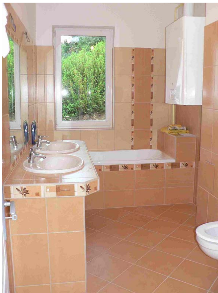
1. ábra. A burkolatok "felöltöztetik" a fürdőszobát 1

A burkolásban is, ugyanúgy, mint a festésben, nagy szerepet kapnak a minták, díszítések. Ahogyan a ruházatban, vagy a frizura viseletekben, úgy az építészetben is gyakran változnak a divatok . Néha a mintásabb, néha az egyszerűbb felületek a divatosabbak, egyszer a pasztellszínek hódítanak, máskor erőteljes, telt színekre festik a házakat, vagy éppen ellenkezőleg, a klasszikus fehér – barna – drapp színösszeállítást tartják vonzónak. Ahogyan az öltözködésben is állandó változással, örökös megújulással találkozunk, ugyanúgy az építészetben is gyakran követik egymást az új trendek.