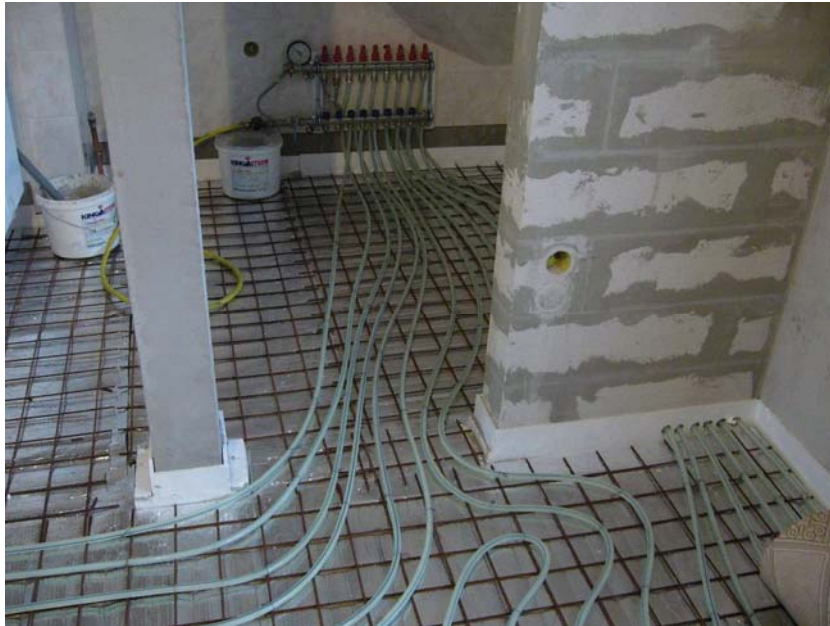
4. ábra. Padlófűtés fölé flexibilis ragasztóval rakjuk le a burkolatot 4