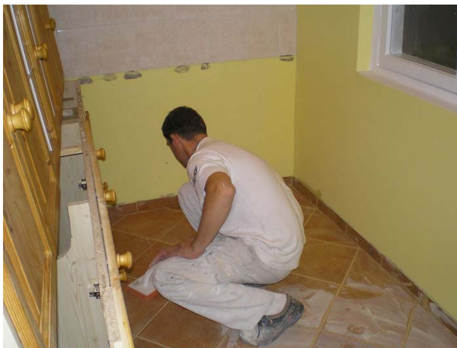
6. ábra. A hidegpadló burkolat fugázását készítik 6

A burkoló munka a viszonylag kisebb gépigényű építési munkák közé tartozik. Általában kézi szerszámokkal és néhány kisgéppel meg lehet oldani a burkolási feladatokat.