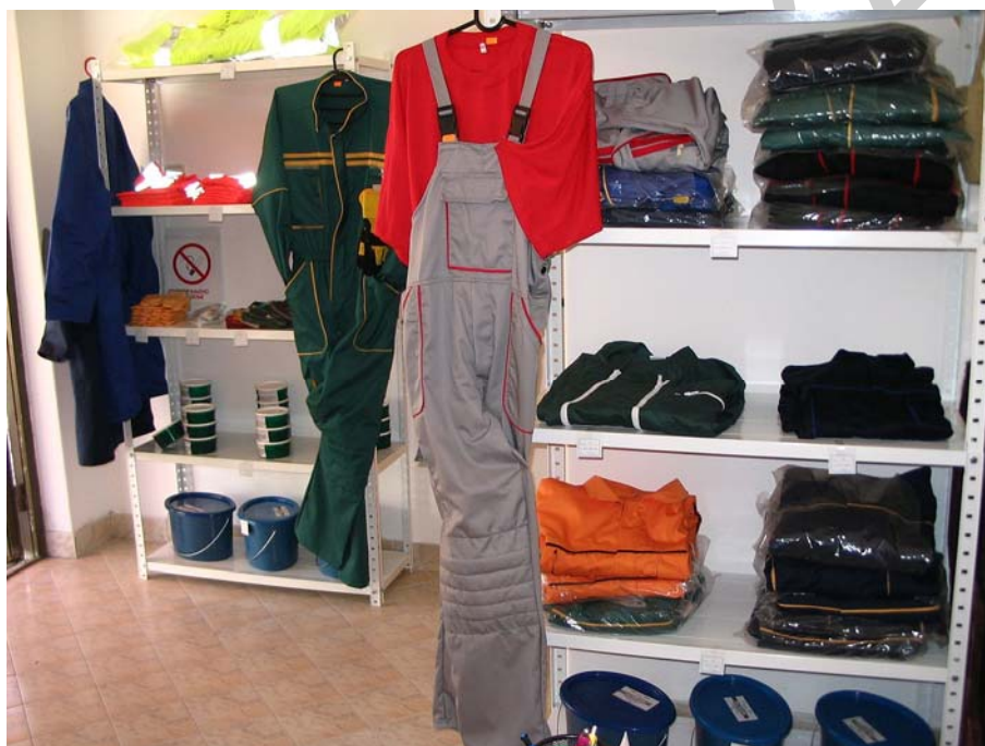
7. ábra. Védőruhák kényelmesek és még csinosak is 7

Burkolási munkát végző szakembereknek viselniük kell az előírt védőfelszereléseket : védősisakot, zárt munkaruhat, védőkesztyűt, munkavédelmi bakancsot, térdvédőt, esetenként védőszemüveget, fülvédőt, maszkot, stb. és használniuk kell a szükséges védőeszközöket : állványt, korlátot, kikötést hevederrel, védőállványt, védőtetőt, stb.