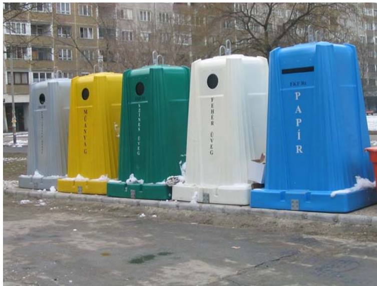
8. ábra. A hulladékokat az építkezésről is szelektíven kell gyűjteni 8

A burkolatok bontásakor fokozottan ügyelni kell a balesetvédelmi előírások betartására , és a hulladékok szelektív gyűjtésére , biztonságos elszállítására és megfelelő kezelésére .