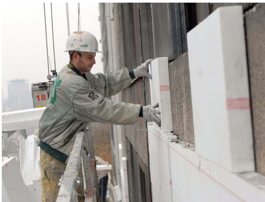
3. ábra. Társasház homlokzati hőszigetelését készítik 3

Kültéri burkolatokat , térburkolatokat, erkélyek, teraszok, homlokzatok burkolatait fagyálló módon kell elkészíteni. A burkolat anyagául fagyálló kerámia lap, gres lap, cementlap, mettlachi, kő, klinker tégl, műkő, beton választható. A burkolat ragasztásához – a nagy hőingadozásból eredő mozgás és alakváltozás miatt – flexibilis ragasztót kell használni.