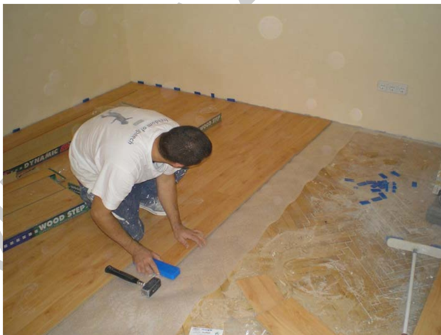
2. ábra. Meleg padlóburkolat, laminált parketta készül a régi parketta tetejére 2

Ezt a fajta klasszikus felosztást a burkolások anyagainak hőérzete alapján hozták létre. Hosszú ideig – még nemrégiben is – ez a két szakma teljesen elkülönült egymástól, egyik a másik szakmáját nem is tudta gyakorolni. Csak mostanában lett ismét közös szakma a hideg- és melegburkoló, ahogyan a ma idős mesterek még egykor együtt tanulták az iskolában e két szakmát.