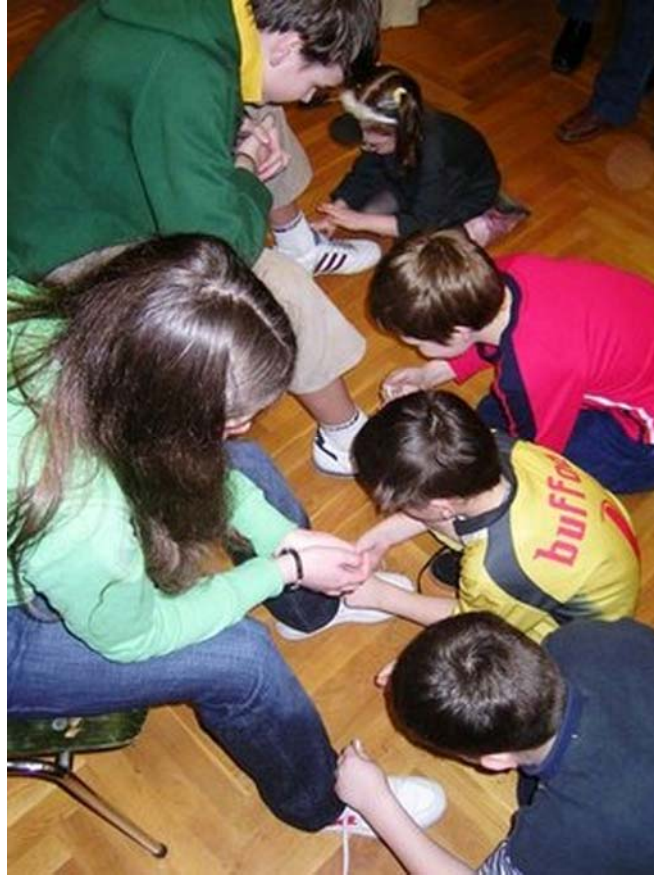
6. ábra. A motívumok megtalálása mindig feltétele a gyakorlatok, a gyakorlás sikerességének: a gyakorlatvezető részvétele a "játékban" szükséges, de nem elégséges feltétel! 9