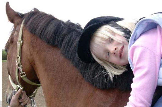
1. ábra. Lovasterápia 3

Általános célként megfogalmazhatjuk, hogy a fogyatékos, sérült, akadályozott emberek számára is nyitottá kell tenni az emberi élet hozzáférhető területeit, hogy minden lehetőséget felhasználva aktív résztvevői lehessenek a társadalom életének. Emellett számukra egy speciális integrálódási alkalmat is teremt a lovasterápia, hiszen ez kapcsolódik a lovaglás eddig meglévő és működő rendszeréhez is. A lovaglási helyzetek összetettsége rendkívüli és hatékony lehetőségeket teremt a különböző fogyatékoságokkal rendelkező emberek fejlesztése számára.