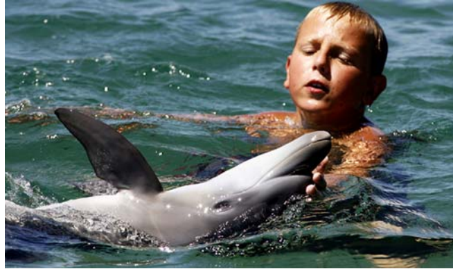
2. ábra. A delfin-terápia jótékony hatásait már régen vizsgálják a tengerparti országokban 4