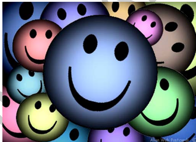
3. ábra. A gyakorló foglalkozások akkor sikeresek, ha a gyerekektől nagy erőfeszítést igényel a végrehajtásuk, de ha a foglalkozásokat örömmel zárjuk, a teljesítményhez pozitív érzelmek kapcsolódnak 5

Leggyakoribb eset a konkrét élethelyzetbe illesztett gyakorlás, amikor valamely hétköznapi tevékenység során alkalmazzák a fejlesztő foglalkozások és terápiák során tanultakat. Nagyon fontos, hogy a kialakított készségek, funkciók alkalmazását a valós élethelyzetekben is mindig megköveteljük, így hatékonyabbá tegyük a fejlesztésbe kölcsönösen befektetett időt és energiát.