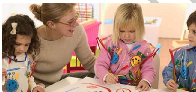
1. ábra. Segítő, motiváló, megerősítő tevékenység

Alapvetően segítő jellegű tevékenységeket végez.