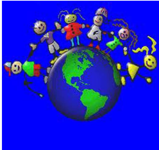
2. ábra. Mindannyian mások vagyunk... 3

A feladatokat minden esetben a gyógypedagógus vagy a fejlesztő team irányítása mellett kell végeznie, illetve a megbeszélte gyakorló feladatokat ÖN is végezheti. Tapasztalt asszisztensként már képes lesz önállóan is gyakorló feladatokat tervezni az adott csoport vagy segített személy számára. Új gyakorlatok bevezetését mindig beszélje meg a fejlesztési területet jól ismerő szakemberrel!