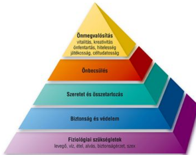
1. ábra Maslow szükségletpiramisa 2

Amíg az alapvetőbb szükségletek nincsenek legalább részben kielégítve, addig nem lehet kielégíteni a magasabb rendűeket. A végiggondolásnál figyelniük kell arra, hogy a szükségletek a gyereknél, a felnőttél, az idősnél más módon, más arányban jelentkeznek.