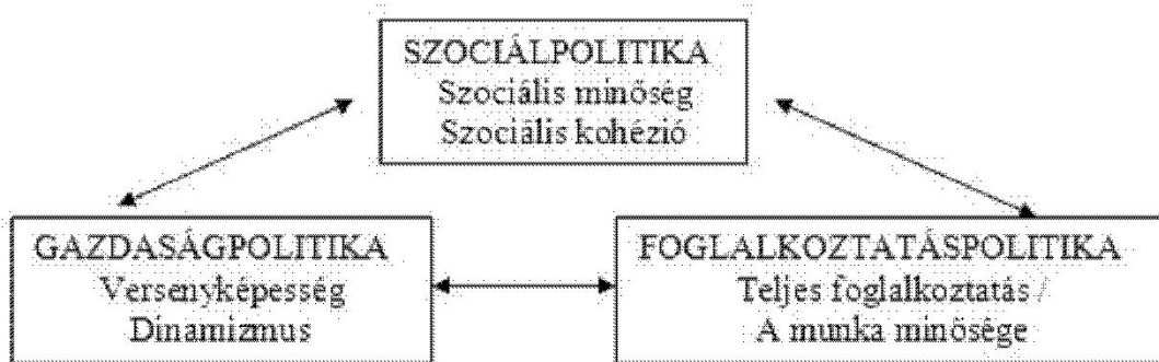
1. ábra Foglalkoztatáspolitiká- gazdaságpolitika- versenyképesség 5

"A megfelelő szociális védelem segíti a gazdaság feltételeihez való igazodást és a jól képzett munkaerő rendelkezésre állását. A színvonalas és mindenki számára hozzáférhető általános és szakmai képzés megerősíti a társadalmi integrációt és a versenyképességet. A biztos munkahely biztosítékul szolgál a szociális kirekesztés ellen. A foglalkoztatási ráta emelése megvalósítja a társadalmi célokat, a gazdaság számára biztosítja a szükséges munkaerőt, egyúttal megteremti a társadalombiztosítási rendszerek finanszírozásának alapjait.