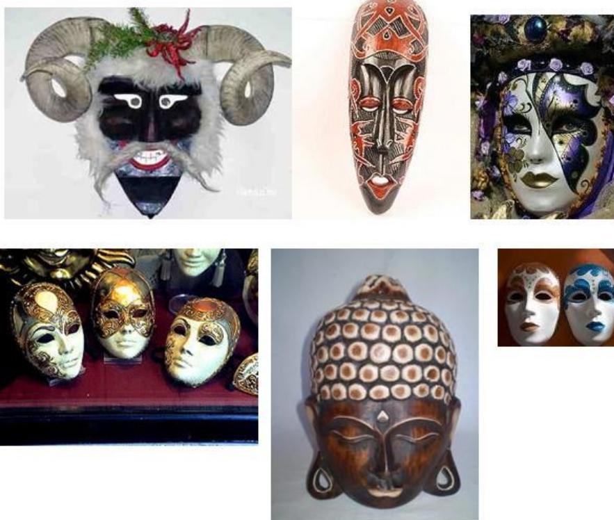
1. ábra. Különböző maszkok és álarcok, 12

Az alábbi álarcok közül válassza ki azt az álarcot, amelyik most a legközelebb áll Önhöz. Mondja el tanuló társának, hogy miért választotta azt az álarcot, amelyiket választotta.