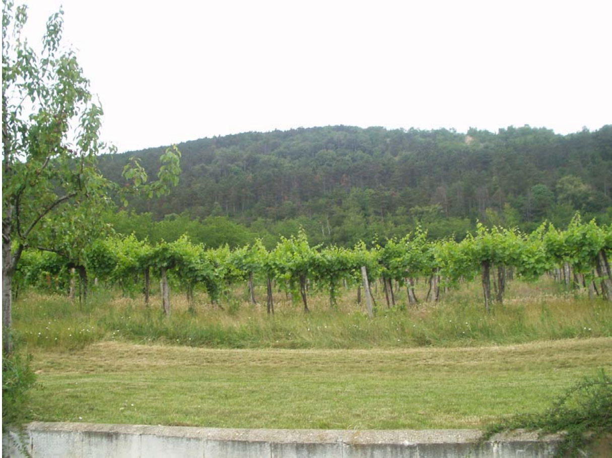
8. ábra Etyek–Budai borvidék 8