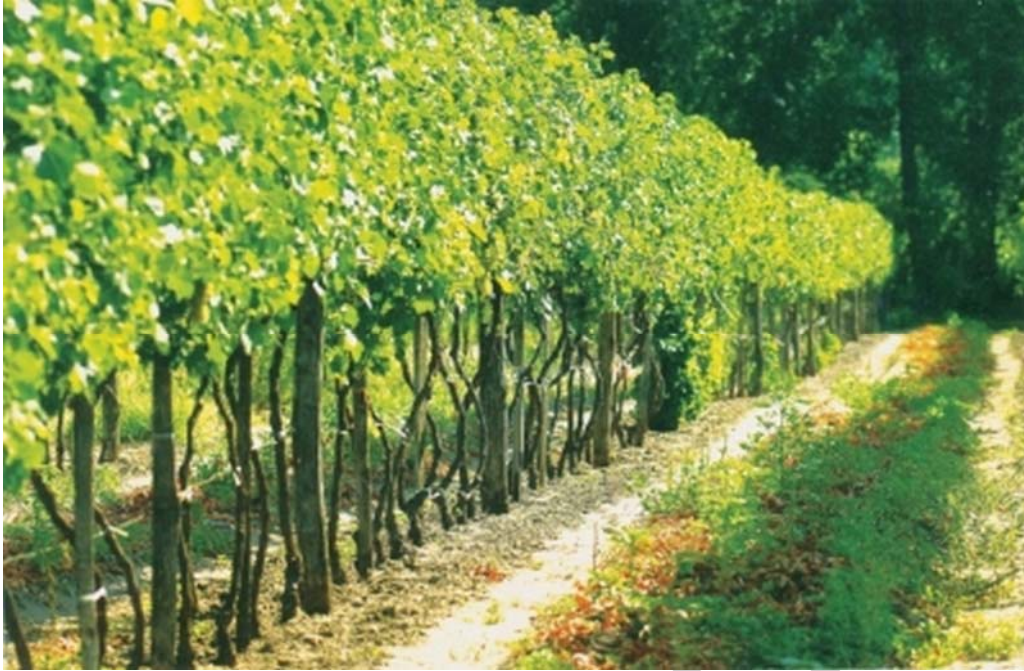
3. ábra Kunsági borvidék 3