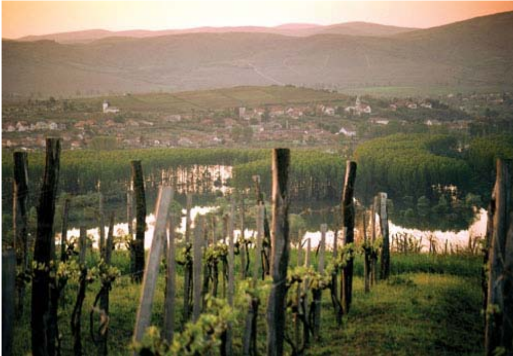
20. ábra Tokaji borvidék 20

A tokaji jelleg kialakulásához megfelelő fajták is kellettek, amelyek késői érésűek, és azt a klímát ki tudták használni. Tokaj–Hegyaljai borvidék fő fajtái a következők: Furmint, a termőterület 55 %-át, Hárslevelű, a termőterület 40 %-át, és a Sárga muskotály, a termőterület 5%-át képviseli. A legjobban aszúsodik a Furmint, kedvező körülmények között jól aszúsodik a Sárga muskotály.