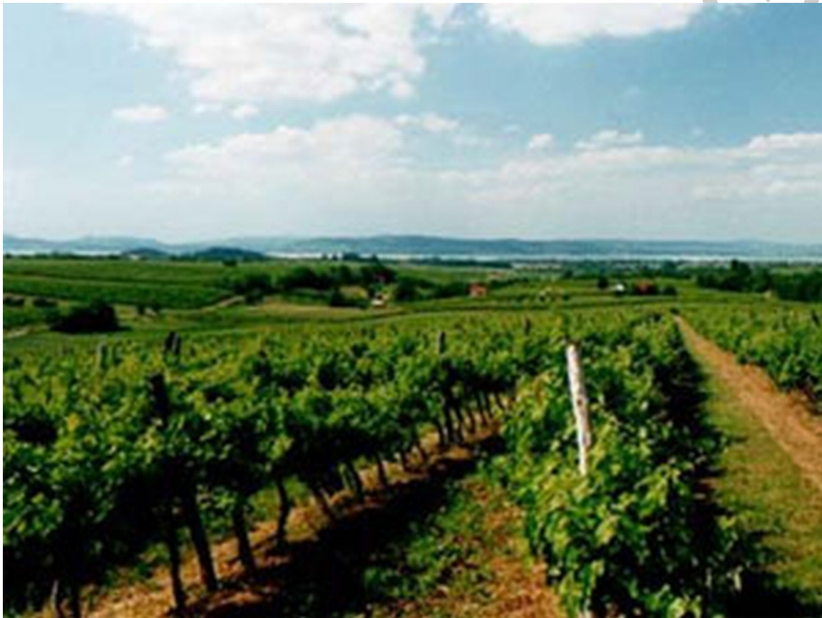
6. ábra Balatonfüred – Csopaki borvidék 6

Területe 2270 ha. Klímája a szőlőtermesztésnek kedvező. Napfényben rendkívül gazdag, kedvező a tóra tekintő domboldalak fény és páragazdagsága is. Talaja változatos, kristályos pala, melyet homokkő, mészkő illetve homok takar. A vidék jellegzetessége a talaj markáns vörös színe, melyet a földben lévő vasoxid okoz. A talaj kiválóan alkalmas szőlőtermesztésre. A borvidék legelterjedtebb szőlőfajtája az Olaszrizling, melynek termesztéséhez az adott talaj és klíma ideális feltételeket biztosít. Széles körben elterjedt a Rizlingszilváni, a Chardonnay és a Furmint.