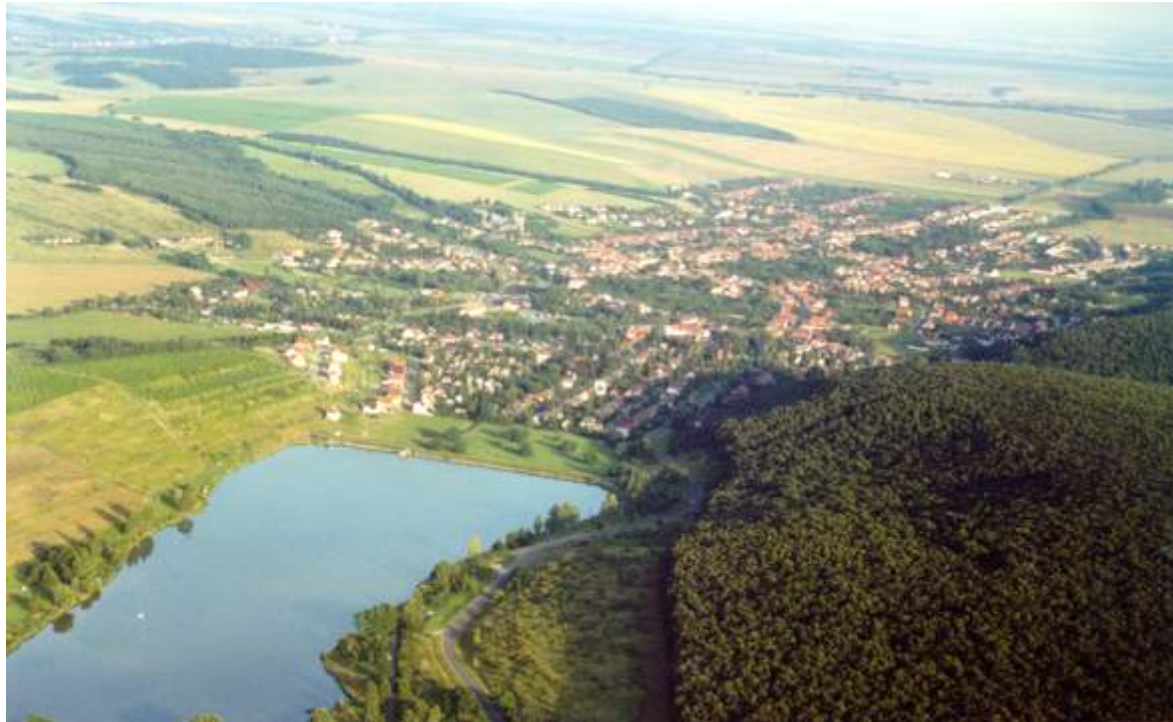
17. ábra Bükk aljai borvidék 17