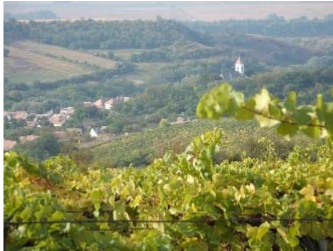
4. ábra Ászár-Neszmélyi borvidék 4