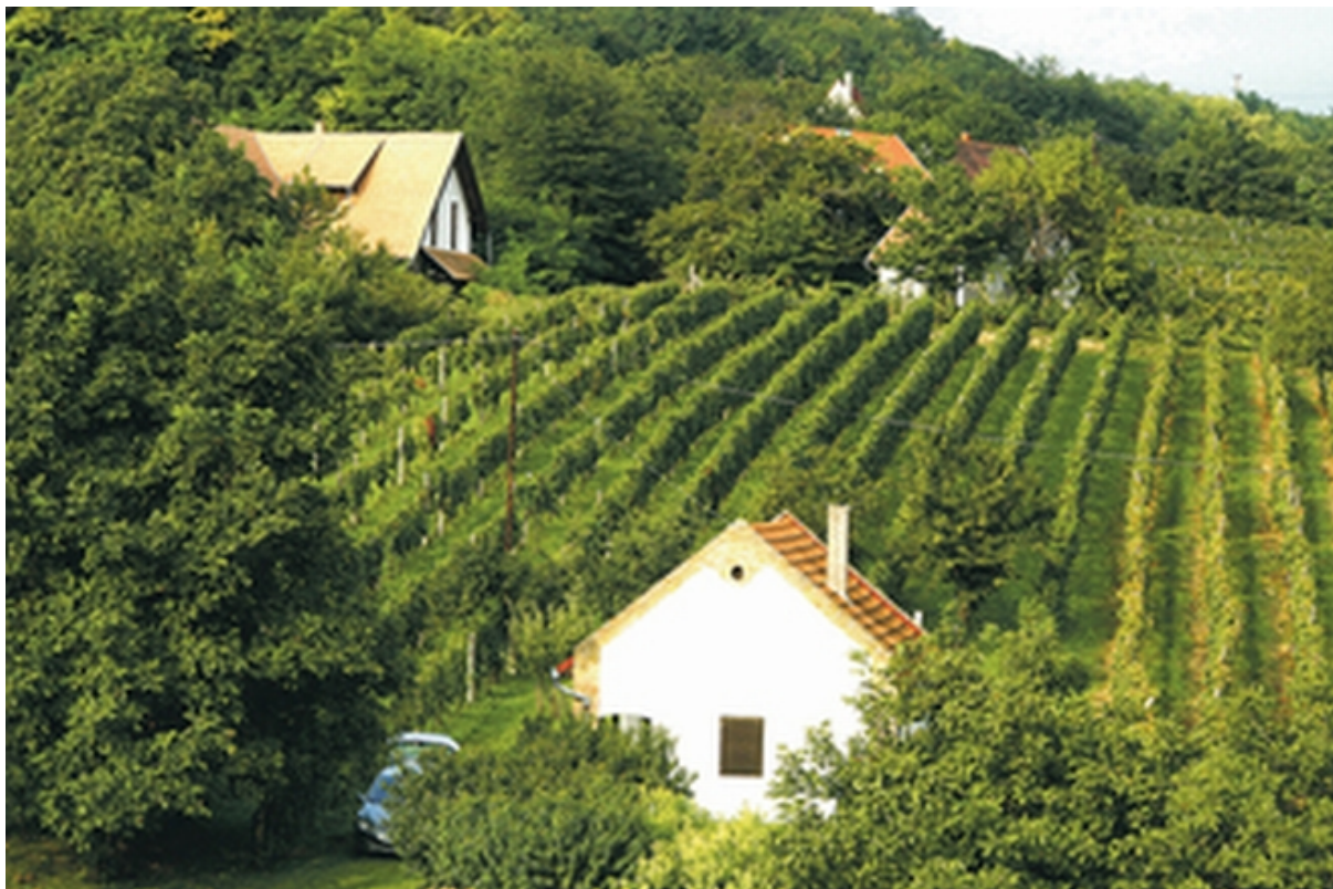
22. ábra Tolnai borvidék 22