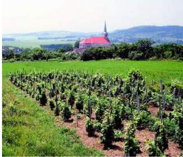
13. ábra Balatonboglári régió 13