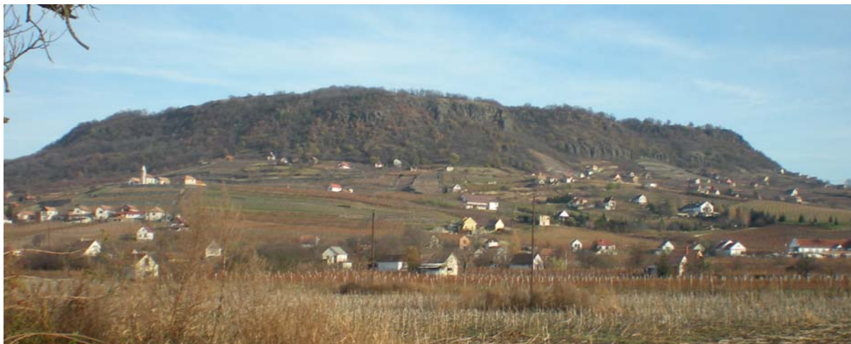
11. ábra Somlói borvidék 11