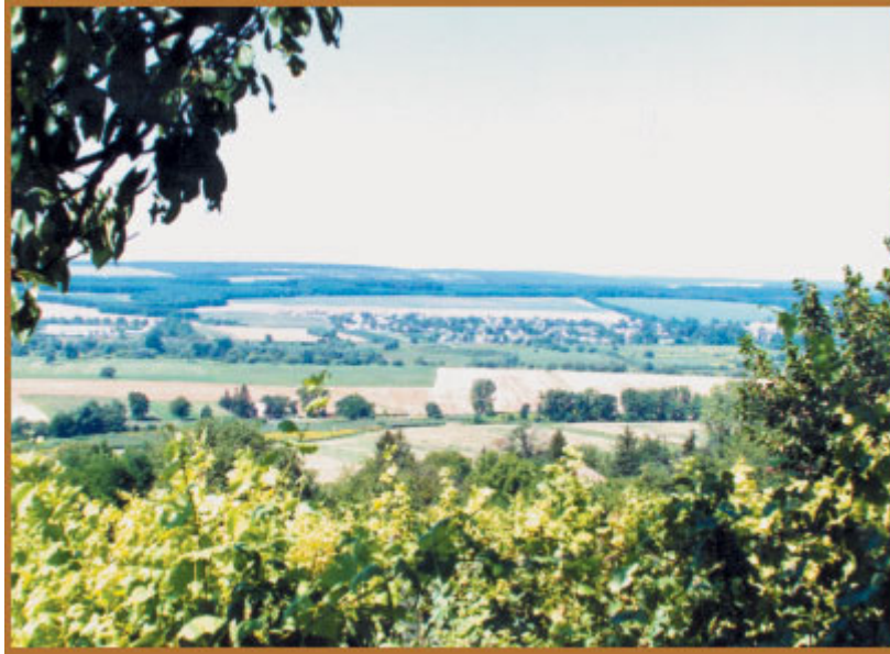
21. ábra Balaton melléke borvidék