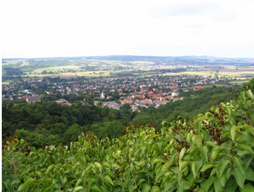
10. ábra Pannonhalmi borvidék 10