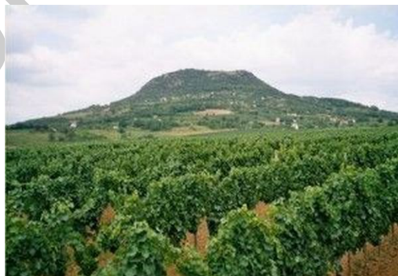
5. ábra Badacsonyi borvidék 5

A Badacsonyi borvidék a legrangosabb, legkedveltebb a történelmi borvidékek között. Ez a borok minőségének köszönhető, melyhez a táj különleges szépsége is hozzájárult. Területe 1810 ha. Klímája kiegyenlített, néha kevés a csapadék. A fekvése miatt az északi szélől védett napsütésben gazdag borvidék. Talaja változatos, vulkanikus eredetű, melyet pannon agyag, homok és lösz borít. A hajdani vulkáni működés fantasztikus körvonalú bazalttömböket hagyott maga után, amelyek meghatározzák a hely hangulatát. A Badacsony hegyén kívül a délnyugati oldalon elhelyezkedő csodálatosan csipkézett Szent György-hegy, és az Ábrahám-hegy is a borvidékhez tartozik. A Balaton óriási víztükre a párolgásával kiegyenlítettebbé teszi az időjárást, és fokozza a páratartalmat, ami a borok minőségére jótékonyan hat. A borvidék fő fajtái az Olaszrizling, a Szürkebarát, és a Kéknyelű, de megtaláljuk a Piros traminit, a Rajnai rizlinget, a Sauvignont is.