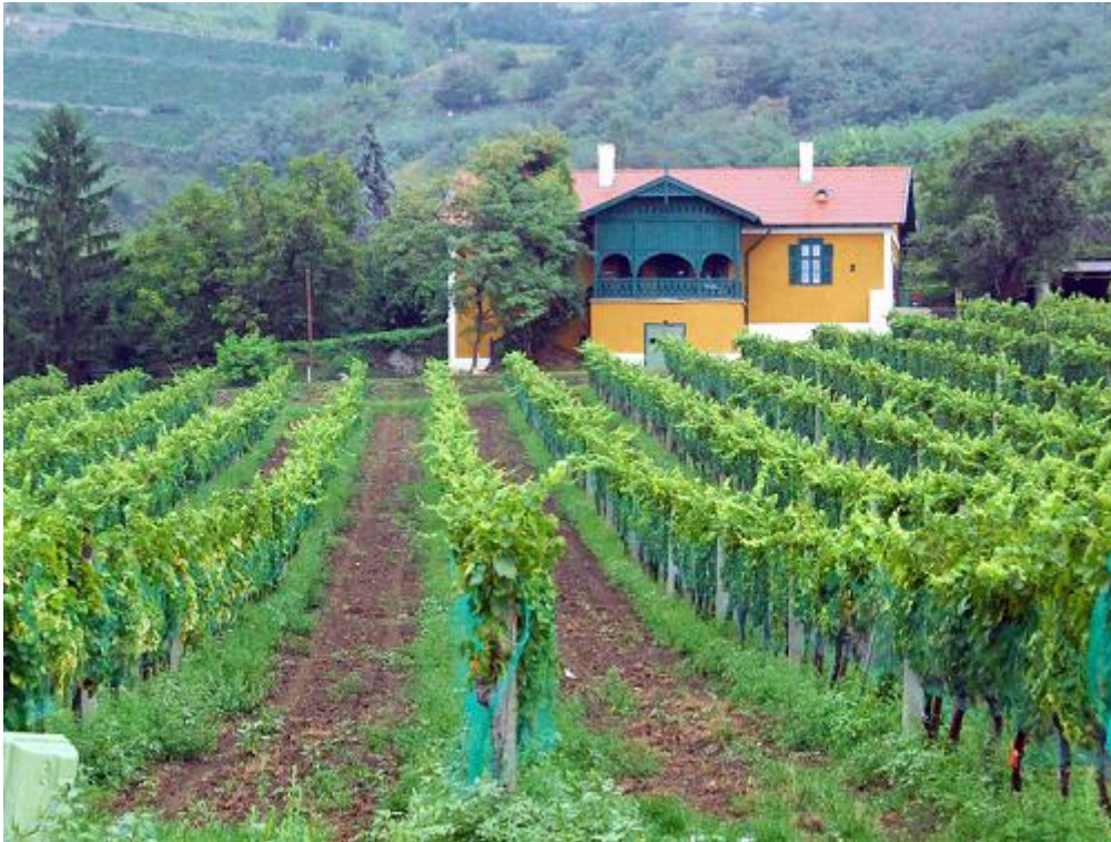
7. ábra Balaton felvidéki borvidék 7

Területe 1510 ha. Klímája a mediterrán jellegű, sok napsütéssel. Talaja változatos, meszes kőzetek, bazaltos láva és tufakőzetek, vályogos talajok. Azok a Balaton–környéki szőlőskertek, amelyek ugyan nem közvetlenül a Balaton parton terülnek el, de klímájukat a Balaton közelsége döntően befolyásolja, tartoznak ehhez a borvidékhez. Változatos táj és talajadottságok jellemzik. Legismertebb szőlőfajtái az Olaszrizling, Szürkebarát, Chardonnay.