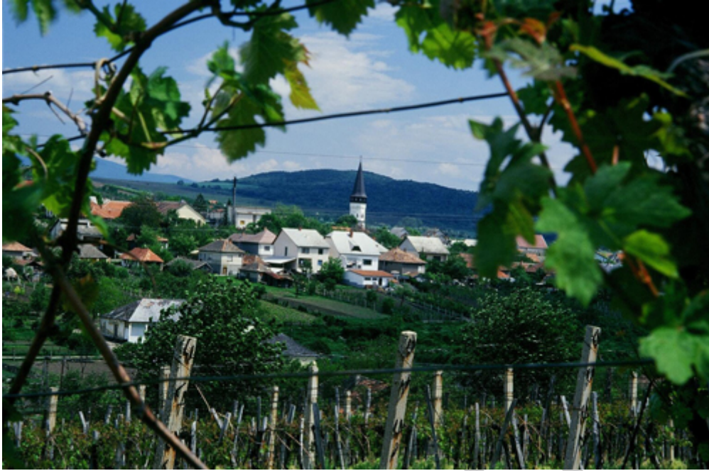
9. ábra Móri borvidék 9