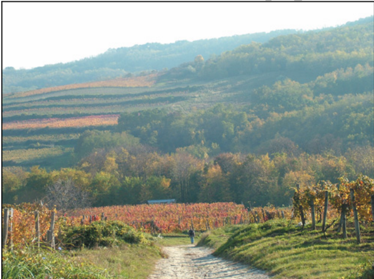
15. ábra Szekszárdi borvidék 15

Területe 2300 ha, Klímája hosszú, csapadékos, enyhe tél, szélsőséges, tikkasztó, száraz meleg nyár. Talaja vastag, szélfúttá, meszes lösz, mely akár a 30 m vastagságot is eléri, itt-ott vörös agyag. A Dunával párhuzamosan elterülő dombvonulat magassága 120–130 méter. Már a római korban bizonyítottan a szekszárdi szőlőhegyen szőlőt műveltek és bort állítottak elő. Tipikus vörösbort termelő borvidék. Fő fajtája a Kadarka, melyet újra felfedeztek és telepítenek. Jelentős fajtái a Kékfrankos, a Merlot, a Cabernet franc és a Cabernet sauvignon. Eger mellett Szekszárd is használhatja a bikavér elnevezést, melyet 2–3 ősi eredetű vörösborból készítenek.