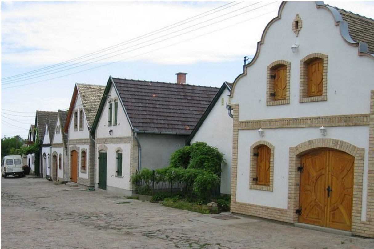
2. ábra Hajós– Bajai borvidék 2

Területe 2070 ha. Klímája szélsőséges, száraz, igen meleg a nyár és kifejezetten magas a napsütéses órák száma. Talaja a lösz. A klímáját a Duna közelsége teszi különlegessé, amely félkörbe öleli a borvidéket. A magyarországi német építészet hozta létre a hajósi pincefalut, jellegzetes présház és pincesorral. A borvidékre jellemző szőlő és borfajták a lágy bort adó Rajnai rizling, Chardonnay, a tüzes és bársonyos Kadarka, Kékfrankos, Cserszegi fűszeres, Cabernet franc és a Zweigelt.