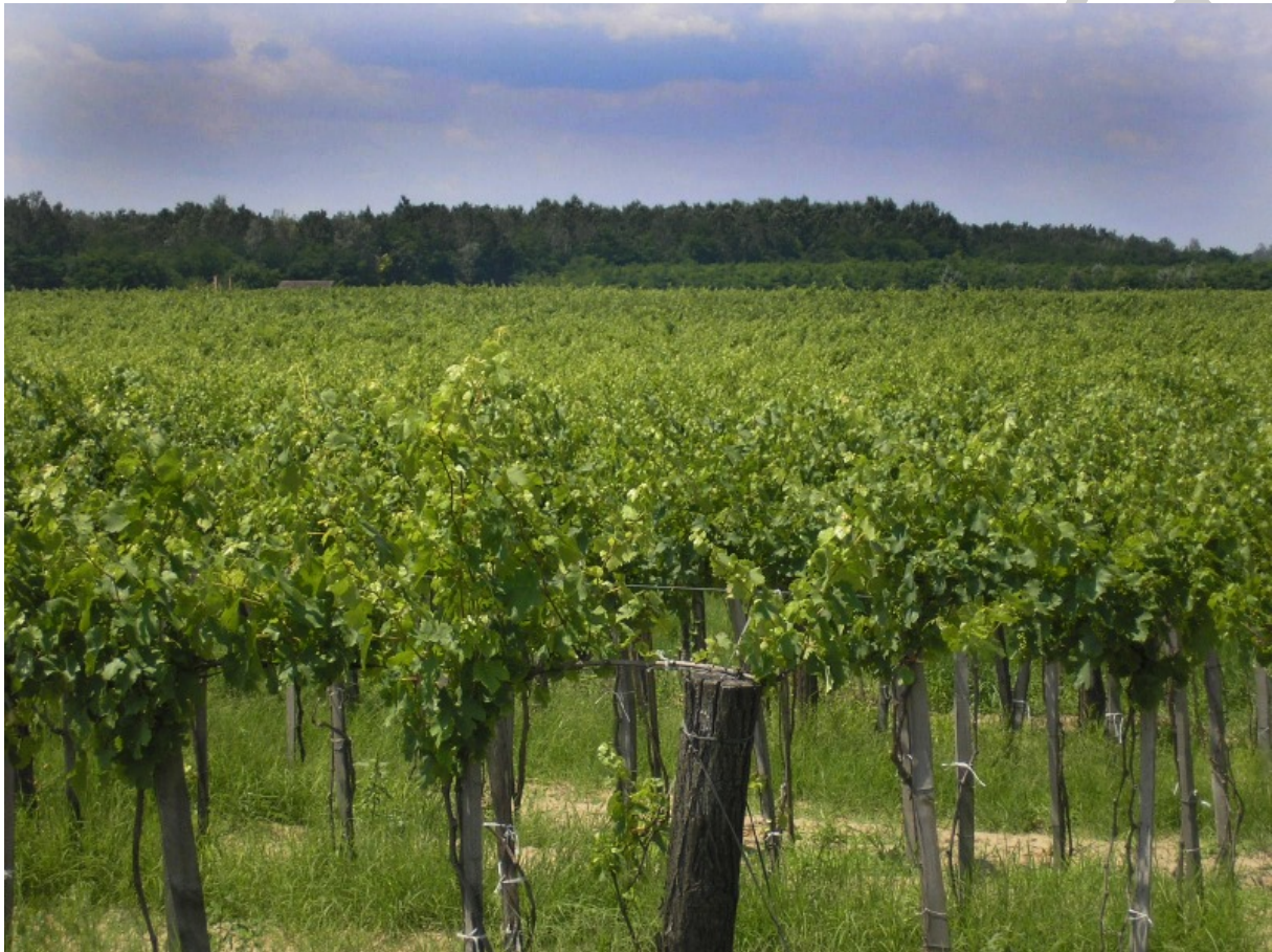
1. ábra Csongrádi borvidék 1

A borok jellege, karaktere mindhárom borvidéken más és más. Klímája száraz, szélsőséges időjárás jellemzi. Magas a napsütéses órák száma. Talaja homok, homokos lösz. Az alföldi borvidékekhez hasonlóan itt is az asztali borok előállítása a jellemző. A termelt szőlőfajták a Kékfrankos, Rajnai rizling, Kövidinka és a Zweigelt.