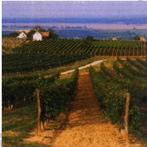
16. ábra Villányi borvidék 16

Területe 1890 ha. Klímája szubmediterrán jellegű. Az enyhe és csapadékos telet, a napsütéses meleg nyár követi. Talaja: a Villányi-hegység alapközete még a kréta korszakban kialakult mészkő, melyet vastag szőlőtermesztésre alkalmas lösz és meszes agyag borít. A borvidék a Villányi-hegység védelmében fekszik. A borvidék legjelentősebb termőhelyei a Nagyharsányi-hegy, a Beremendi-hegy és a siklói dombok. A filoxéra vész idején a szőlő ültevények nagy része kipusztult. Teleki Zsigmond megkezdte Villányban a filoxérának ellenálló alanyfajták nemesítését, és szaporítását. Ez a módszer nemcsak hazánkban, hanem az egész világon elterjedt. A szőlő rekonstrukciója óta a borvidék egy-egy megtorpanás kivételével, töretlenül fejlődik. Villány inkább vörösbor termelő, míg Siklós fehérbor termelő vidék. Villány főfajtái a Portugieser, a Cabernet sauvignon, a Kékfrankos és a Merlot. Siklóson termesztett fehérbor adó fajták az Olaszrizling, a Piros Tramini és a Hárslevelű.