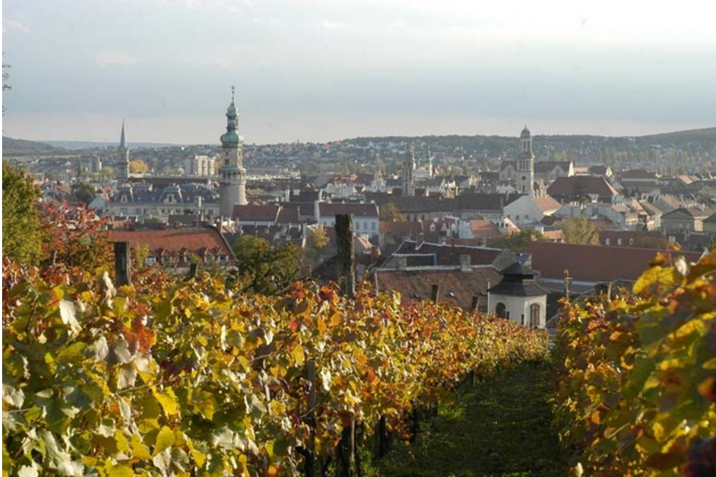
12. ábra Soproni borvidék 12