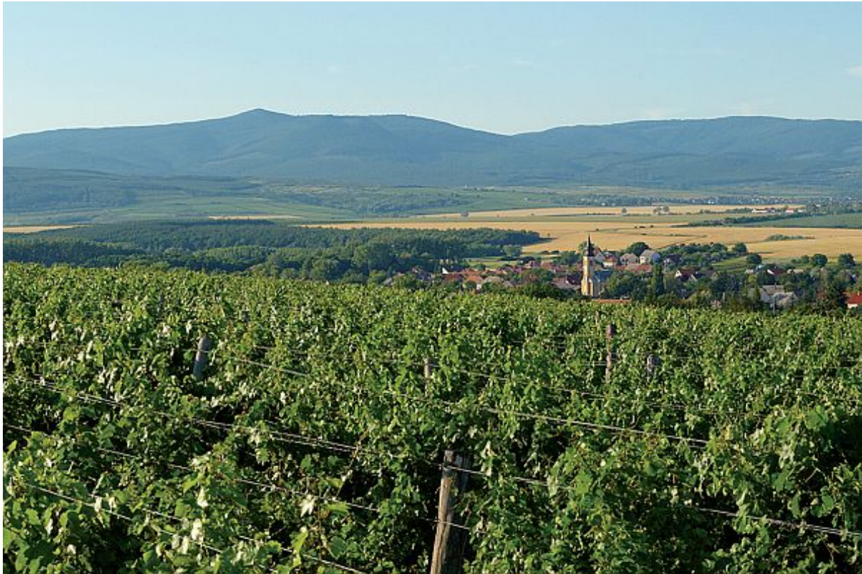
19. ábra Mátrai borvidék 19