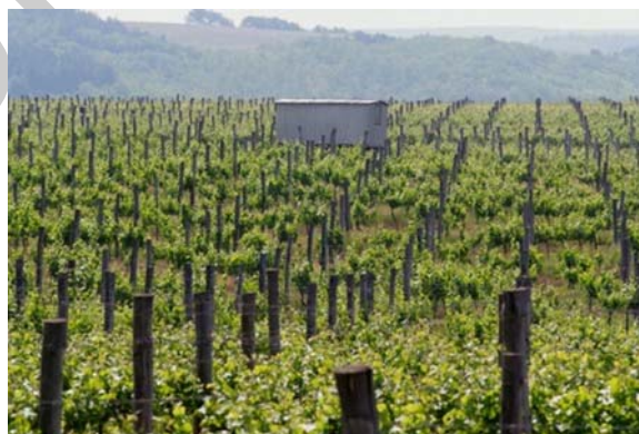
14. ábra Pécsi borvidék 14

Területe 940 ha. Klímája szubmediterrán. Az északi széltől védett, napsütésben gazdag, enyhe telű és nyarú vidéken, a táj ideális klímája folytán a szőlő termesztése a legkiválóbb körülmények között folyik. Talaja palás, kötött erdőtalaj, homokkő és lösz, kedvező a szőlőtermesztésre. István az egyháznak adományozta ezeket a szőlőket. Mecsekalját „Az Isten is bortermő vidéknek teremtette.” A középkorban hatalmas pincéket építettek, ez hozzásegítette a szőlőművelőket, az egyházat is, nemcsak a borok előállításához, hanem a borkereskedelemhez is. A pezsgőgyártás alapborait a mohácsi dombvonulat hűvösebb völgyeiben termesztik meg. Hagyományosan, a mecsekaljai borok, a sok napsütés miatt magas cukortartalmuk, testes, tüzes, lágy borok. Fehérbort adó fajtákat termesztenek. Jellegzetes fő fajtája a Cirfandli, az Olaszrizling, a Chardonnay,