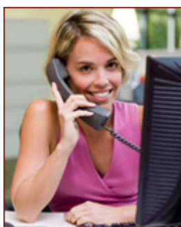
2. ábra 3