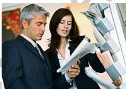
4. ábra 5

A napilapokban feladott hirdetések viszonylag szélesebb körhöz jutnak el, míg az időszakosan megjelenő lapoknak szűkebb az olvasóközönsége. Ma már számtalan különféle helyi hirdetési újság is előfizetés, megvásárlás nélkül jut el az olvasókhoz, melyek igen hatékonyak lehetnek a vállalkozás tevékenységének reklámozására.