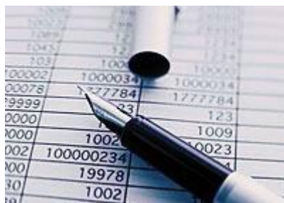
8. ábra 10

Az általános forgalmi adó választását alaposan meg kell gondolni, mivel ez nagyban meghatározza az egyéni vállalkozás adminisztrációját, könyvelését, működését, és módosítani is csak az adóév végén lehet.