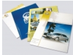
5. ábra 6

A prospektusok a vállalkozás tevékenységét bemutató képekkel, leírásokkal készülő igényesebb kialakítású reklámanyagok. Hátránya, hogy igen költséges, és kis körben, főleg csak azokhoz jutnak el, akik amúgy is nagy eséllyel fogják igénybe venni a vállalkozás szolgáltatását, termékeit.