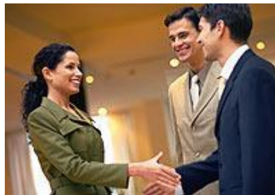
3. ábra 4

Egy vállalkozás életképességében meghatározó szerepe van a megfelelő telephelynek, amelynek kiválasztásában a piackutatás igen fontos tényező. Ennek ellenére az új egyéni vállalkozást indítókra jellemző, hogy eltekintenek a piackutatástól. Ennek minden bizonnyal az lehet az oka, hogy a vállalkozni kívánók nem ismerik a megfelelő adatforrásokat.