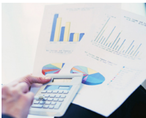
7. ábra 8