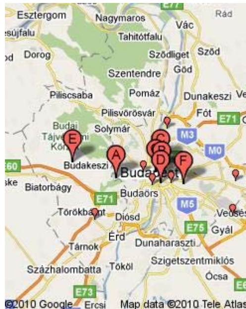
6. ábra 7