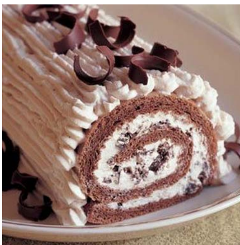
3. ábra Tejszínes gesztenyés rolád

A csokoládés felvert tészta lapot rumos leiter cukorral megkenjük, elterítjük rajta a rummal ízesített gesztenyés tejszínhabkrém, megszórjuk reszelt csokoládéval és felcsavarjuk. Külsőjét a maradék krémmel bevonjuk és reszelt csokoládéval vagy gesztenyével megszórjuk.