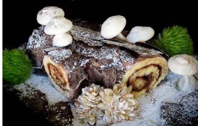
6. ábra Bûche de Noël

Napjainkban ezt a karácsonyi fatörzset a sütemény jelképezi, amely az egykori, a szenteste alatt elégetett farönkre emlékeztet. Ez a magyarázata tehát a barna, faszínű csokoládé- vagy kávékrém bevonatnak. Ennek a vajkrémmel töltött süteménytekercsnek a felszeletelése a favágást idézi fel.