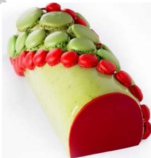
1. ábra Bûche de Noël (Karácsonyi fatörzs)

Ilyen és ehhez hasonló helyzetekre való különlegességekkel szeretnénk most megismertetni. Sok olyan dologgal fog találkozni, amit már biztosan régóta ismer, talán kedvel is. De lesz jó néhány sütemény, amivel hazánkban elég ritkán lehet találkozni.