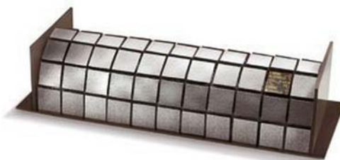
10. ábra Csokoládés fatörzs II.