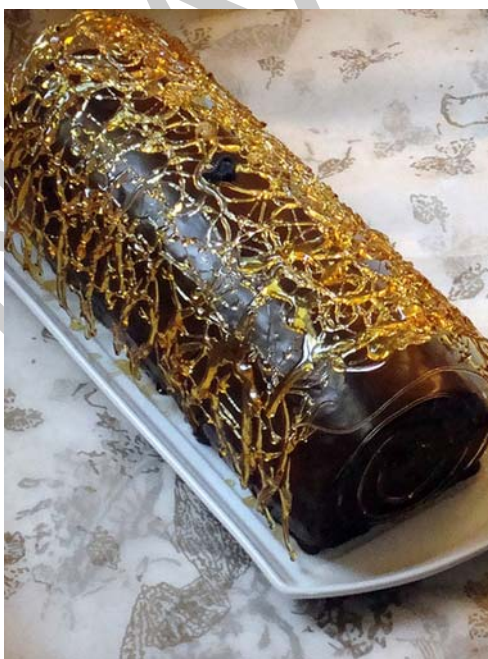
8. ábra Karamellás–csokoládés fatörzs

A tejszínes karamellkrémmel töltött fatörzset csokoládéval vonták be, majd karamellból készítették a díszet a sütemény fölé. A díszet úgy készítették, hogy egy őzgerinc formát alufóliával befedtek, leragadásgátló spray-vel befújták és a megfőtt karamellcukrot kissé visszahűtve kanál segítségével a fóliára csurgatták körkörös mozdulatokkal. Ha jól megfigyeljük a képet, akkor láthatjuk, hogy az évgűrűk imitálása is cukorból készült.