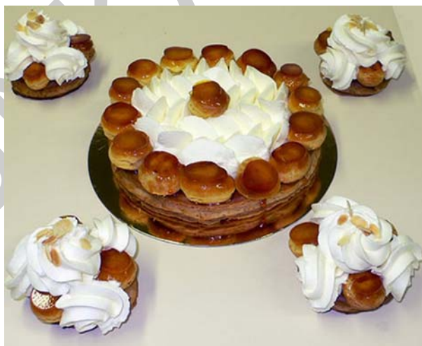
18. ábra St. Honoré tortácska

Ennek a tortának többféle elkészítése is ismeretes. Egy dolog azonban mindegyikben megegyezik. A díszítéshez kicsi, karamellbe mártott, töltött tészta fánkocskákat használnak. Ízesítése leggyakrabban vaníliás, de szokták gyümölcsös ízben is készíteni.