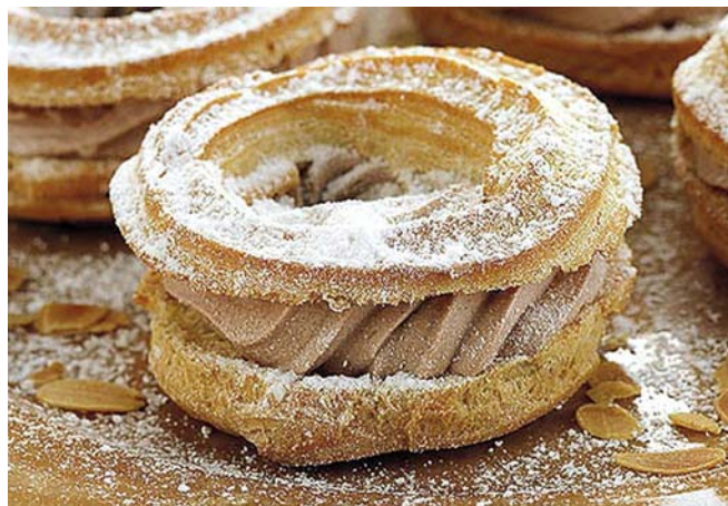
17. ábra Paris Brest

Tetejét tojással megkenjük és szeletelt mandulával megszórjuk. Sütés után tetejét levágjuk és kávékrémmel, mogyoró vagy mandula pralinével ízesített tejszínhabkrémmel megtöltjük. Tetejét ráhelyezzük és porcukorral meghintjük.