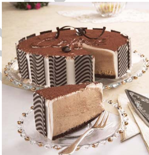
20. ábra Kávélíkőrös parfé torta