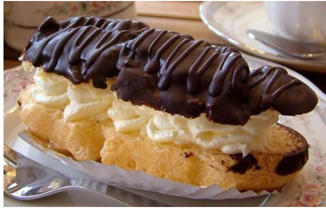
15. ábra Ekler fánk