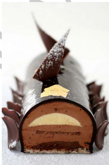
11. ábra Triplacsokis fatörzs

Az elkészítéshez mandulás piskótát használtak. Az étcsokoládés mousse rétegben található egy likőrrel átitatott mandulás tézstaréteget, fehér csokoládémousse-t és ropogós mogyorópraliné réteget. Az egész süteményt ganach-val vonták be és csokoládé díszekkel és aranylappal díszítették.