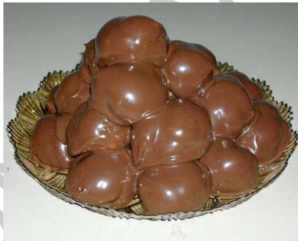
16. ábra Profitterol

Az Olaszországból származó desszertkülönlegesség elkészítéséhez szintén kisméretű fánkocskákra van szükség, melyet főzött alapú tejszínes vanília és csokoládékrémmel töltenek meg. A csokoládés töltetű fánkokat a fehér krémmel vonják be kívülről, a vaníliásat pedig a csokoládéssal.