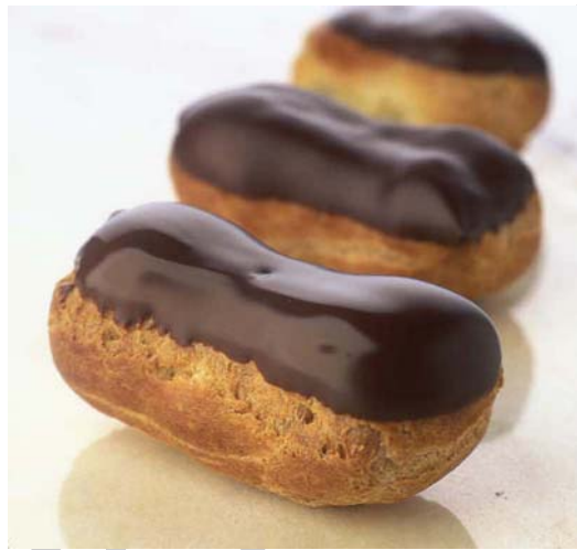
14. ábra Eclair fánk (Ekler fánk)

Az ekler fánk egy francia eredetű desszert, melyet az egész világon ismernek és készítenek. Egyes "gasztrotörténészek" szerint Antonin Carême francia cukrász készített először eclair fánkot a XVIII. században. Az első írásos emlék erről a desszetről a "Boston Cooking School Cook" könyvben jelent meg 1884-ben.