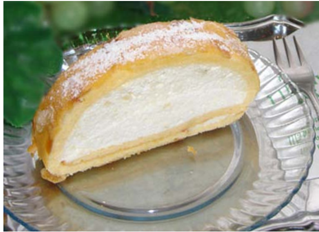
5. ábra Tokaji borkrém rolád 1

A sütőpapír segítségével áthajtuk a tésztát, így a roládunk inkább csőre emlékeztető mintát ad majd szeletelés után. A papírral jó szorosan körbefogjuk és hűtőszekrényben dermedtjük. A hűtőből kivéve szeleteljük és enyhén meghintjük porcukorral. Ha fokozni szeretnénk a díszítést, akkor tejszínhabbal, szőlővel és csokoládépasztillával díszíthetjük.