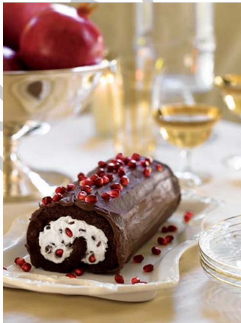
2. ábra Tejszínes csoki rolád

Az elkészítéshez kakaós felvertre van szükség, melyet reszelt csokoládéval gazdagítottunk. A sütést követően tésztát hagyjuk kihűlni, lehúzzuk róla a sütőpapírt és megtöltjük porcukorral és rummal ízesített tejszínhabkrémmel.