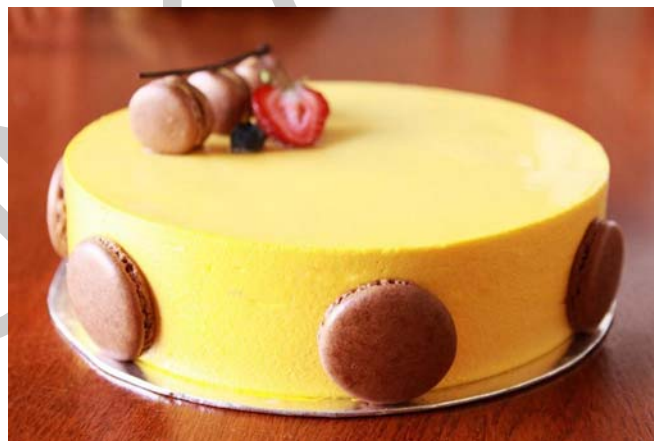
19. ábra Tojáslikőrös parfé torta