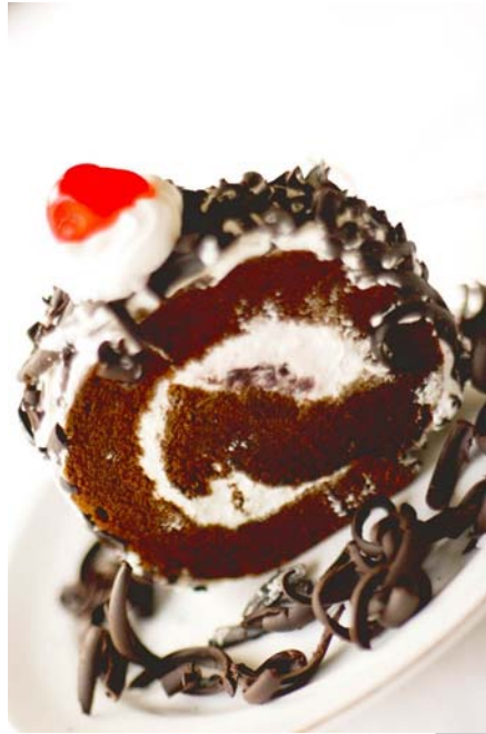
4. ábra Feketeerdő rolád

A feketeerdő rolád esetében ezek az ízek, az erősen csokoládés felvert tészta, a lágy, cseresznyepálinkával ízesített tejszínhabkrém, az enyhén savanykás meggy és valódi étcsokoládé. Az elkészítéskor a piskótalapot pálinkával ízesített cukorsziruppal átitatjuk. Az egyik hosszanti szélére meggytöltelékkel rakunk, melyre elkenjük a cseresznyepálinkás tejszínhabkrémet. Feltekerjük a roládot és papírba csavarva hűtőszekrényben dermedtjük. Kikészítéskor friss tejszínhabbal körbekenjük, csokoládéforgáccsal beszórujuk, tejszínhabrózsával és cukrozott cseresznyével díszítjük.