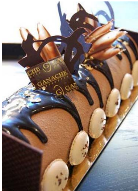
9. ábra csokoládés fatörzs

A képen látható fatörzsnek a különlegessége, hogy a betöltött sütemény felületét csokoládéval fújták be. Erre két módszer ajánlott az egyik a készen kapható csokoládé spray használata a másik a festékszóróval való bevonás. Ebben az esetben a csokoládét megolvasztjuk, olvasztott kakaóvaját vagy mogyoróolajat aduk hozzá, festékszóróba tesszük és azzal visszük fel a sütemény felületére. Ügyeljünk arra, hogy a süteményt jól hűtsük le a munka megkezdése előtt. Ezen kívül használtak még a díszítéshez macaront, csokoládé lapokat, bevonó ganache-t, csokoládé díszeket és aranyfüst fóliákat.