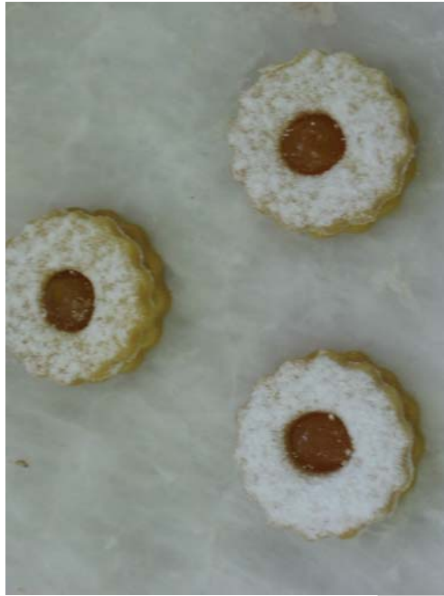
2. ábra. Kis linzer koszorú