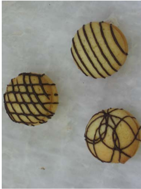
5. ábra. Kerek néró teasütemények