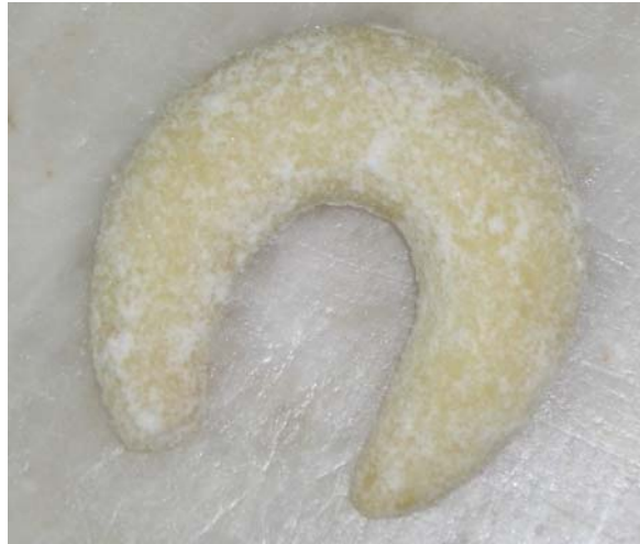
1. ábra. Vaníliás kifli

Gyakori hiba, hogy a linzerből készült süteményeket túlsütik. Nagyon fontos, hogy a sárga linzer sütés után is sárga színű legyen, ne pedig világosbarna!