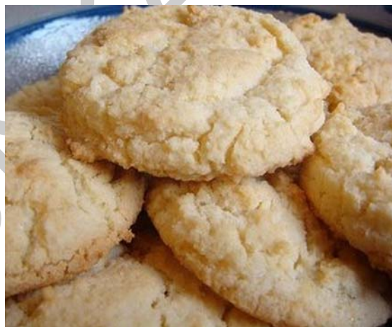
10. ábra. Fehércsokis-kókuszos keksz

A csokoládés keksz mintájára készül, annyi különbséggel, hogy a csokoládé helyett fehér csokoládét, a dió helyett kókuszt használunk az elkészítéshez.