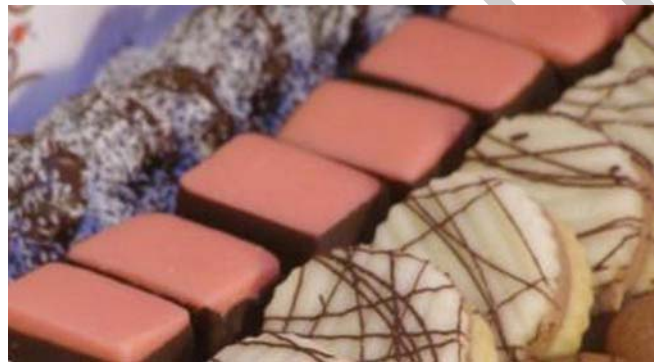
8. ábra. Édes teasütemények diókockával

Két világos kevert linzi lapot diópüré töltelékkel összetöltünk, tetejét megkenjük leiter cukorral és rózsaszínűre színezett marcipánnal beborítjuk. A marcipán lap felületét szintén vékonyan lekenjük a cukorsziruppal és kristálycukorral beszórjuk. Hűtőben történő dermedés után 20x20 mm kockára vágjuk, és alulról teljesen csokoládéba mártjuk.