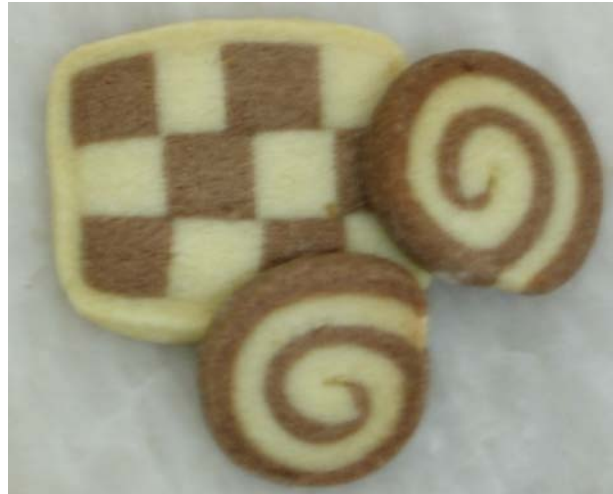
3. ábra. Linzi sakk és linzi csiga

Az elkészítéséhez szükséges sárga és kakaós linzi tészta, melyeket egyformán 3–4 mm vastagságúra nyújtunk ki. A sárga linzi lapot megkenjük tojással és ráhelyezzük a kakaós linzi lapot. A felső lapot is letojásozzuk és szorosán feltekerjük. Enyhén megsodorjuk, hogy mindenhol egyforma 30–35 mm vastagságú legyen a henger, és hűtőbe tesszük dermedni. A kifagyott tésztacsíkot 4–5 mm vastagságúra szeleteljük fel, majd fektetve sütőlemezre helyezzük. A sütést követően kikészítő műveletre nincs szükség, mert a tészták csigavonalas elhelyezkedése a dísz a süteménynek.