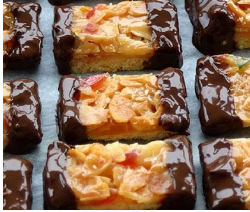
13. ábra. Florentin 3