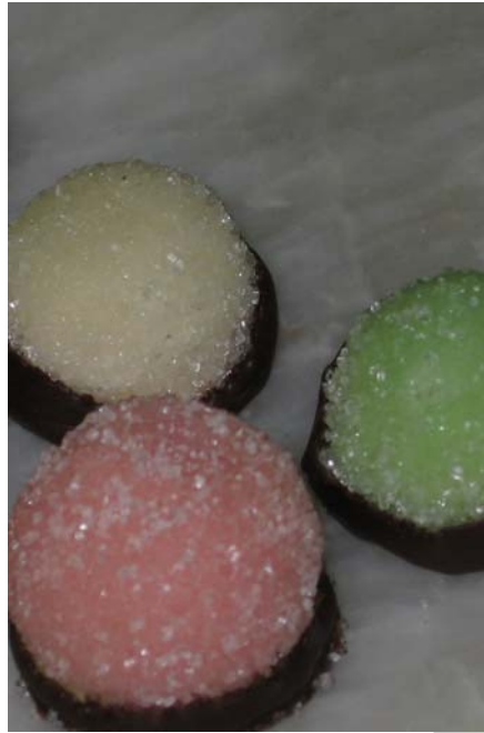
6. ábra. Marcipános néró