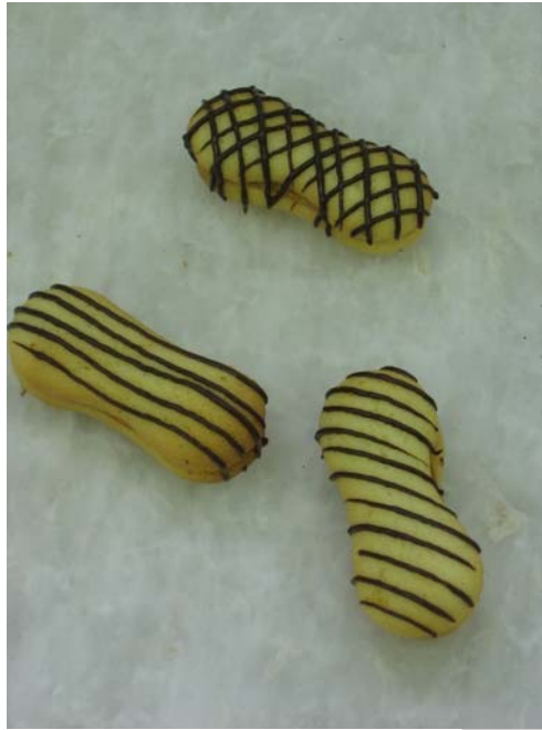
4. ábra. Néró teasütemények