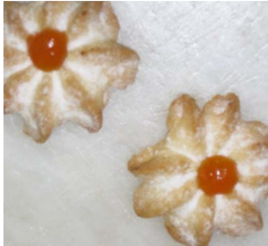
7. ábra. Vaníliás pathé