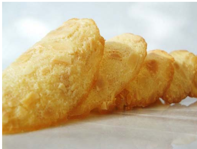
11. ábra. Mandulás Tuiles

A liszt kivételével az összes anyagot összekeverjük és tűzön csípős melegre felhevítjük. Mikor elég forró, hozzáadjuk a lisztet és elkeverjük a masszában. Enyhén bevajazott sütőlemezre nyomjuk a tésztát, számítva arra, hogy kissé terülni fog. Előmelegített sütőbe, 170–180 °C-on addig sütjük, míg a tésztakorongok szélei enyhén megbarnulnak. A sütőből kivéve azonnal alávágunk, és sodrófára téve hagyjuk kihűlni. Mikor levesszük nyújtófáról, óvatosan kezeljük, mert nagyon roppanó, törékeny a sütemény.