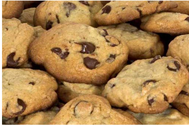
9. ábra. Csokoládés keksz

A vaját a sóval és a kétféle cukorral kikeverjük, de csak kissé habosítjuk, majd a tojásokat egyenként hozzákeverjük. A lisztet a dióval, a sütőporral és a darabolt csokoládéval összekeverjük és kihabosított tojásos keverékhez adjuk. Papírral fedett sütőlemezre kis halmokat formázunk a tésztából, simacsöves nyomószák segítségével, és előmelegített sütőben 190–200 °C-on megsütjük.