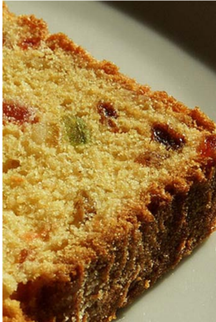
12. ábra. English cake

A kevert omlós tésztából készült gyümölcskenyér gyártástechnológiája szerint elkészíthető ez a gyümölcskenyér. Igazából fűszerzését tekintve különbözik a nálunk ismert gyümölcskenyértől.