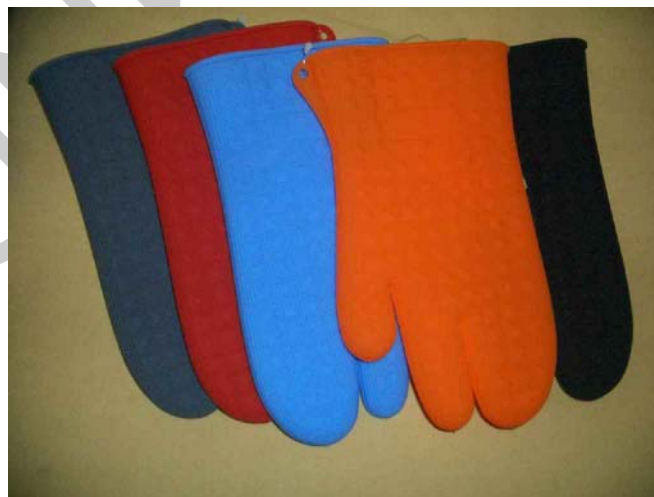
1. ábra. Sütőkesztyűk 1

Bármilyen élelmi anyaggal is dolgozunk, győződjünk meg annak megfelelő minőségéről. Nem elég a csomagoláson feltüntetett fogyaszthatósági idő ellenőrzése, hiszen a nem megfelelő szállítási, és tárolási körülmények következtében is végbemehet a minőségromlás. Az érzékszervi vizsgálat is nélkülözhetetlen ahhoz, hogy megfelelő készítményeket állítsunk elő. A nem megfelelő minőségű élelmi anyagokat azonnal el kell különíteni, és a selejtezésig, megsemmisítésig elkülönítve is kell tárolni!