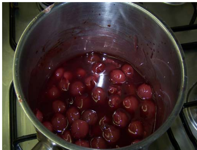
5. ábra. Kocsonyásított meggytöltelék