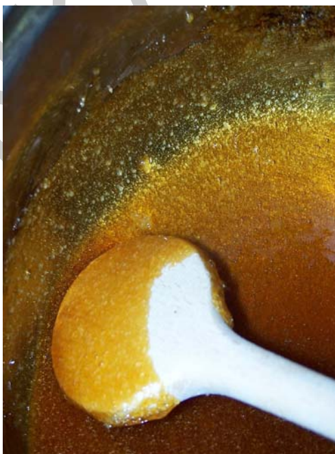
9. ábra. Doboscukor

Az olvasztott cukorkészítmények közül a doboscukor, és a grillázs is felhasználható a tartós töltelések készítése során.