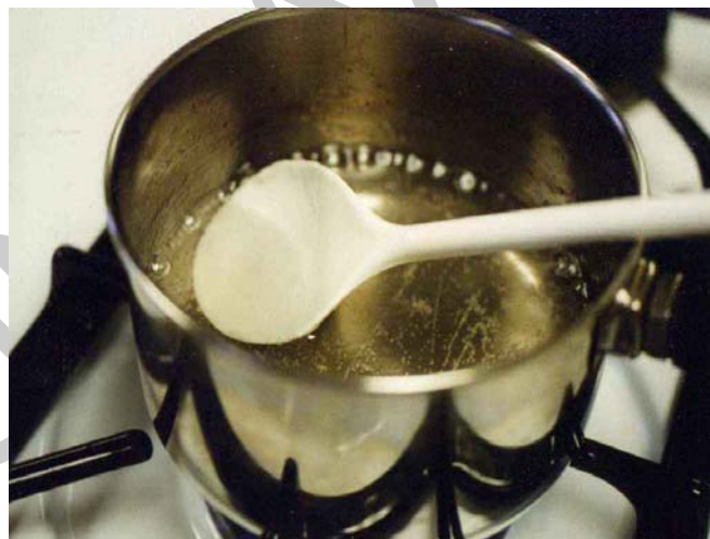
3. ábra. Cukorszirup

Vannak olyan édes töltelékek, melyekhez felhasználunk egy másik cukrászati félkész terméket. A cukorkészítmények az egyes töltelékfajtákhoz az alapot, más fajtákhoz az adalékanyagot adják. Mindebből következik, hogy a doboscukor, grillázs, különböző telítettségű cukoroldat, esetleg még a fondán elkészítéséről is kellő időben gondoskodni kell. A pontos gyártástechnológiáját a különböző cukorkészítményeknek egy másik munkafüzetből tökéletesen elsajátíthatjuk.