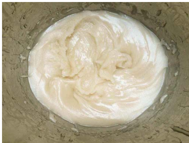
13. ábra. Fondán

A hosszabb eltarthatóságon kívül semmi nem indokolná a hagyományos vajkrémek használatát a XXI. Században! Mégis nagyon nehezen változnak a fogyasztói szokások. A kínálatunkkal viszont befolyásoljuk a fogyasztókat, tehát kerüljük a magas zsiradék-, és cukortartalmú töltelékek használatát.