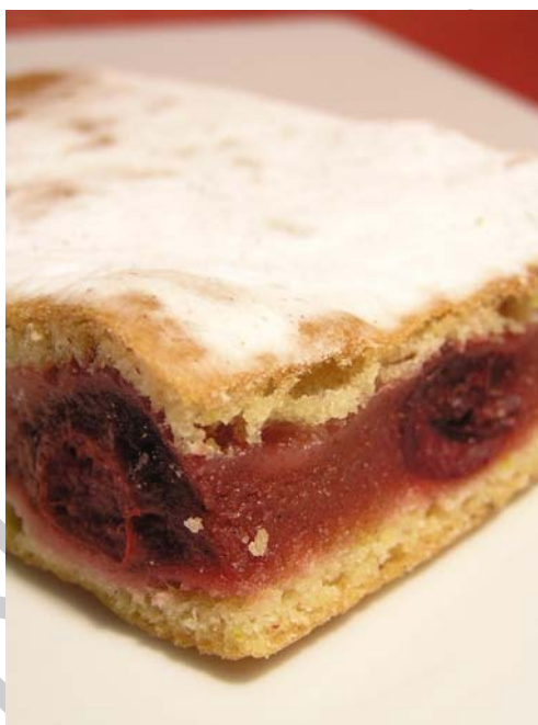
4. ábra. Meggyes pite

A cukrászatban leggyakrabban használt gyümölcstöltelékek az alma, körte, szilva, meggy. Felsorolt gyümölcsök mindegyike kapható frissen. Hazánkban mindegyik terem bőséggel. Nem véletlenül előbb említett gyümölcsök a legelterjedtebbek a töltelékek készítésénél. Ugyan napjainkban a szezonális nem feltétlenül befolyásolja az alapanyagok beszerzését, de a gazdaságosság annál inkább. Amikor nagy mennyiségben érik egy bizonyos gyümölcs, akkor abból jóval olcsóbban lehet vásárolni. A távolság is befolyásol sok mindent, hiszen a szállítás (más, távolabb fekvő termőterületekről) is költségekkel jár, amit a vevőre hárítanak. Ezért célszerű hazai alapanyagokból dolgozni, és, lehetőség szerint tartósítani a gyümölcsöket. Bár az élelmiszeripar nagy mennyiségben készítenek tartós gyümölcskészítményeket, így a kereskedelemről bármelyik fajta könnyen beszerezhető.