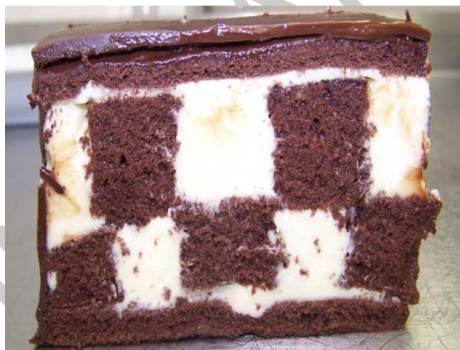
14. ábra. Főzött alappal készült vajkrémes Sakk szelet

Ebből a krémből rengeteg féle variációt készíthetünk, ha a vaníliarúd helyett egyéb járulékos anyagot keverünk a krémbe. Lehet például mogyorós , diós , cseresznyepálinkás . Dúsíthatjuk mandulalikőrrel puhított marcipánnal , rummal átgyúrt gesztenyemasszával , karamell alappal, de ha instant kávét pár csepp tejszínnel elkeverünk, és a kapott kávépasztát a kész vajkrémbe keverjük, akkor is kiváló vajkrémet kapunk.