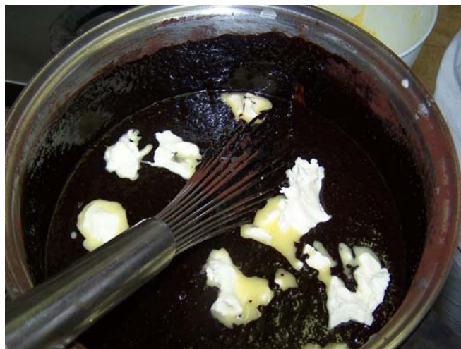
10. ábra. Párizsi krém készítése

Ezt a magas kakaótartalmú krém készítését a tejszín és cukor erős szálpróbaig történő főzésével kezdjük. Az átszitált kakaóport, és a vaj egynegyedét hozzákeverjük a főzethez. A krémkeverővel lassú mozzgatásával kihűtjük, és apránként hozzáadjuk a darabolt vajat. A végeredmény egy szép fényes, selymes krém lesz. Bonbonoknál, és a kikészített sütemények legtöbbszörénél használható töltelékként.