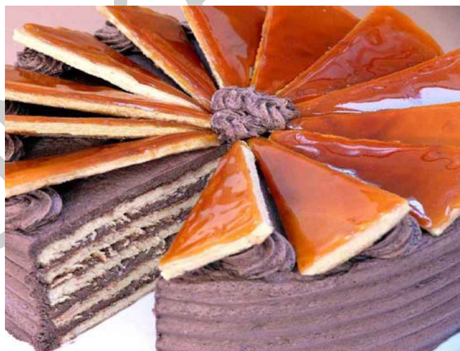
12. ábra. Dobos torta

A cukrot, a tojásokat, és a vaníliát vízfürdőn 50°C-ra melegítjük, majd kihűlésig habosítjuk. A vajat egy másik üstben szintén kihabosítjuk, majd hozzákeverjük az olvasztott csokoládét. Végül a vajas részt lazítjuk, és egyneműsítjük a kihűlt tojásos anyaggal.