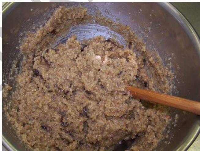
8. ábra. Forrązott diótöltelék