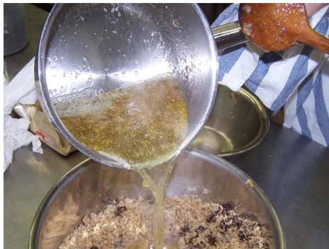
7. ábra. Diótöltelék forrązása