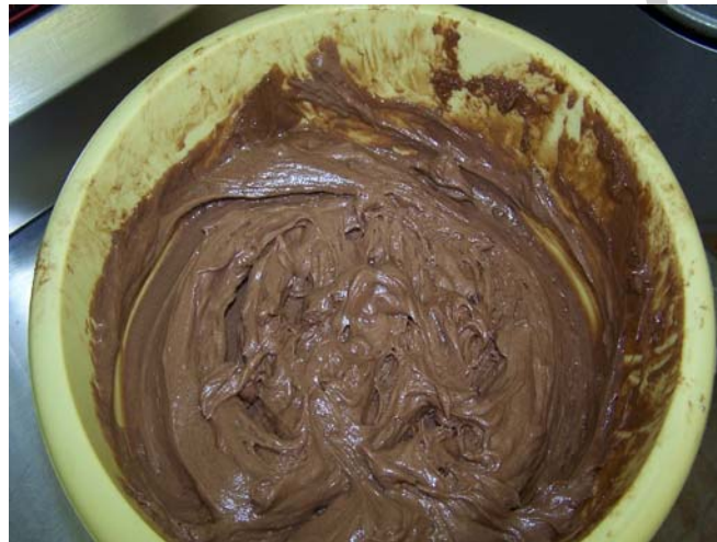
15. ábra. Csokoládés vajkrém

Előzőekben megismert vajkrémek gyártástechnológiája azonos volt. Más a helyzet a gyümölcsös vajkrémekkel. A hagyományos, magas zsiradék-, és cukortartalmú vajkrémekkel ellentétben ehhez a fajta vajkrémhez valóban harmonizálnak a gyümölcsízok.