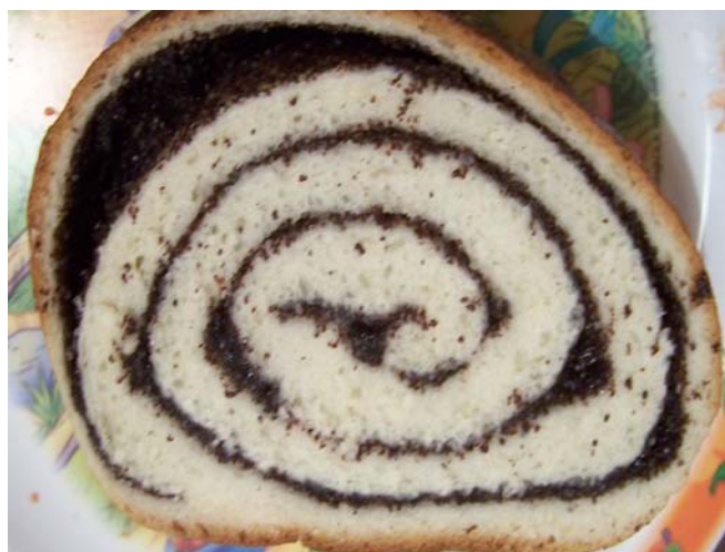
6. ábra. Mákos kalács