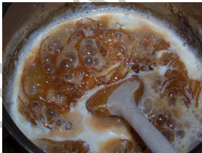
11. ábra. Karamell alap készítése

Ezt a krémet hidegen használjuk vagy önállóan bonbonok töltésére használhatjuk, de ízesítő anyaga lehet vajkrémeknek, tejszínkrémeknek.