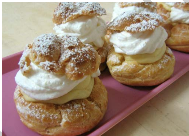
4. ábra. Képviselőfánk 3

Ennek a közkedvelt süteménynek két változata is kapható a cukrászdákban. Mindkettőnek a töltékanyaga a sárgakrém, de az egyik variáció készítésekor ezt még tejszínhabbal is megkoronázzák.