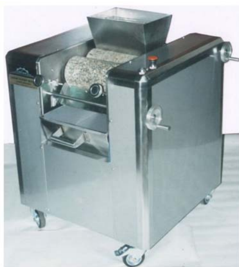
9. ábra. Hengergép

A hengerelt tészták készítéséhez hengergépet használunk, mellyel már az "Ilyen gépekkel és eszközökkel dolgozom II." című munkafüzetben már megismerkedtünk. Milyen fontos munkavédelmi szabályt tudna említeni a hengergép kezelésével kapcsolatban? Emlékszik még?