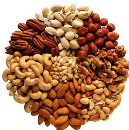
10. ábra. Olajos magvak

A hengerelt tésztákhoz leggyakrabban olajos magként mandulát, mogyorót, diót, kókuszt és a sárgabarack belső fehér magját használják.