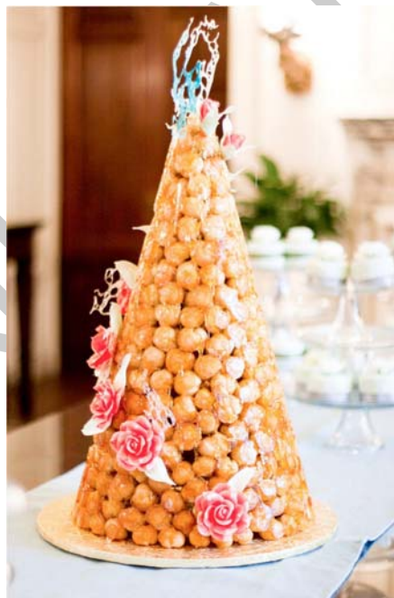
1. ábra. Croque en bouche

Ön egy szálloda cukrászüzemében dolgozik. A szálloda báltermében nagy rendezvényt fognak tartani, amire többféle különleges süteményt kell készíteniük. Ön a cukrászat vezetője mellé van beosztva és a svédasztal leglátványosabb süteményét, a Croque en bouche-t készítik el. Főnöke magára bízta a desszerthez szükséges tésztafánkok elkészítését.