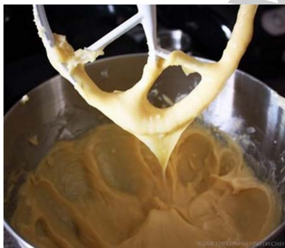
3. ábra. A forrázott tészta bekeverése2

A tésztakészítéskor az alap- és járulékos anyagok előkészítésén kívül fontos feladat az eszközök és gépek előkészítése. A jól előkészített eszközök és gépek nagyban megkönnyítik a munkánkat. Az egyik legfontosabb feladat a sütő hőmérsékletének és páratartalmának beállítása. Nagyobb mennyiségű tészta készítésekor használjunk keverőgépet a megfelelő keverőrész (habverő vagy krémkeverő) kiválasztásával.