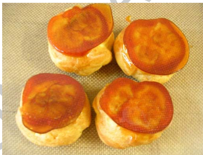
8. ábra. Choux caramel

Az apró, gömbölyű fánkocskákat vaníliakrémmel megtöltik, majd forró olvasztott cukorba mártják és a cukros felével lefelé teszik szilpát lapra. Így a cukor egyenes rétegben fog megdermedni. Általában állófogadásokra készítenek ilyen süteményt, akkora méretben, hogy kényelmesen beférjen az ember szájába, anélkül, hogy ketté kelljen harapnia.