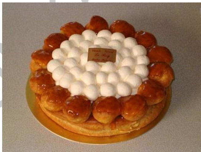
7. ábra. St. Honoré torta 6

Ennek a tortának többféle elkészítése is ismeretes. Egy dolog azonban mindegyikben megegyezik. A díszítéshez kicsi, karamellbe mártott, töltött tészta fánkocskákat használnak. Ízesítése leggyakrabban vaníliás, de szokták gyümölcsös ízben is készíteni.