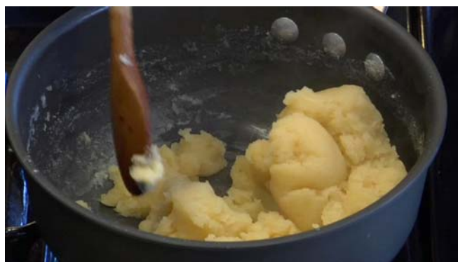
2. ábra. A forrázott tészta resztelése

A folyadékot a sóval, a cukorral és a zsiradékkal forráspontig hevítjük, majd beleöntjük a lisztet és folyamatos keverés mellett lereszteljük.