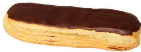
5. ábra. Eclair fánk4

A forrázott tésztát hosszúkás (babapiskóta) alakúra formázzuk nyomózsák segítségével. A sütést követően, tetejét – a töltéknek megfelelő színű- fondánnal bevonjuk. Az eredeti készítési mód szerint a fánkokat oldalról töltjük meg az előkészített ízesített tejszínhabkrémmel vagy a főzött alapú krémmel.