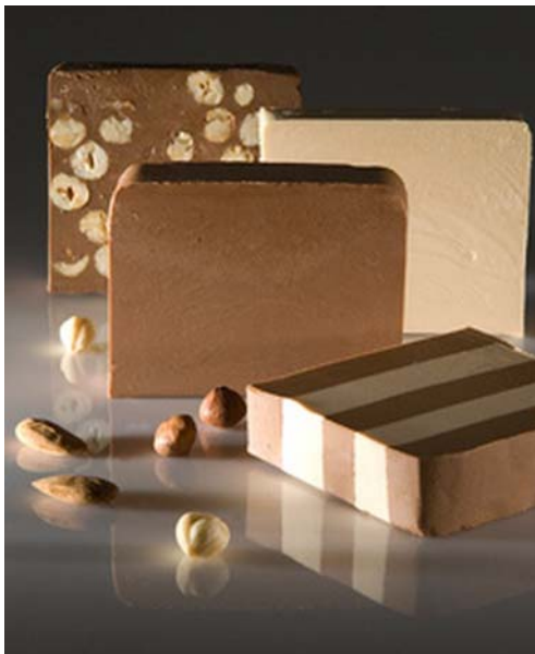
12. ábra. Nugátok 9

A nugátokat a marcipánokhoz hasonlóan készíthetjük hideg vagy meleg úton. A hideg úton készült nugátokhoz az olajos magvakat megpörköljük, összekeverjük a cukorral és többször lehengerejük. Hengerlés közben a receptúrában szereplő zsiradék 1/3-ad részét hozzáadjuk.