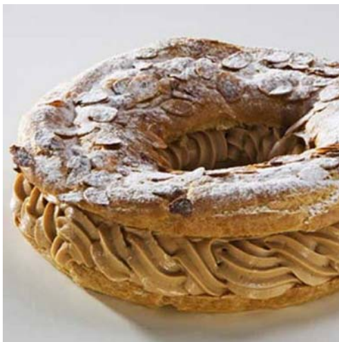
6. ábra. Paris Brest 5

Tetejét tojással megkenjük és szeletelt mandulával megszórjuk. Sütés után tetejét levágjuk és kávékrémmel, mogyoró vagy mandula pralinével ízesített tejszínhabkrémmel megtöltjük. Tetejét ráhelyezzük és porcukorral meghintjük.