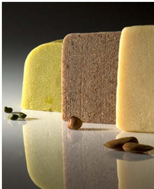
11. ábra. Pistácia, mogyoró és mandula marcipánok 8

A meleg úton készített marcipánokhoz cukorszörpöt főzünk, melyet 115°C-ra sűrítünk be. (A fondán készítésekor – Így kell a cukrot "idomítani" I. című munkafüzetben – már megismerhettünk az elkészítésével.) A megőrölt olajos magvakat elkeverjük a cukorszörppel és márványasztalra kiöntve hűlni hagyjuk. A kihűlt masszát a megismert módon háromszor hengereljük le. Ezekén kívül lehet készíteni tartós étkezési marcipánt, melynek elkészítése abban különbözik a meleg úton készített marcipán készítésétől, hogy az összes alapanyagot főzik fel vákuumüstben, és állományjavító anyagot és tartósítószeret adnak hozzá. A kihűlt masszát a szokásos módon hengerlik. A hőkezelés hatására az anyag majdnem teljesen csíramentes, így akár 1 évig is eltartható. Az állományjavítónak köszönhetően pedig ezen időtartam alatt nem szárad ki.