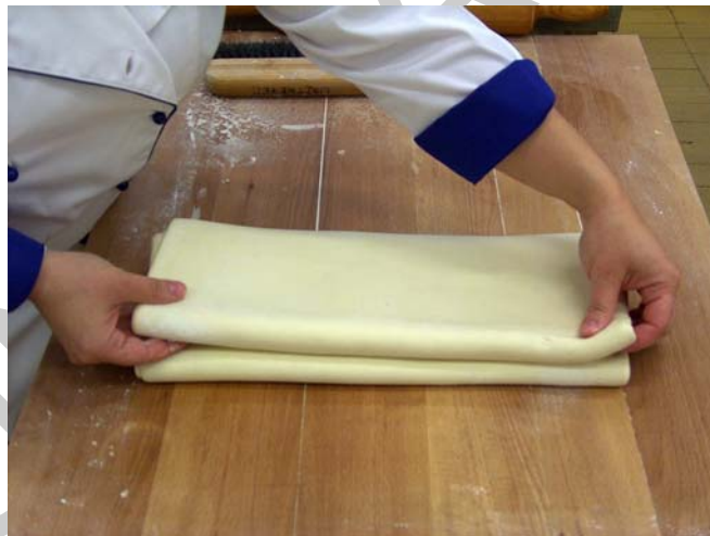
5. ábra. Szimpla hajtás

Szimpla hajtogatásnál: gondolatban három egyenlő részre osztjuk a tésztát, majd az egyik oldalt behajtjuk a második jelölésig, és erre ráborítjuk a másik oldalt. Így három réteget alakítunk ki. Fontos, hogy a hajtások között a lisztet alaposan söpörjük ki és ne álljon az egyes tészta rétegek között.