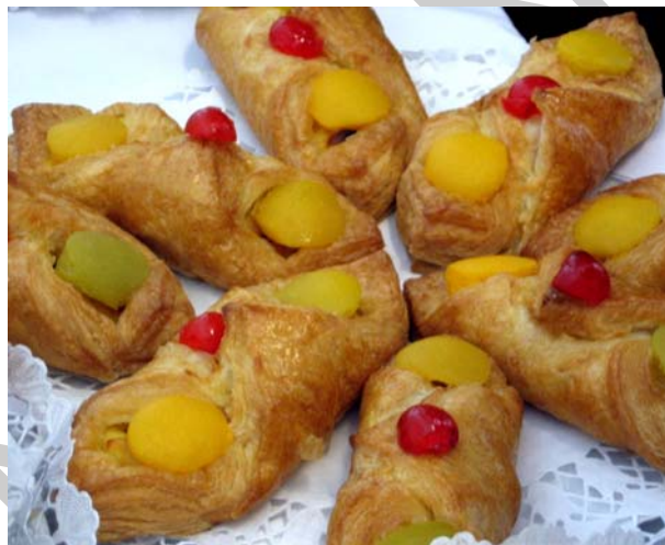
10. ábra. Gyümölcspapucs

Készíthetünk a papucs mintájára különféle vágástechnikákkal gyümölcsös süteményeket. Süthető krémekkel a közepükben pl. vaníliakrém, habos-mákos töltelék, túró-töltelék stb. Arra ügyeljünk, hogy az ízek harmonizáljanak egymással pl. mák-meggy, túrókrém-barack stb.