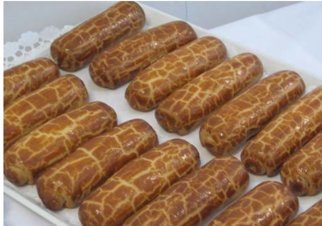
13. ábra. Pozsonyi bejgli

A szép pozsonyi bejgli aransárga színű, felülete fényes és márványozottan repedezett.