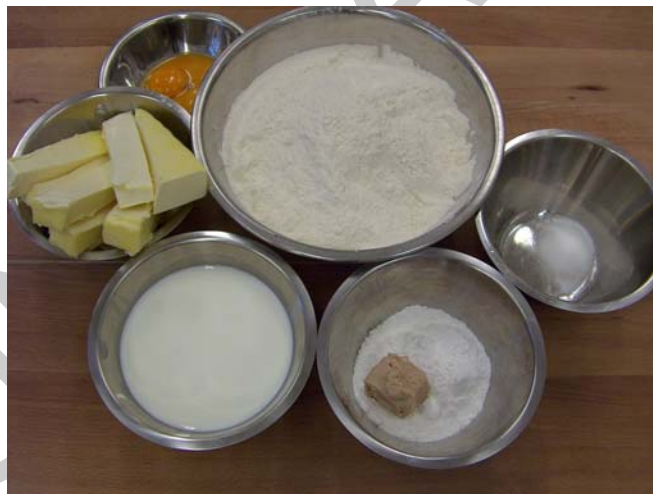
2. ábra. Nyersanyagok előkészítése

1. Tésztakészítésnél mindig az előkészítő műveletekkel kezdjük. Előkészítjük a szükséges eszközöket és kimérjük a felhasználandó nyersanyagokat.