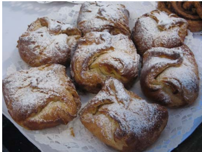
7. ábra. Túróstáska

A háromszor hajtogatott, blundel tésztát 8mm vastagságúra kinyújtjuk, majd 10*10 cm-es négyzetekre osztjuk be. A négyzetek sarkait tojással megkenjük, a túró-töltelék a négyzetek közepére rakjuk, majd a sarkokat átlós irányban egymásra hajtjuk, táskát készítünk. Egy 6 dkg súlyú túrós táskához kb. 4 dkg tészta és 2,5-3 dkg túró-töltelék szükséges. A süteményeket tiszta sütőlemezre helyezve 15-20 percig kelesztőben érleljük, felületüket megkenhetjük tojással, de ha porcukrozzuk a végén, akkor kihagyhatjuk, ezt a műveletet majd sütjük. Tudnunk kell, hogy a tojás szép felületet ad a tésztának és megvédi a tészta felületét sütés közben a kiszáradástól is. A sütést 210-230 °C gőzös sütőkemencében kezdjük, majd kevésbé forró, enyhén gőzös sütőtérben fejezzük be. Sütés után vaníliás porcukorral meghintve tálaljuk.