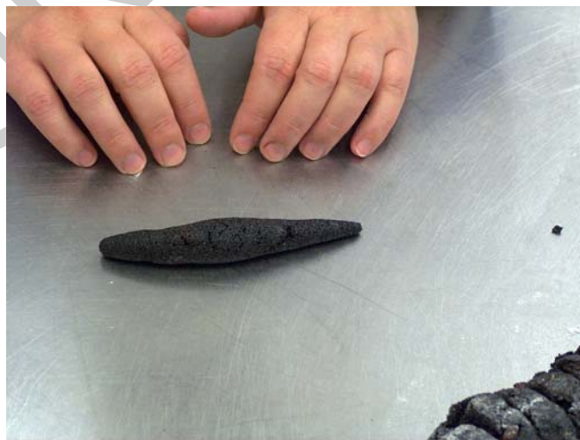
14. ábra. Töltelék formázás

Márvány vagy faasztalon lisztezés nélkül ovális alakokat nyújtunk. A forrázott töltelék szivarra emlékeztető formára hengereljük úgy, hogy két végét elvékonyítjuk.