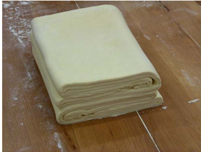
6. ábra. Blundeltészta

A tésztát hűtőben pihentetjük kb 30 percet majd a dupla hajtást megismételjük és újra pihentetjük.