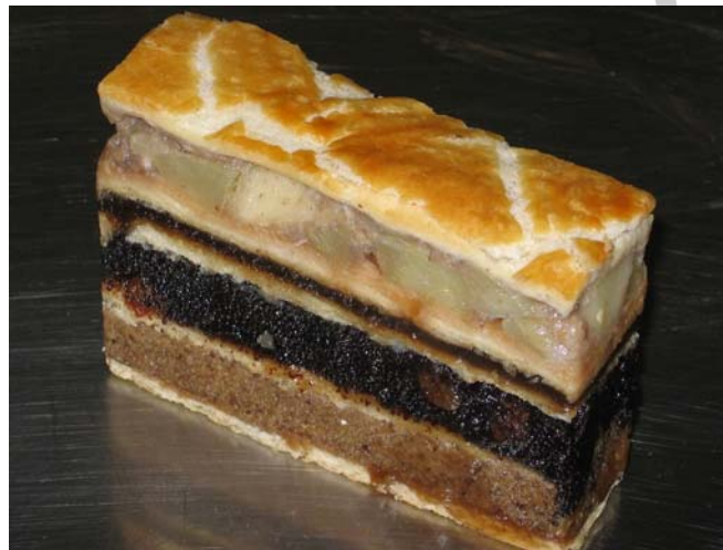
16. ábra. Flódni

Jellegzetesen közép-kelet európai sütemény. Tésztája lisztet, libazsírt, porcukrot, élesztőt, sót és fehérbort tartalmaz. A tészta készítése megegyezik az eddig tanultakkal. Hűvös helyen pihentetjük. Tölteléke forrázott dió, mák szilvalekvár és almatöltelék. A tésztából 5 db 5 mm vastagságú lapokat nyújtunk. Az első lapot sütőlemezre helyezük és keretet helyezünk köré, ebben könnyebben tölthetjük a tésztát. Az egyenletes töltés miatt célszerű kimérni egyenlő részekre a töltelégeket, kivéve a szilvalekvárt. Törekedjünk a töltelékek egyforma vastagságára. Először a dió majd a mák, a szilva és végül az almatöltelék következik. Miután lefedtük az almatölteléket tésztával felületét megkenjük tojással és mintázzuk. Kelesztés után 160–180°C-on sütjük enyhén gőzös sütőtérben, hogy a sütemény jól átsüljön. A sütemény magassága 6–10 cm között változik súlya 80–100g között lehet.