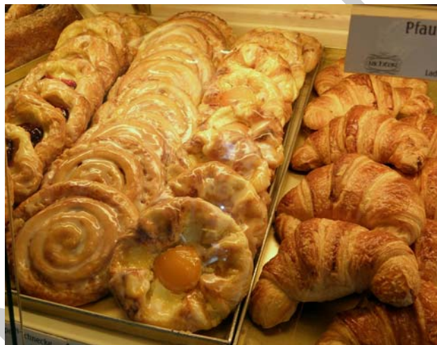
12. ábra. Croissant termékek

A tésztát kinyújtjuk, 8–10 mm vastagságúra majd egyenlő szárú háromszög alakúra felvágjuk és töltjük. A lágy töltelékkel elkenjük a tészta felületén a száraz töltelék alá mindig kenünk olvasztott vajot. A kiflit feltekerjük szorosan, végeit nem behajtva és ívesen meghajlítjuk és a tiszta sütőlemezre helyezük. Croissant tészta jól bírja a fagyasztást, felengedés után úgy süthetők, mint a friss készítmények. Sütése 220° -on történik enyhén gőzös sütőtérben.