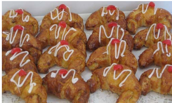
8. ábra. Svájci kifli