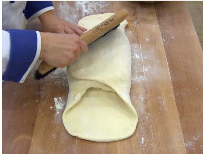
4. ábra. Vajas rész burkolása

Szimpla hajtogatásnál: gondolatban három egyenlő részre osztjuk a tésztát, majd az egyik oldalt behajtjuk a második jelölésig, és erre ráborítjuk a másik oldalt. Így három réteget alakítunk ki. Fontos, hogy a hajtások között a lisztet alaposan söpörjük ki és ne álljon az egyes tészta rétegek között.