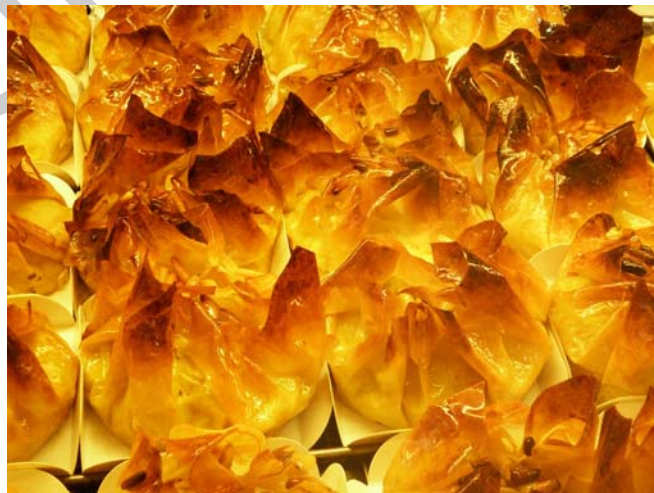
1. ábra. Uzsonnyasütemények

Erről a tésztacsoportról tudjuk, hogy az egyik legrégebben készített és legkedveltebb tésztafajta. Elterjedését széles rétegben viszonylag olcsóságának és anyáról leányra öröklődött készítési módjának köszönheti. Nagyanyáink értették a sütés–főzés rejtelseit és a tészta készítésénél a hagyományokra hagyatkoztak. Mi ebben a fejezetben megismerkedünk a miértekkel és a hogyanok módjaival valamint okaival is.