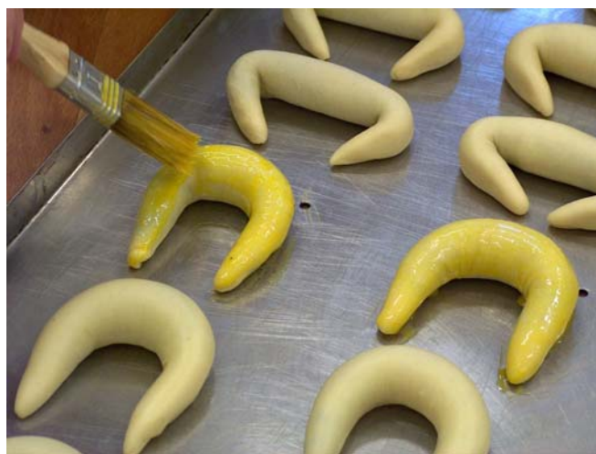
15. ábra. Pozsonyi kifli kenése

Kenése megegyezik a bejglinél megismertekkel, a könnyebb kenés érdekében alkalmazhatunk először 1 egész tojás+2 tojássárgája keveréket , így a kenés elvégzése könnyebb. Sütése 190°C-on történik egy ütemben, enyhén gőzös sütőtérben.