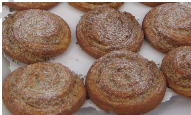
9. ábra. Diós csiga

Igen közkedvelt sütemény a sós ízesítésű csiga is. Ilyen pl. a pizzás, sajtos vagy fokhagymás csiga. Ebben az esetben a blundel tészta kevesebb cukorral készül és tölteléke az elnevezésnek megfelelően valamely sós- fűszeres töltéket kap.