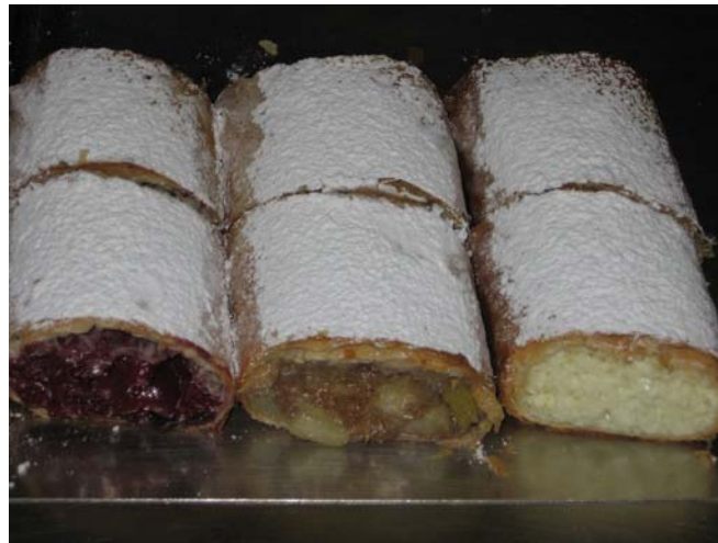
11. ábra. Tiroli rétesek

Készíthetünk cseresznyés, meggyes, almás, szilvás, túrós, diós és mákos tiroli rétest is.