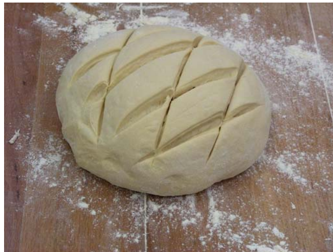
3. ábra. Előtészta

4. A tésztát faasztalra kirakjuk, alálisztezzük és cipót formálunk belőle. Tetejét bevagdossuk és langyos helyen letakarva érleljük.