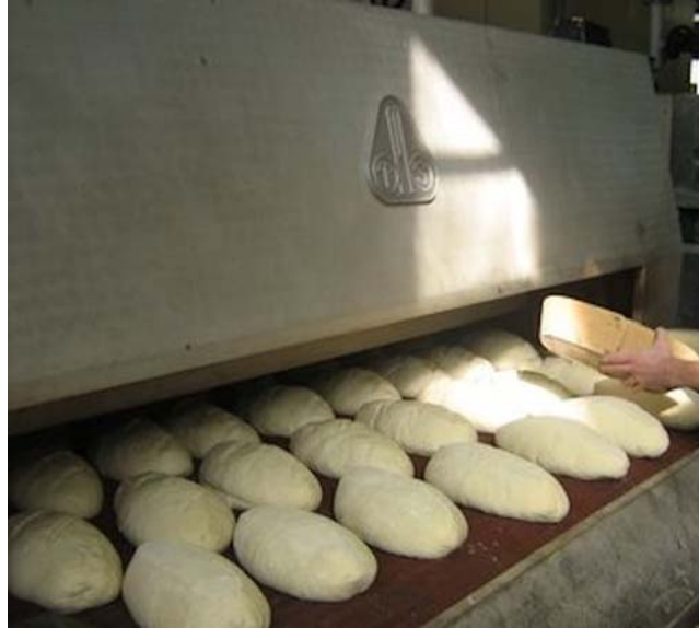
4. ábra Sütés előtt (fehér kenyér)