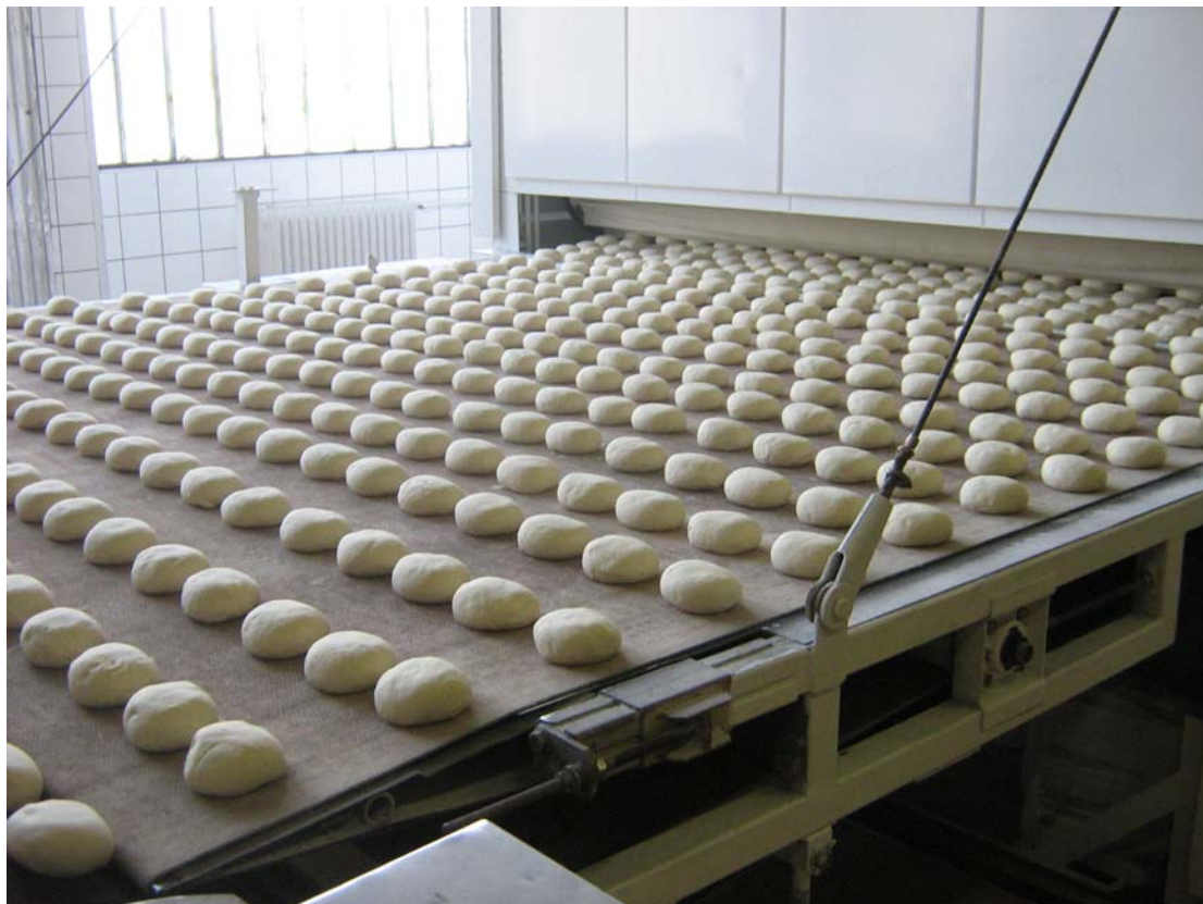
2. ábra Sütés előtt (vizes zsemle)