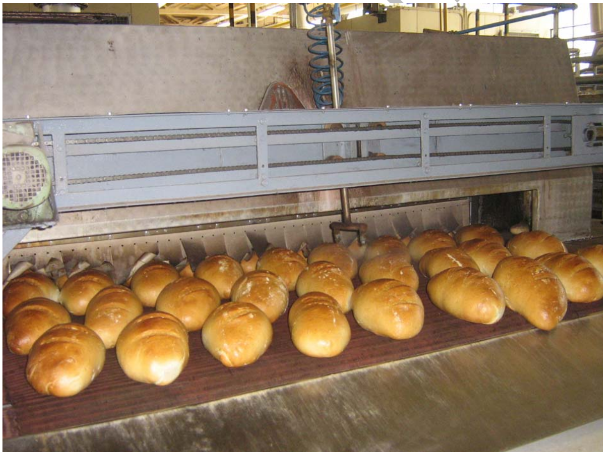
5. ábra Kisült fehér kenyér