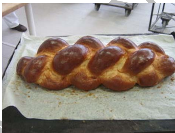
7. ábra Kisült finom fonott kalács