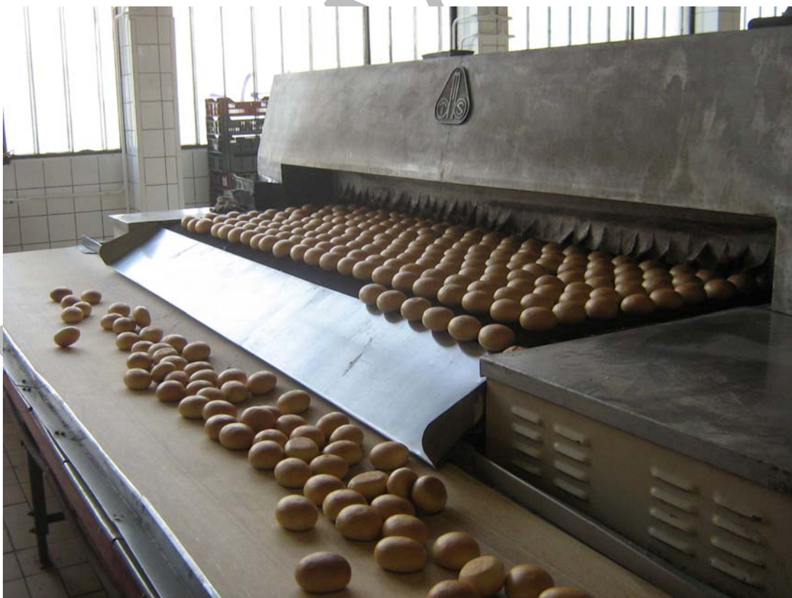
3. ábra Kisült vizes zsemle