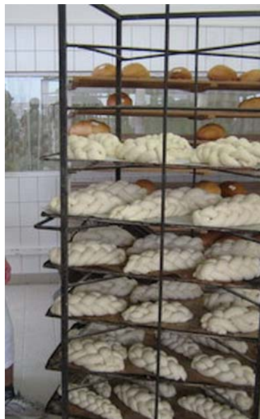
6. ábra Sütés előtt (finom fonott kalács)