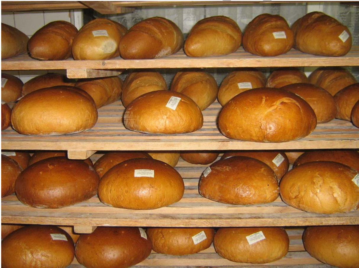
1. ábra Kisült kenyér

A pékségben a szakmai gyakorlatok során, sokféle kenyér és péksütemény készítéséről tanul. Bármely termék készítéséről legyen is szó, ahhoz, hogy élvezhetővé, könnyebben emészthetővé váljon, meg kell sütni a tésztát. Éppen ezért elengedhetetlen, hogy ismerje a sütés célját és azokat a paramétereket (a sütés feltételeit), amelyek fontosak ahhoz, hogy a különböző összetételű tészták, jó minőségű késztermékké váljanak