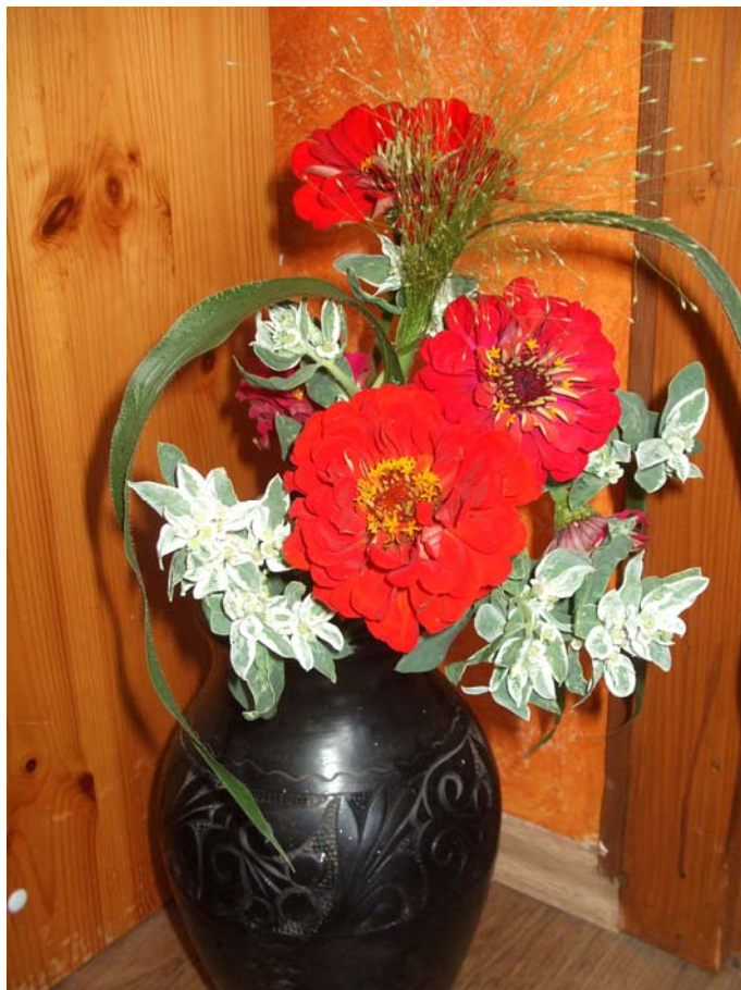
8. ábra. Rézvirág csokorban