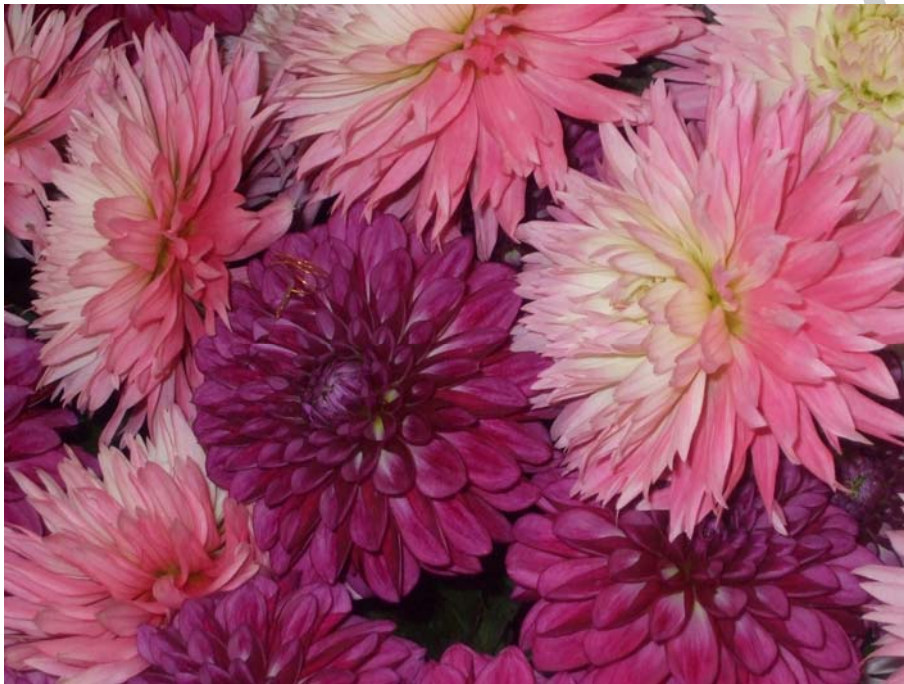
9. ábra. Dahlia x hybrida (dália)

Ültetés: tápanyagigényes növény a dália, előző évben szükséges a talaj trágyázása. Május 10. körül ültetjük ki a növényeket. Az ágyások mérete 120 x 150 cm, a tövek az ágyásokban térigénytől függően 40 x 40 vagy 30 x 30 cm. Ha elég sűrűn ültetjük a növényeket megtartják egymást, nem kell karózni.