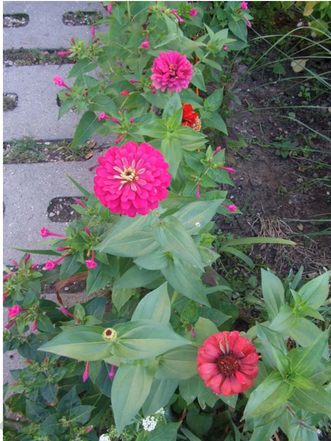
7. ábra. Zinnia elegans (pompás rézvirág)

Leírása: bokrosodó, 30–80 cm magas, elágazó szárú növény. Vágásra alkalmas fajták 50– 90 cm magasak. Levelei nagyok, fényesek, szőrösek. Júliustól virágzik, a virágok teltek vagy félteltek, a virág színe lehet piros, rózsaszín, sárga és fehér, lila. A virágok 8–12 centiméter átmérőjűek. Hosszan virágzik. Virágzási idő: júliustól a fagyokig.