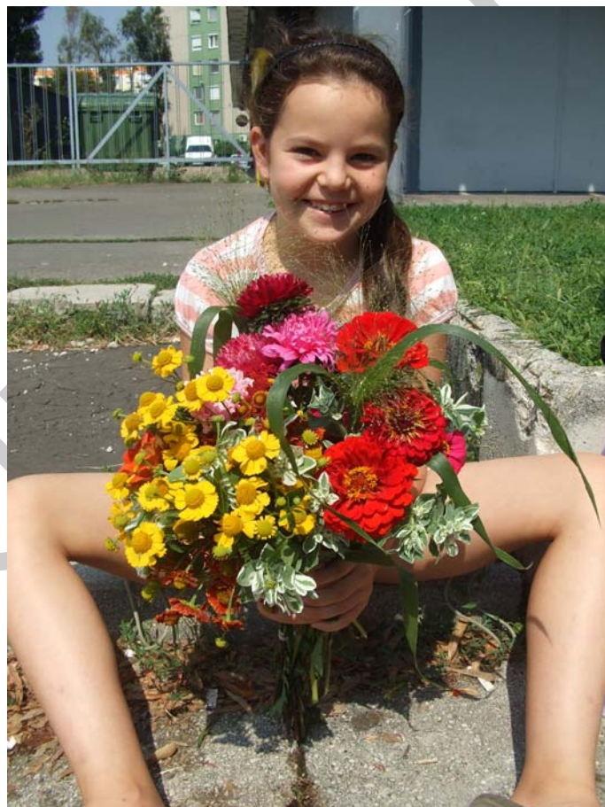
1. ábra. egynyáriak csokorba

Az ember vágya, hogy otthonába is megjelenjen a természet. Erkélyen, balkonon kis kertcskék pompáznak, cserepes növényekkel díszítjük a szobát. Vázába szívesen vásárolunk virágot, vagy a kertben díszítő virágokból szedünk egy csokorral. Vágott virágnak nemcsak a növényházban termesztett virágok kedveltek, hanem az olcsóbb, színes, vidám egynyáriak közül is válogathatunk. Igazi nyári hangulatot varázsolnak otthonunkba.