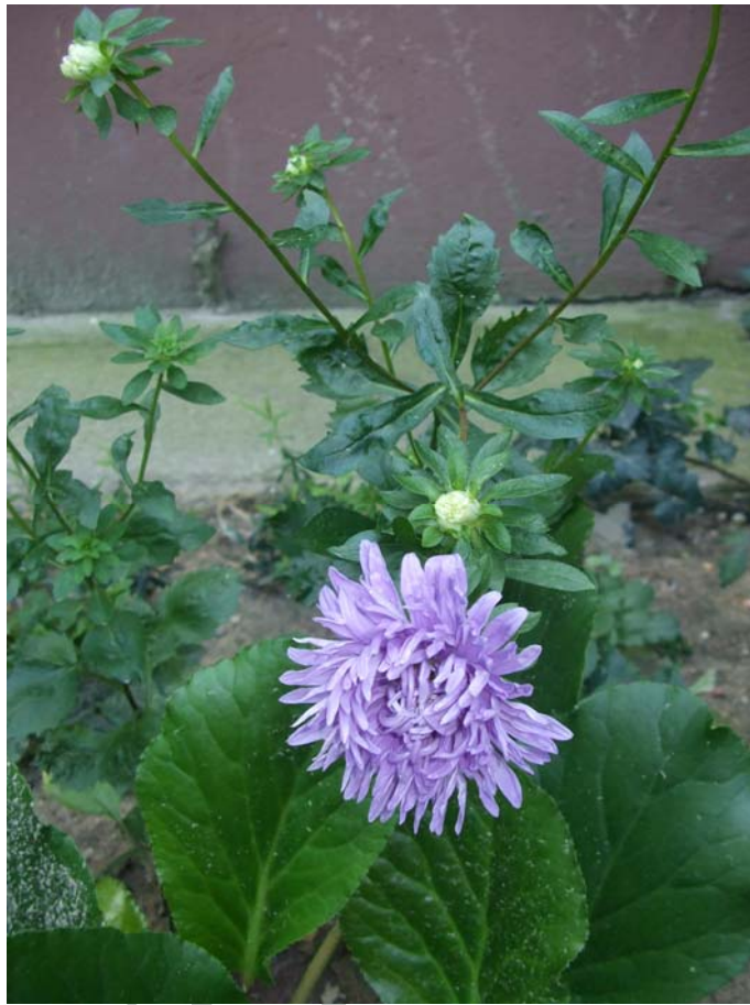
4. ábra. Callistephus chinensis (őszirózsa)

Szaporítása: magvetéssel február végétől április végéig. Szakaszosan vetve a virágzási idő meghosszabbítható.