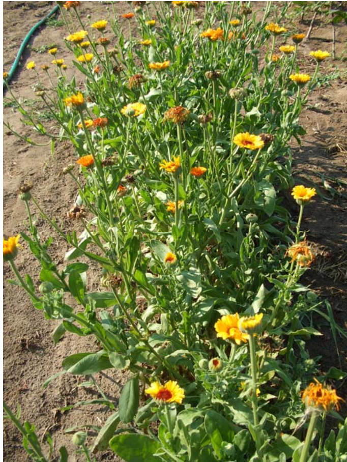
3. ábra. Calendula officinalis (kerti körömvirág)