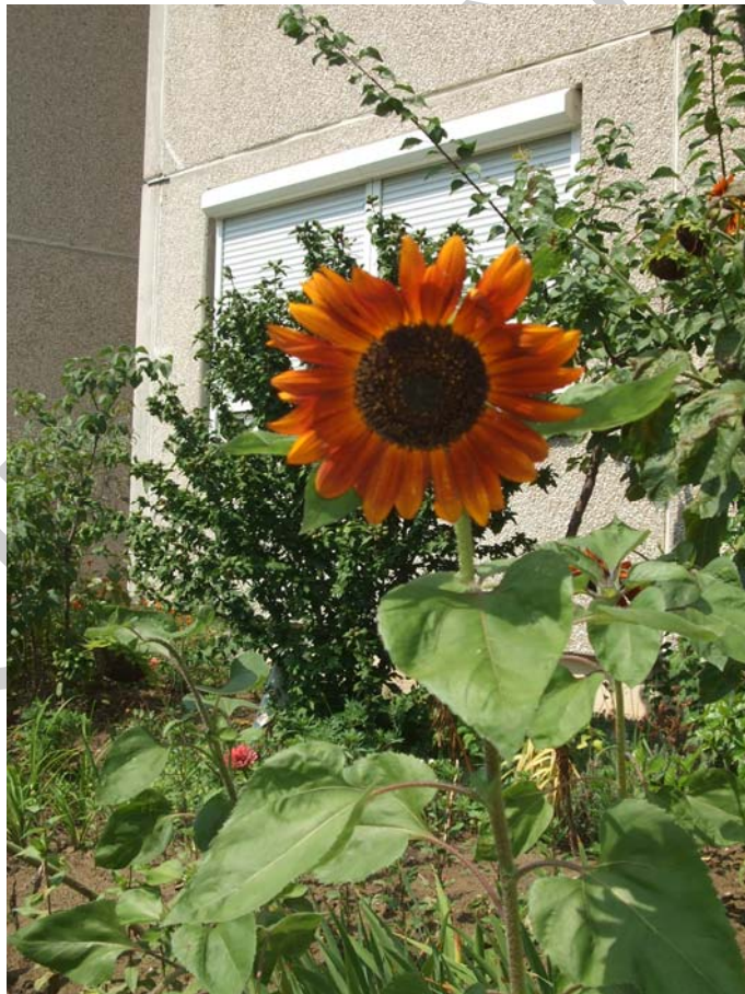
2. ábra. Helianthus annuus (napraforgó)

Leírása: 60–250 cm magasra növő növény. A szár merev, érdes, belül szivacsos. A virágzat lehet egyszerű vagy telt, lehet csak egy virágot hozó, valamint elágazó szárú is. A sugárvirágok általában sárgák, de lehetnek sárgásbarnák, barnák is. A virágok július, augusztusban nyílnak.