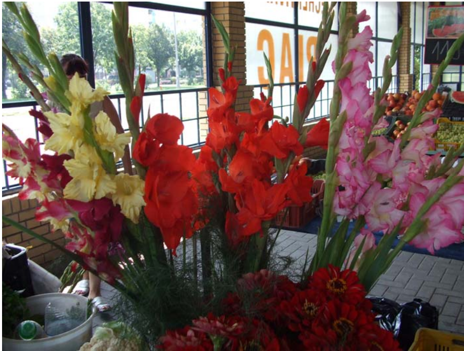
10. ábra. kardvirágok a piacon

Hagymagumós növény. Lapított, sárga, rózsaszín vagy piros a hagymagumója. Vágott virág természetesen a 7–10 cm körméretű hagymagumó alkalmas. A gumókat télen száraz, hűvös helyen telettetjük, szükséges hőmérséklet: 6–8 °C.