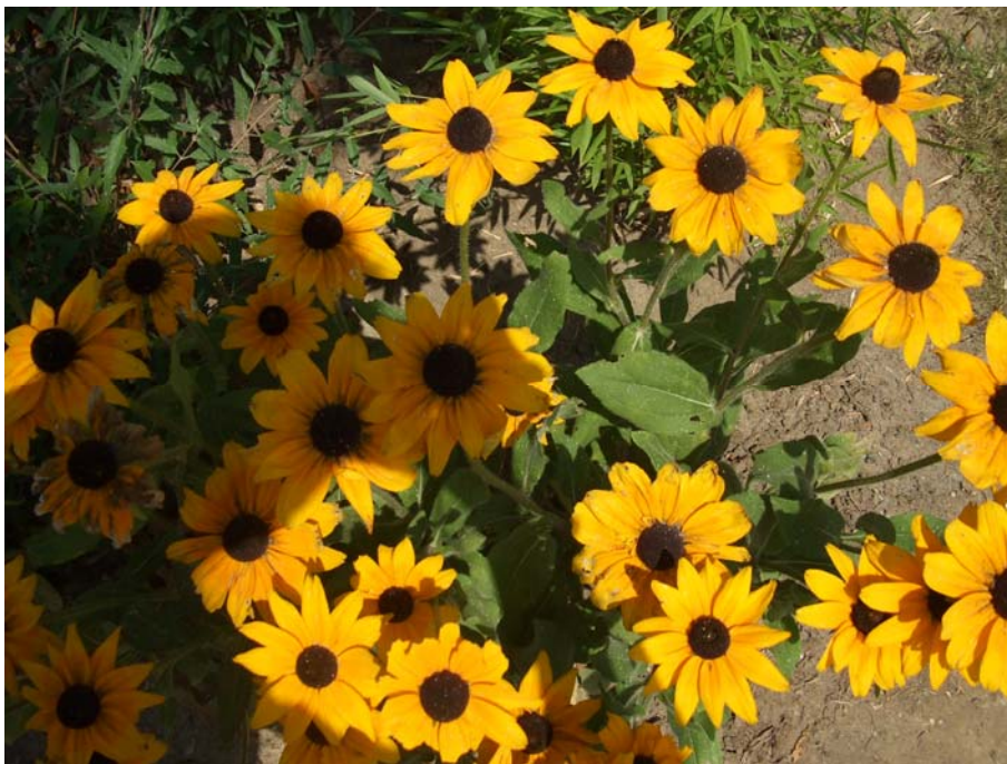
6. ábra. Rudbeckia hirta (borzas kúpvirág) Szaporítása: márciusban magvetéssel szaporítjuk termesztőberendezésben. Karógyökerű, így cserépben célszerű nevelni. Április végén szabadföldre is vethető. Tőtávolság: 20–30 cm.