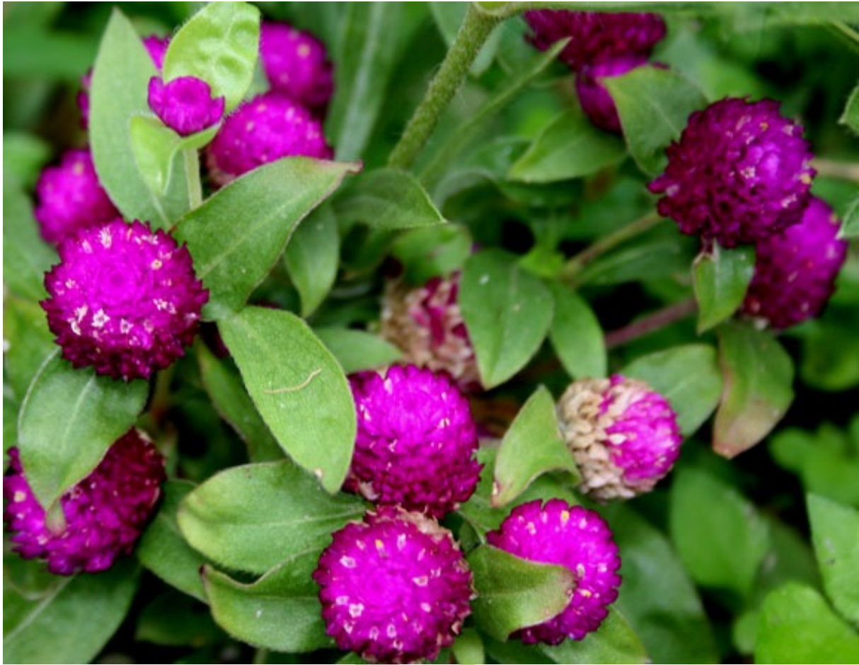
13. ábra. Biborka 11

Leírás: Kompakt növény, amely általában a tővétől számítva 35–70 cm magasra nő. Igazi virágai jelentéktelenek, picinyek, sárgásfehér színűek, tölcsér alakúak, amelyek csak nagyon közelről láthatók. A lila, fényes, a lóhere virágára hasonlító virágok adják az igazi szépségét, nyártól kezdve egészen a fagy beálltaig. Leveli zöldek, hosszúkásak, ellipszis alakúak.