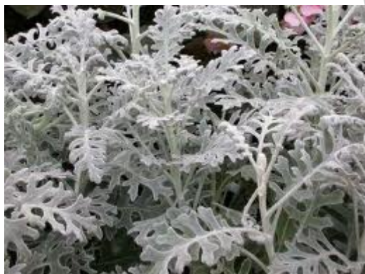
5. ábra. Hamvaska 4

Leírás: Régóta termesztett és kedvelt kerti egynyári dísznövény. Gyönyörű szürke levélzete, ezüstösen szőrözött, szárnyasan osztott. Nyáron sárga, margaréta-szerű virágokat hoz, ám ezeket a legjobb lecsipkedni, mert ezek díszítő értéke nem jelentős.