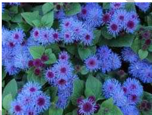
6. ábra. Bojtocska 5

Leírás: Magas növésű (30cm) és törpe (15cm) változatok közül választhatunk. Virágai általában kékek, de fehér és rózsaszín változatai is kaphatók. Egész nyáron folyamatosan ontja a virágait.