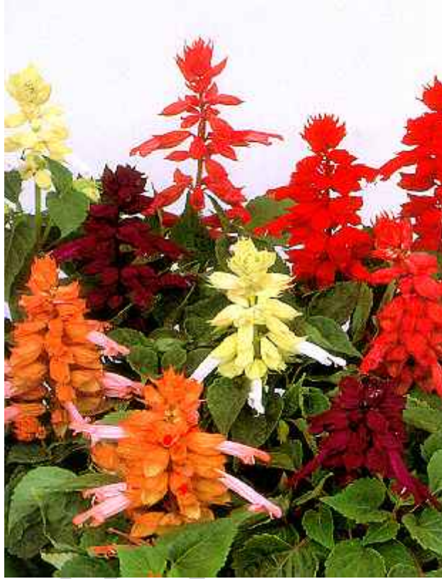
3. ábra: Paprikavirág 2

Leírás: A lángható piros paprikavirág fő színtöltője a napfényes virágágyaknak, balkonládáknak. 20–30 cm magas növény, szép szív alakú leveleivel és a hajtásvégeken lévő fürtös virágaival díszít.