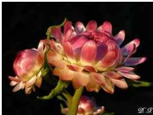
14. ábra. Szalmarózsa 12

Leírás: Magassága 60–100 cm. Felálló, száraz virágaival díszít. Elágazódó növekedésű növény.