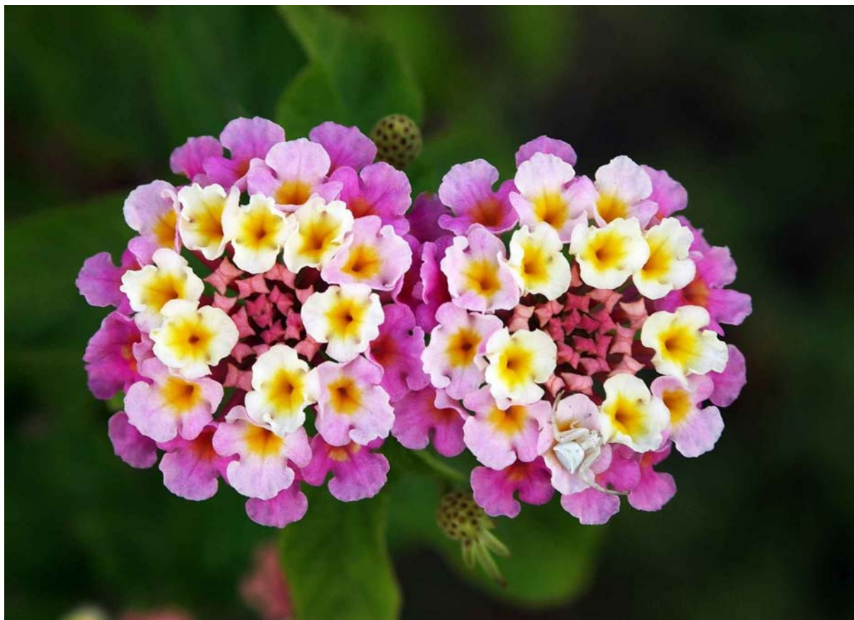
35. ábra. Lantana 27

Leírása: Többnyire 1–2 m magasra nő, de kaphatóak fácskának nevelt és bokros változatai is. Metszéssel tetszőleges alakúvá nevelhető. Átellenes, egyesével álló redőzött, hosszúkás, sötétzöld levelei közvetlenül a sudár ágak mentén nőnek. A levelek és a hajtások is szőrösek. A hajtáscsúcsokon fejlődnek és késő tavasztól késő őszig nyílnak a verbénáéhoz hasonló, domború virágzatok. Mindegyik virág apró csöves és központi szemes. Levelei és virágai egyaránt átható, citromos illatot árasztanak.