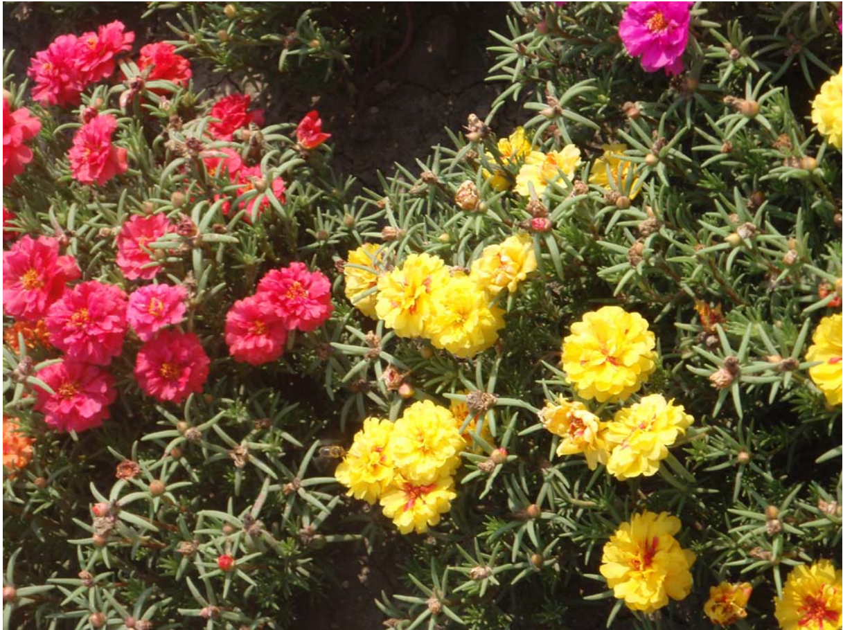
33. ábra. Porcsinrózsa

Leírás: Elterülő, pozsgás jellegű növény, színárnyalatokban gazdag virágokkal. 10–15 cm magas, hengeres 1–1,5 cm-es levelekkel. A hajtásvégeken nyílnak 2,5–3 cm-es selymes fényű virágai napfényes időben reggel 9–10 órakor nyílnak és délután 2–3 órakor becsukódnak.