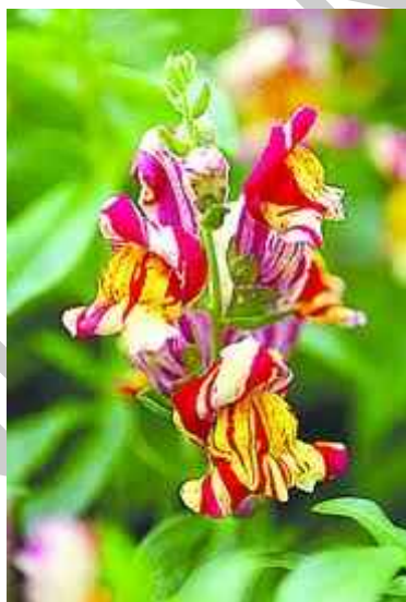
7. ábra. Oroszlánszáj 6

Leírás: Tömör színhatást adó, 30–40 cm magas virágágyi és szegélynövények. Több színárnyalata ismert: rózsaszínű, vörös, sárga, fehér és bíborszín. Június végén – július elején a legszebb, de kisebb megszakításokkal őszig találhatunk rajta virágot.