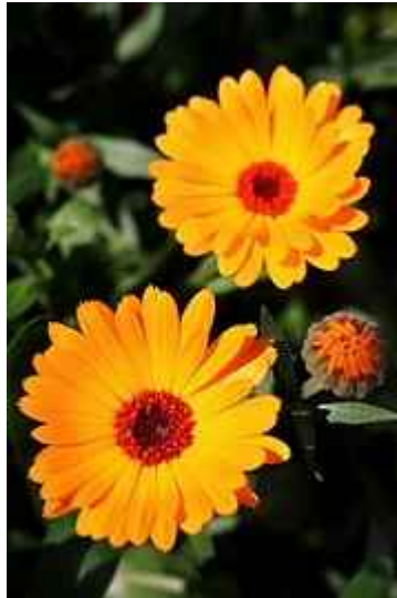
25. ábra. Korömvirág 21

Leírás: 30–70 cm magas gyógy- és dísznövény. Féltelet virágai a sárga szín különböző árnyalataiban folyamatosan nyílnak.