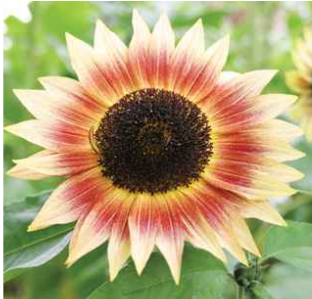
31. ábra. Dísznapraforgó 26

Leírás: A szántóföldi napraforgó kerti fajtái hálás és mutatós egynyári virágok. Szakaszos vetés esetén ősszel is szépen díszítenek, kellemes, meleg színükkel. 40x40 cm, 50x50cm-es térállásra ültessük.