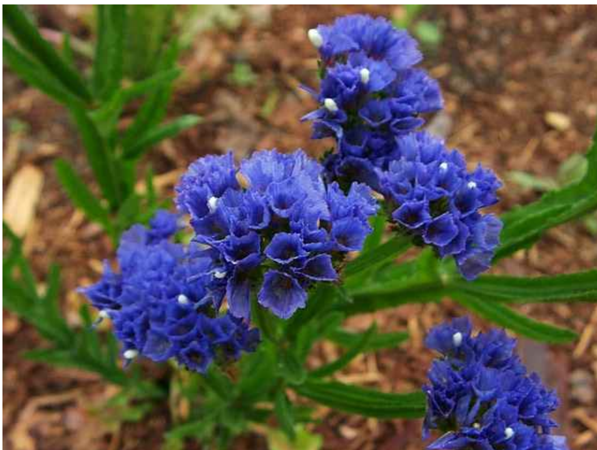
16. ábra. Sövirág 14

Leírás: Tőlevélrózsát alkotó levelei közül 60–70 cm magas, lapos, bordós virágszárat fejleszt. A száron nyílnak a fehér, rózsaszín, kék, lila virágai, júliustól szeptemberig. A virágok csészelevele színes, a párta fehér vagy sárgás, nagy virágtömeget adó.