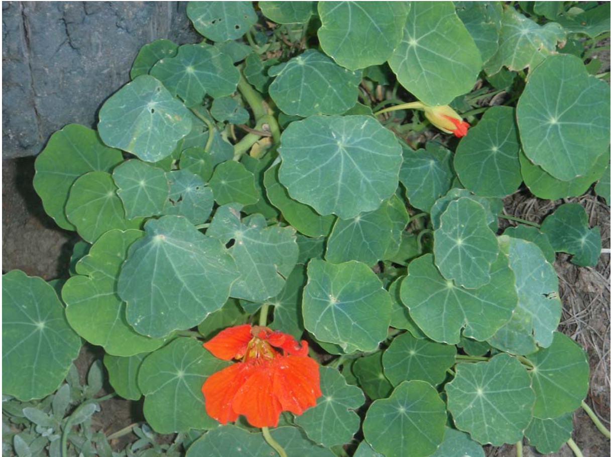
34. ábra. Sarkantyúka

Leírás: Élénk színű, sarkantyús virágai mellett sajátságos, pajzs alakú levelei is feltűnőek. Elfekvő száron hozza hosszú, csavarodott levélnyelét, levele matt színű. Virágai 4–6 cm átmérőjűek, sárga – bordó színben nyílnak, sarkantyúsak, enyhén illatosak.