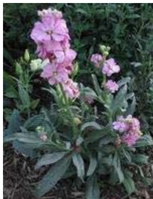
28. ábra. Kerti viola 24

Leírás: Közkedvelt, régi kultúrnövényünk változatos színű, illatos virágokkal. A növényházi vetés fajtától függően már májustól (Anyák Napjára) virágozni kezd. Legtartósabban (június–júliusban) a bokros fajták virágoznak.