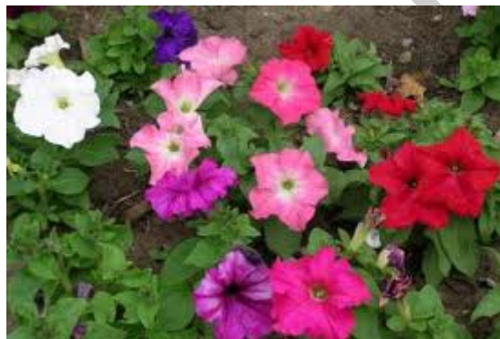
17. ábra. Petúnia 15

Igényei: A meleg, napfényes helyet, a tápdús, laza talajt kedveli. Vízigénye kezdetben nagy, de ahogy a talajt befedi, a szárazságot is elviseli. Kiválóan tűri a kedvezőtlen időjárási körülményeket. Közepes vízigényű, kedveli a fényt, de a szélre érzékeny.