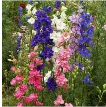
26. ábra. Szarkaláb 22

Leírás: 60–80 cm magas, gyéren elágazó, finoman osztott levelű növény. Telt virágai hosszú fürtben, szép pasztell színárnyalatokban nyílnak.