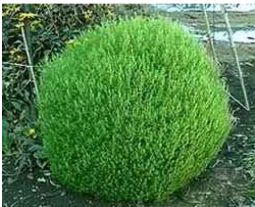
24. ábra. Seprűfű 20

Leírás: 80–100 cm magas egynyári. Díszértékét finom lombozata adja. Nyírás nélkül is kiegyenlített, formás bokrokat nevel, késő őszig zölden marad.