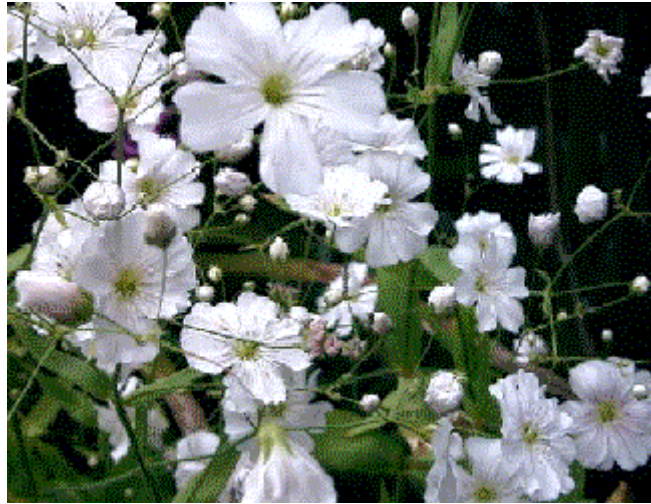
27. ábra. Fátyolka 23

Leírás: 60–80 cm magas, lazán elágazó, kevés levelű növény. Virágzási ideje nagyon rövid, vetés után 6 héttel virágzik, olyan dúsan nyílnak, hogy fátyolszerű látványt nyújtanak.