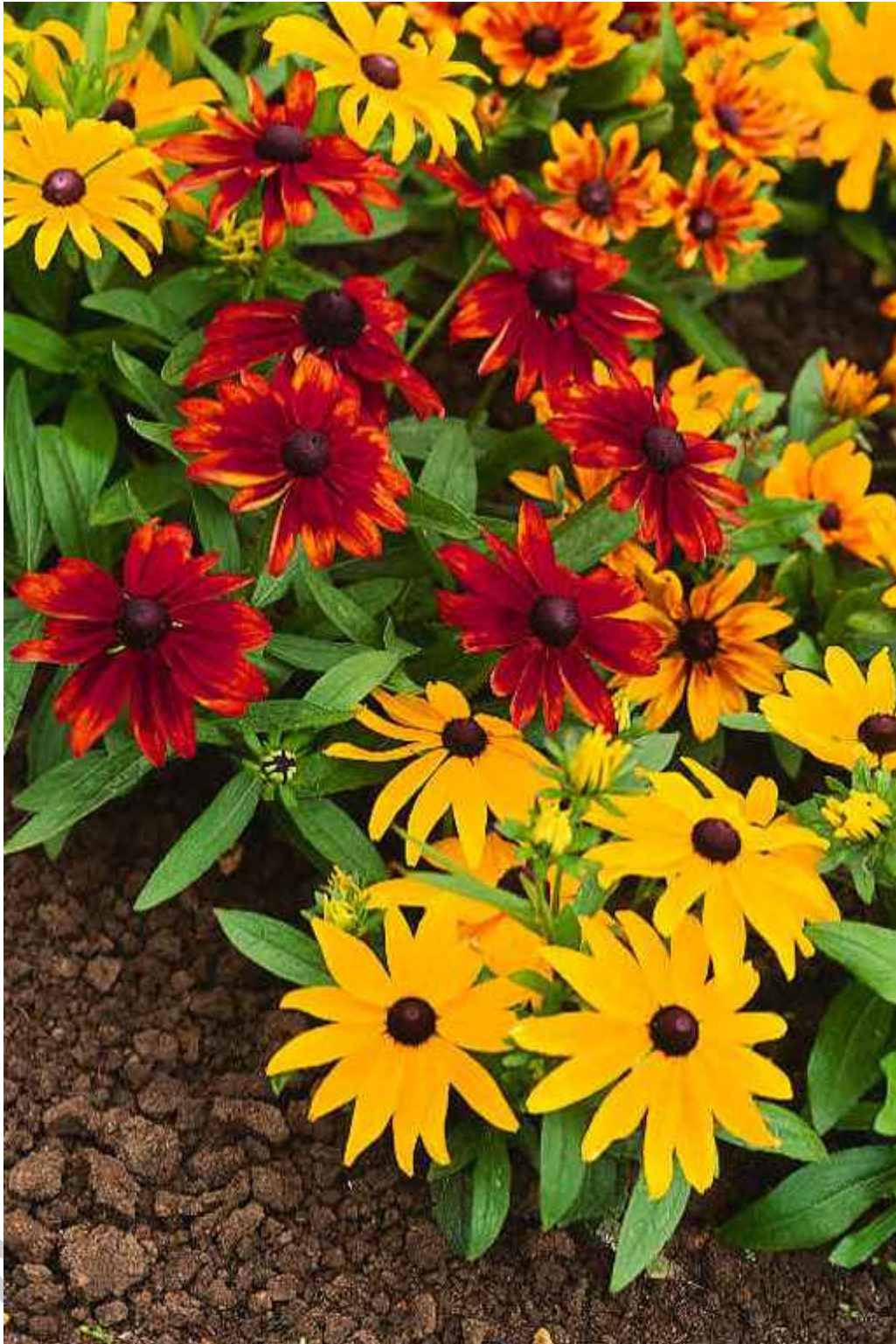
19. ábra. Kúpvirág 17