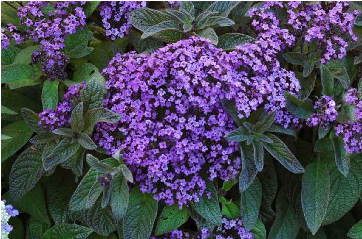
15. ábra. Vanília virág 13

Leírás: Erősen vanília illatú virága van, nyáron és ősszel nyíló apró virágai nagy virágzatokba tömörülnek, amelynek alapszíne sötét liláskék, de hibridjei fehér és levendula színben is kaphatók. Levelei tompán zöldek, erősen ereztettek.