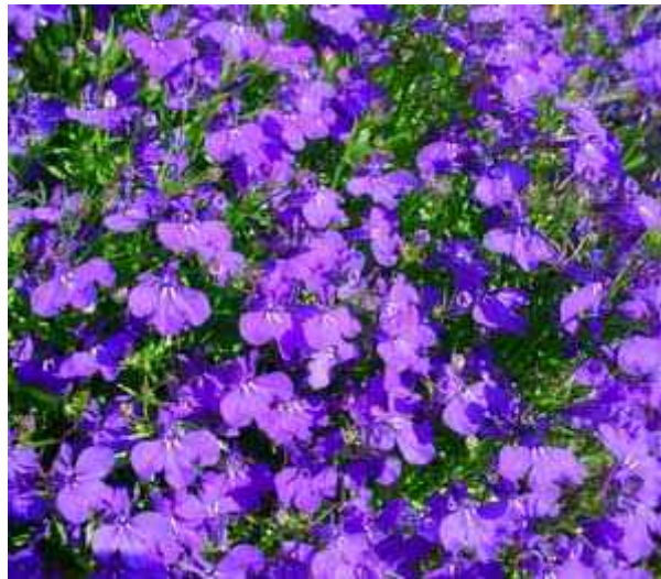
2. ábra. Lobelia 1

Leírás: A kecses apró virágú lila lobélia valódi romantikus hangulatot ad a kertnek vagy a balkonnak, szinte egész nyáron át ontja magából a gyönyörű mély lila apró kis virágokat, virágai már május második felétől nyílnak és egészen októberig pompáznak. 10–15 cm magassra nő meg.