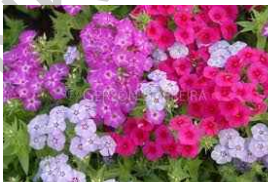
18. ábra. Lángvirág 16

Leírás: Alacsony növekedésű, a bokor 20–30 cm magas. Élénk színű, illatos virágai sokféle színben pompáznak.