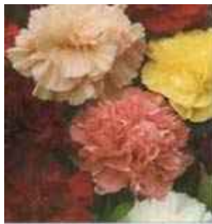
11. ábra. Sabó szegfű 10

Leírás: Körülbelül fél méter magas, levele keskeny pázsitféle, átellenes, az alja összenő, a növény kékeszöld, viaszos színű. Többféle színű illatos virágát júniustól a fagyokig hozza.