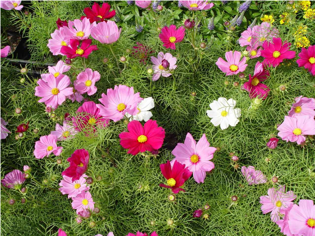
29. ábra. Pillangóvirág 25

Leírás: Meleg színárnyalatú virágainak szépségét a finom metszésű lombzat is emeli. Magas 80–100 cm-re megnövő laza bokor, szálas összetett levelekkel. 20–30 cm-es száron hozza 6–8 cm átmérőjű selymes fényű, fészkes virágzatait. Június végétől szeptemberig virágzik.