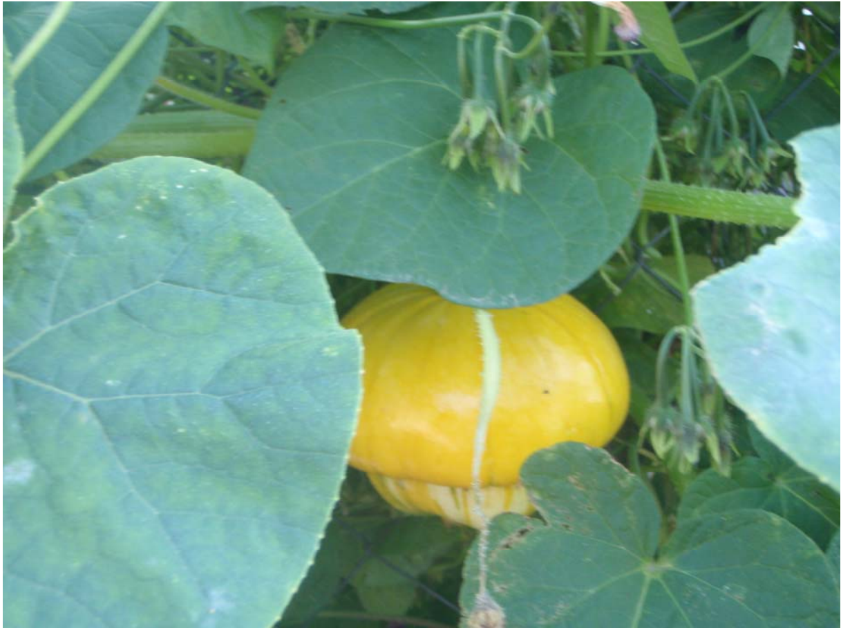
30. ábra. Díztök

Leírás: Kúszónövény, kerítések, korlátok befuttatására alkalmas. Sárga virágai a levelek árnyékában nyár közepétől nyílnak. A termés a kis gyümölcsű keveréknél 8–12 cm hosszú, színes, sima, vagy rücskös felületű, kemény héjú, gyorsan szárad.