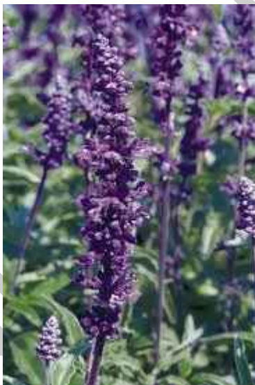
4. ábra. Lisztes zsálya 3

Leírás: Magassága: 40–50 cm, élénk kék felálló virágfüzérű sűrűn virágzó növény. Kék színe miatt kedvelt kiültetési növény. Az egyenes, elágazó szögletes szárain, leálló, szabálytalanul fogazott, tojásdad, lándzsa alakú levelei 7– 8 cm hosszúak, szürkészöld színűek. A lisztes zsálya elnevezést onnan kapta, hogy virágai szürkén molyhosak, mintha be lennének lisztezve.