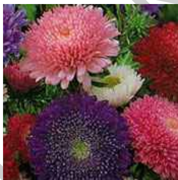
8. ábra. őszirozsa 7

Leírás : Változatokban és fajtákban a leggazdagabb egynyári virág faj.