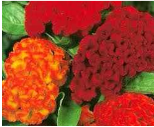
9. ábra. Kakastaréj 8

Leírás: Nem hiába kapta a növény ezt a különleges nevet, hiszen virágzata pont úgy néz ki, mint egy kakastaréj. 60–80 cm magas növény, amelynek levelei hegyesek, és tojás alakúak, bugavirágzatuk a hajtás végén fürtben fejlődik. Virágzási ideje augusztus szeptember, szinte az első kemény fagyokig folyamatosan virágzik. Színe lehet sárga, piros vagy lila.