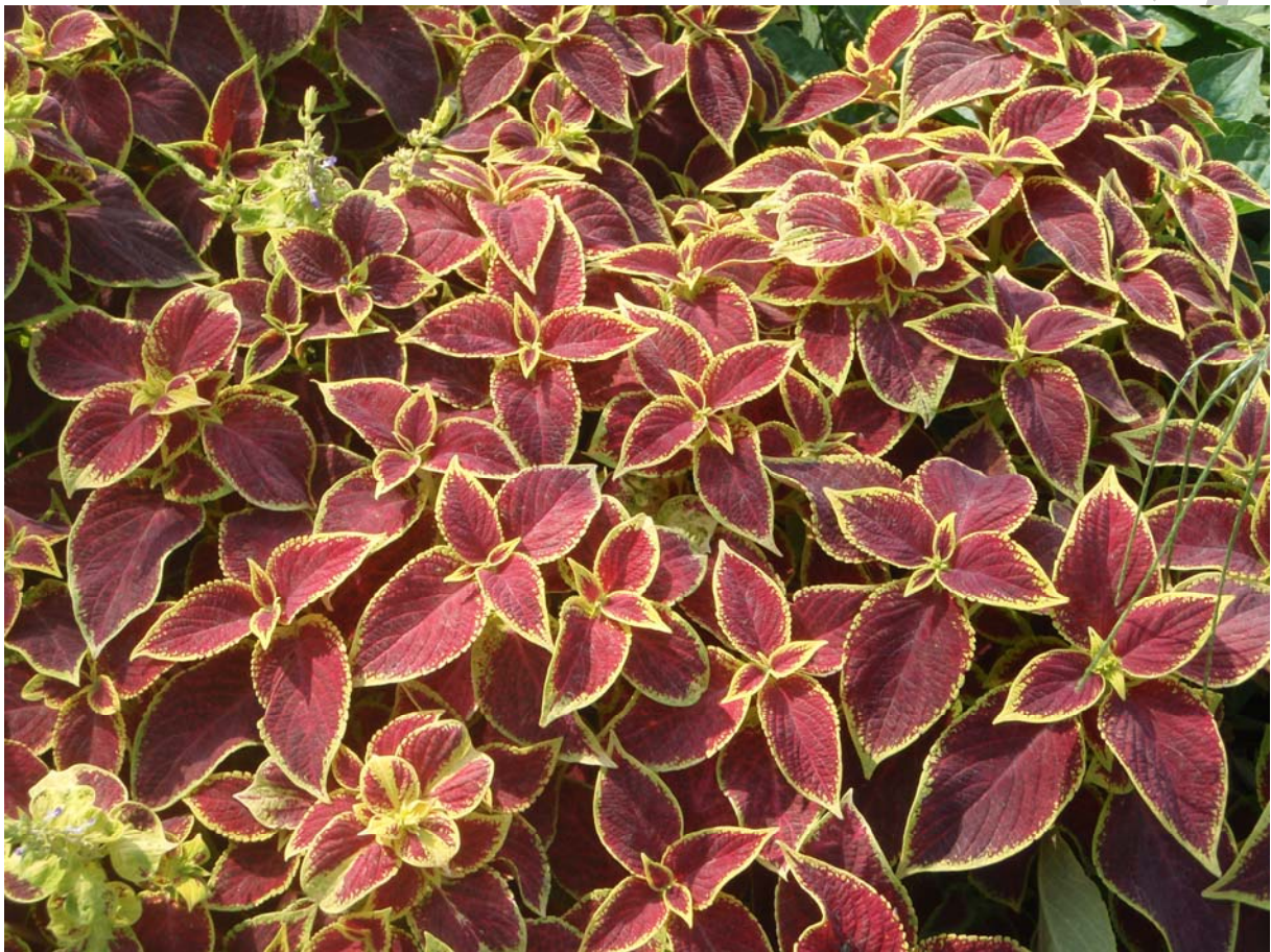
36. ábra. Dízcshalán

Leírás: A 25–35cm magas dízcshalán rajzoltos leveleivel üde színfoltja virágágyainknak. Levelei napfényben színeződnek a legjobban.