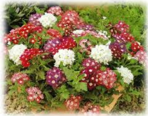
22. ábra. Verbena 19

Leírás: Apró, illatos, primulaszerű virágai vannak. A verbénák között megtalálhatók az egyszínű virágú és a tarka vagy szemes fajták is. Általában bokrot alkot, levélhórnáljából párosan hozza a gömb alakba rakódott virágait. Egész nyáron és ősszel virágzik. Virágainak színskálája a fehértől a rózsaszínen és a piroson át egészen a kék és a sötétlila árnyalatokig terjed. Júliustól októberig virágzik.