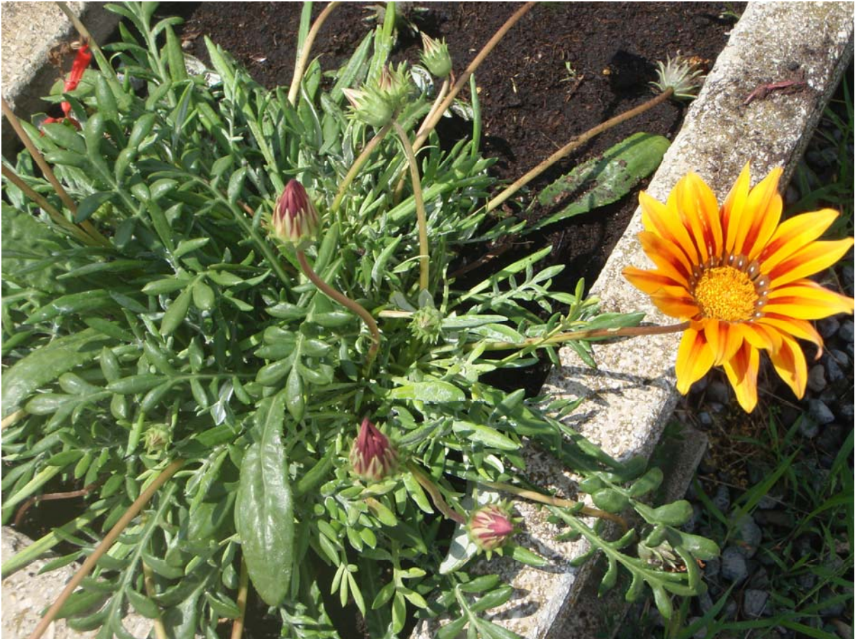
12. ábra. Záporvirág

Leírás: 25–30 cm magas, szépen osztott levelei a talaj közelében tölevélrózsát képeznek. Margarétaszerű, 6–8 cm-es virágai egyesével állnak a levelek felett, bő virágzású. A virágok egyszínűek vagy tarkák. Fő szín a sárga, narancsvörös, barna sávokkal, gyűrűkkel. Virágait éjszakára becsukja, és csak napfényes időben nyitja ki újra. Nagy, hosszan nyíló, élénk színű, színárnyalatokban gazdag virágai vannak. Júliustól szeptember végéig folyamatosan fejlődő virágok csak napfényes időben, a délelőtti-, kora délutáni órákban nyílnak.