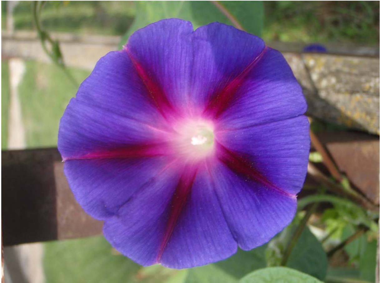
32. ábra. Hajnalka

Leírás: Szára csavarodva kúszik 3–4m magasba, tölcséres virágai hajnalban nyílnak, de, 10 óra körül becsukódnak. Bíborpiros virágú faj az Ipomoea purpurea . Nagy levelei szív alakúak. Júliustól az őszi fagyokig nyílnak.