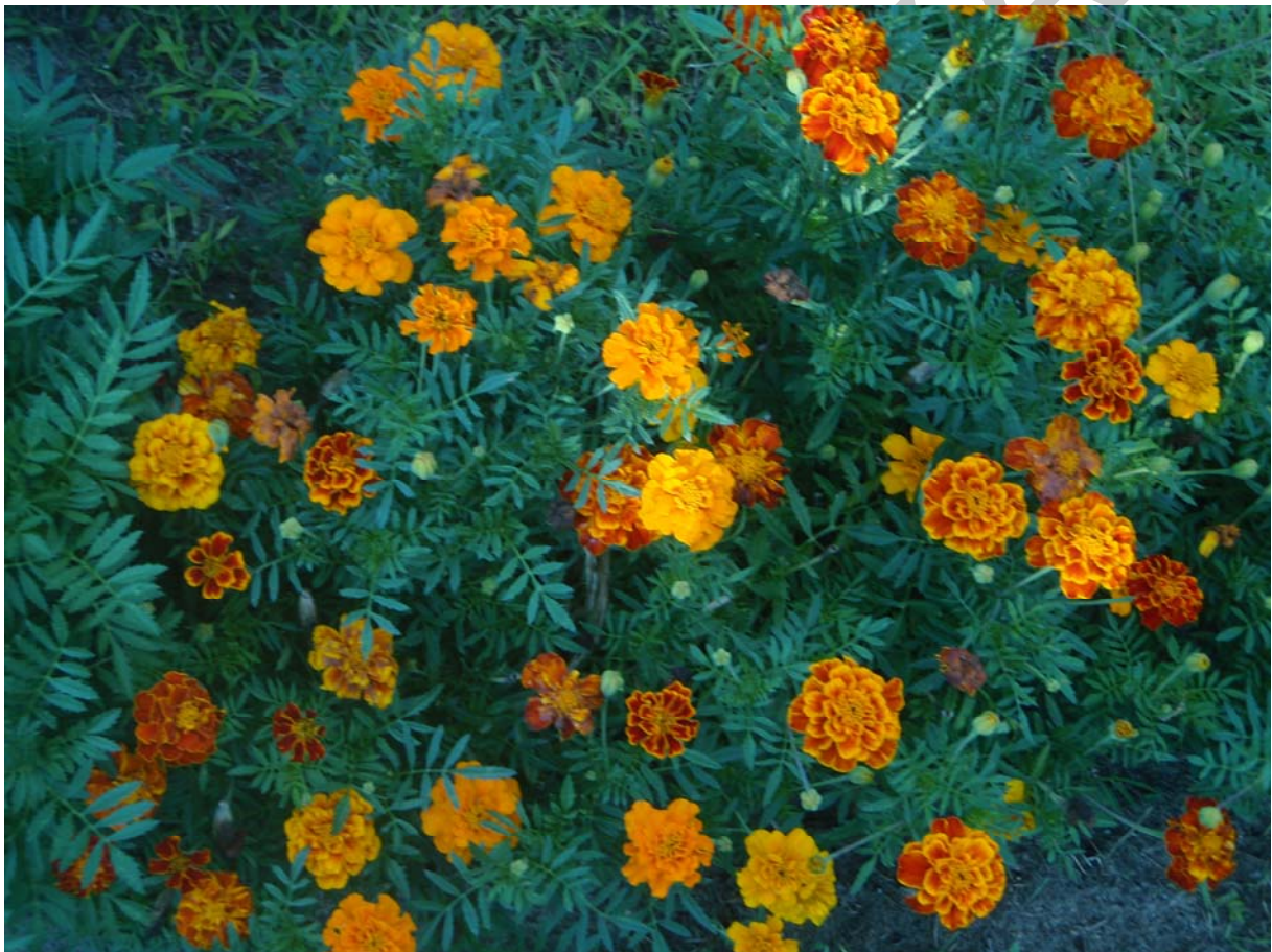
21. ábra. Kisvirágú bársonyvirág

Felhasználása: Nagy virágágyakba színfoltnak, szegélynövénynek, kőedényekbe, erkélyládákba kiváló. Bár virágai kisebbek, mint az előző fajé, jóval korábban hoz nagyobb tömegű virágot.