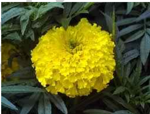
20. ábra. Nagyvirágú bársonyvirág 18

Leírás: Változatos virágformái, gazdag virágzású.