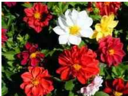
10. ábra. Dália 9

Leírás: Gumós, lágyszárú növény. A nagyobb termetű fajták majd' két méter magasra nőnek; sokszor gyermekfej nagyságú virágaikat a felálló hajtások végén hozzák, a törpe növésű változatok virágai kisebbek, de sokszor számosabbak. Évelő, de egynyáriként termesztjük!