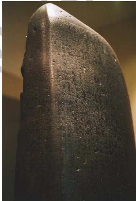
2. ábra. Hammurappi törvényoszlopa, az ősi jog első ismert forrása 2

Az állam és a jog kialakulásával ezeknek a szokásoknak nagy része elhalt. Ami megmaradt, annak érvényesülését már nem bízták az egyénre, hanem –akár erőszakkal is– kikényszerítették. Ezeket a korai társadalmakban kialakult, de a társadalmi forma megváltozását túlélő magatartási szabályokat nevezzük szokásjognak. A kifejezésben a jog szócska már arra utal, hogy ezeknek a magatartási szabályoknak a betartása már korántsem önkéntes akarat-elhatározáson alapul.