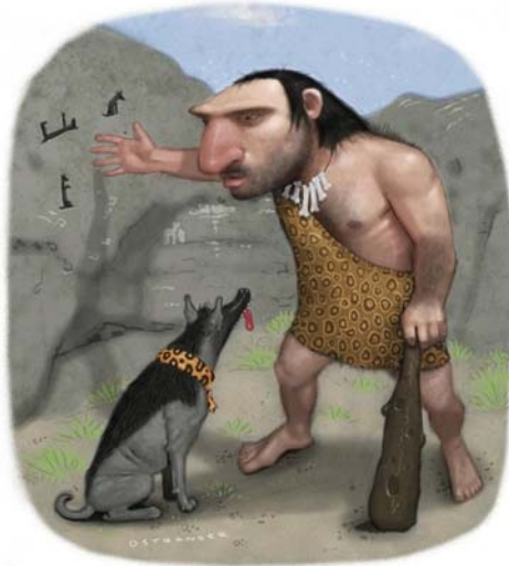
1. ábra Talán az első kísérlet a jogi szabályozásra...!

Az állam és a jog kialakulásával ezeknek a szokásoknak nagy része elhalt. Ami megmaradt, annak érvényesülését már nem bízták az egyénre, hanem –akár erőszakkal is– kikényszerítették. Ezeket a korai társadalmakban kialakult, de a társadalmi forma megváltozását túlélő magatartási szabályokat nevezzük szokásjognak. A kifejezésben a jog szócska már arra utal, hogy ezeknek a magatartási szabályoknak a betartása már korántsem önkéntes akarat-elhatározáson alapul.