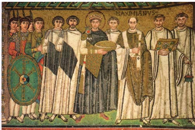
3. ábra. Justinianus császár, a római jog egységbe foglalója 3

Egy új társadalmi forma megjelenése egyszerre mind azt is jelenti, hogy az új társadalmi viszonyok (egyszerűbben mondva: élethelyzetek) egész tömege jelenik meg. Az ezekben az élethelyzetekben követendő magatartást viszont meg kell határozni, azaz tudatosan kell szabályokat előírni, s ezzel már elérkeztünk a tulajdonképpeni joghoz és a jogalkotáshoz. A tudatos jogalkotói munka eredményeként kidolgozott jogszabályok érvényesülését a létrejövő államapparátus segítette.