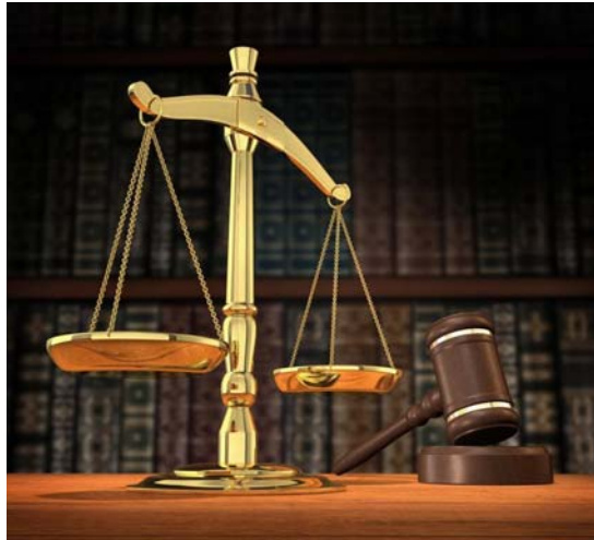
4. ábra. A jog szimbólumai: az igazság mérlege és a bírói kalapács 4