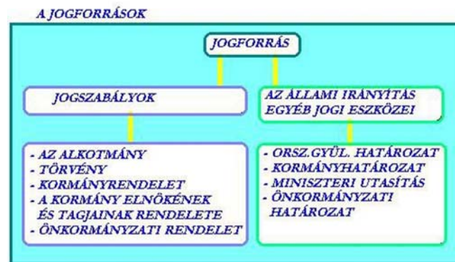
5. ábra. A jogszabályi hierarchia rendszere 5

Az egyik a hierarchia elve. Tehát az alacsonyabb szintű jogszabály nem lehet ellentétes a magasabb szintűvel. Azt, hogy egy jogszabály hol helyezkedik el a jogforrási rendszerben, az határozza meg, hogy a kibocsátója milyen helyet foglal el az állami szervezetek rendszerében. A magasabb szintű szervezet, pl. az Országgyűlés által kibocsátott jogszabály az alacsonyabb szintű jogszabályhoz képest elsőbbséget élvez.