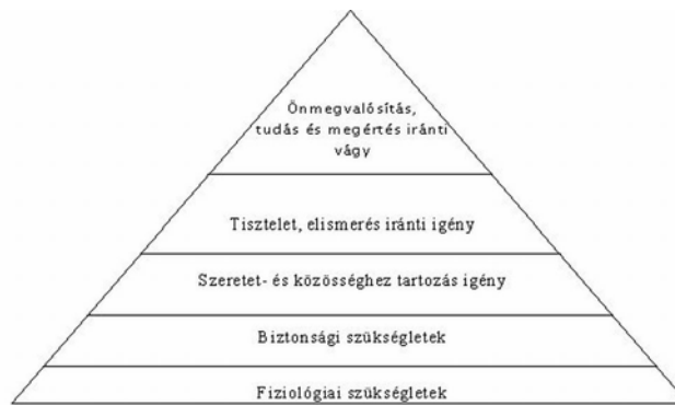
1. ábra. Maslow-féle piramis

A szükségletek a termelt javakkal és szolgáltatásokkal elégíthetők ki.