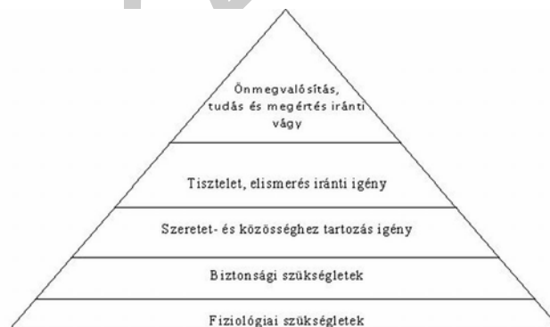
3. ábra. Maslow-piramis kategóriái