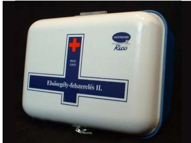
1. ábra. Munkahelyi elsősegély-felszerelés

Ez azt jelenti, hogy a dolgozók számával arányos mennyiségű és számú elsősegélynyújtó felszerelést kell elhelyezni a munkahelyeken hozzáférhető módon. A munkáltatónak ki kell jelölnie és ki kell képeznie (képeztetnie) elsősegélynyújtót a dolgozók közül, vagy a foglalkozás-egészségügyi szolgálat (korábbi elnevezéssel: üzemorvos) közreműködésével biztosítani kell képzett elsősegélynyújtó készenlétben állását.