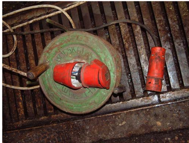
5. ábra Villamos biztonság?.

Több halálos baleset okozója volt már, hogy a barkácsolt hosszabbító dugvillájában a helytelen szerelés és a mechanikai igénybevétel hatására a védővezeték kiszakadt a helyéről. Az áramvezető szálak viszont a helyükön maradtak, így a berendezés működésképes maradt, a használója nem érzékelte a hibát. Az érintésvédelem nélkül maradt villamos berendezés burkolatára egy villamos hiba miatt tartósan akár a fázisfeszültség is kikerülhetett, ami halálos áramütéses balesetet okozott. Megelőzhetőek ezek a balesetek a munkaeszközök szabályos kialakításával, a rendszeres felülvizsgálat és karbantartás elvégzésével. Fokozottan áramütés veszélyes munkakörülmények estében jó megoldás lehet a villamos hálózattól független, beépített akkumulátoros kéziszerszámok használata.