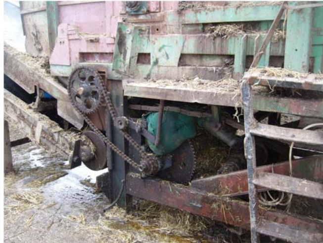
4. ábra. A szabálytalan gépjavítás tragikus eredménye

Ezek a súlyos kimenetelű balesetek általában két okra vezethetők vissza: a kardántengely burkolatának hiányára, vagy hiányos voltára, és hogy a burkolatlan kardántengelyt meghajtó erőgép hajtásának kikapcsolása nélkül a szabadon forgó kardántengely közelében végeznek valamilyen munkát. A kardánkereszt a munkavállaló ruhájába akadva felcsavarja azt a dolgozóval együtt.