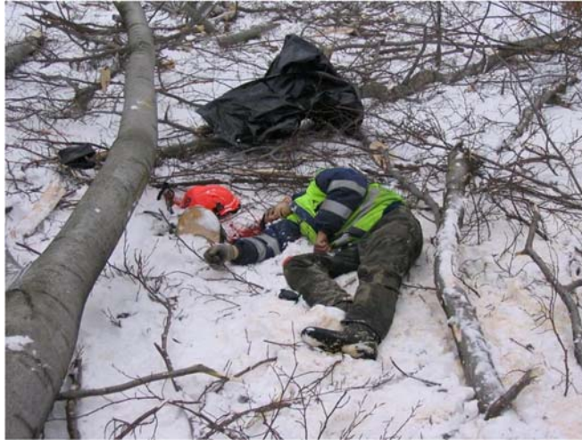
6. ábra. Szabálytalan fadöntés áldozata

A munkavállaló a vontató és a hozzá kapcsolni kívánt vontatmány közé szorult. A légrugós rendszer váratlanul felemelkedett és úgy összenyomta a gépkocsivezető mellkasát, hogy az a helyszínen életét veszítette 12 .