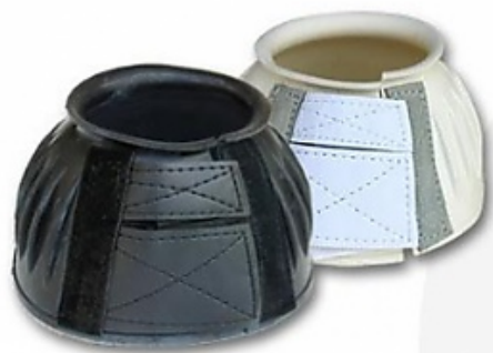
10. ábra Pataharang