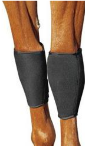
9. ábra Lábtővédő (térdvédő)