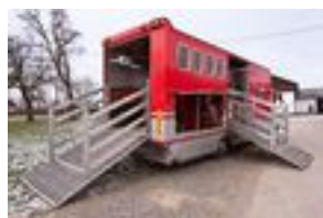
2. ábra Hátul fel, elől le!

Levezetéskor előnyt jelent, ha az utánfutón van elülső rámpa is, így előre vezetve jöhet le róla a ló.