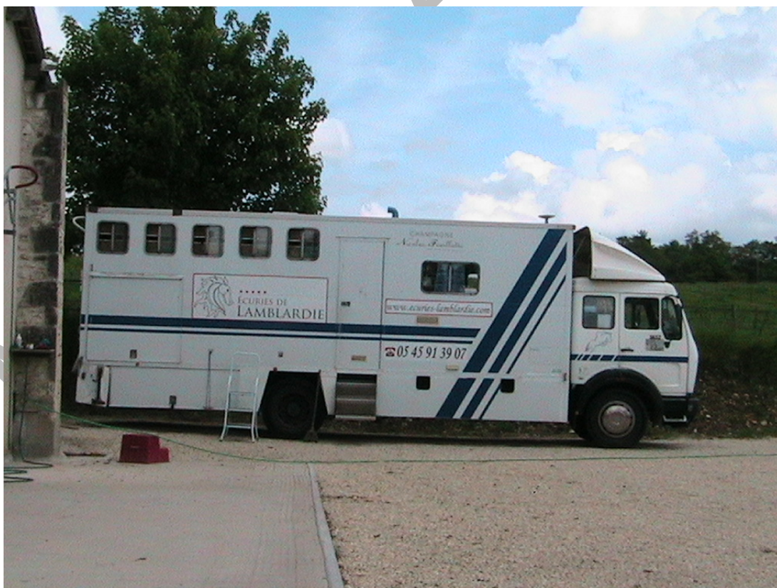
15. ábra Lószállító kamion

A szállítás egy vagy kétállásos lószállító utánfutóval vagy többállásos lószállító kamionnal történhet attól függően, hogy hány lovat akarunk szállítani.