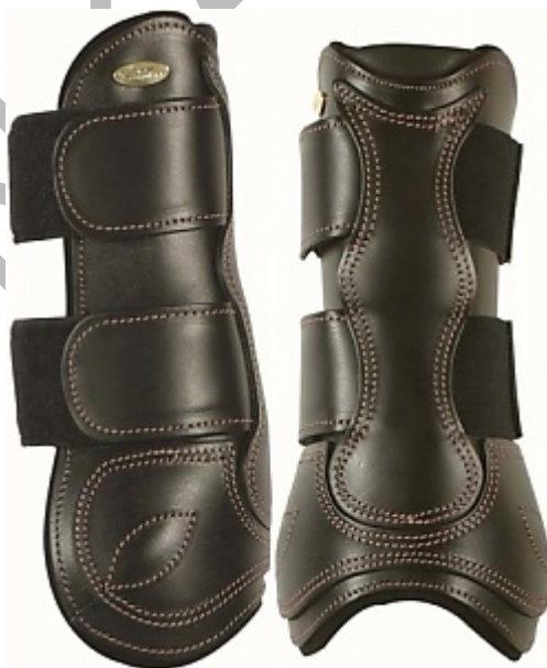
3-4. ábra Lábszárvédők (ínvédők)