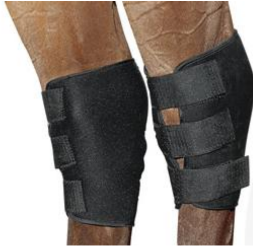
8. ábra Csánkvédő