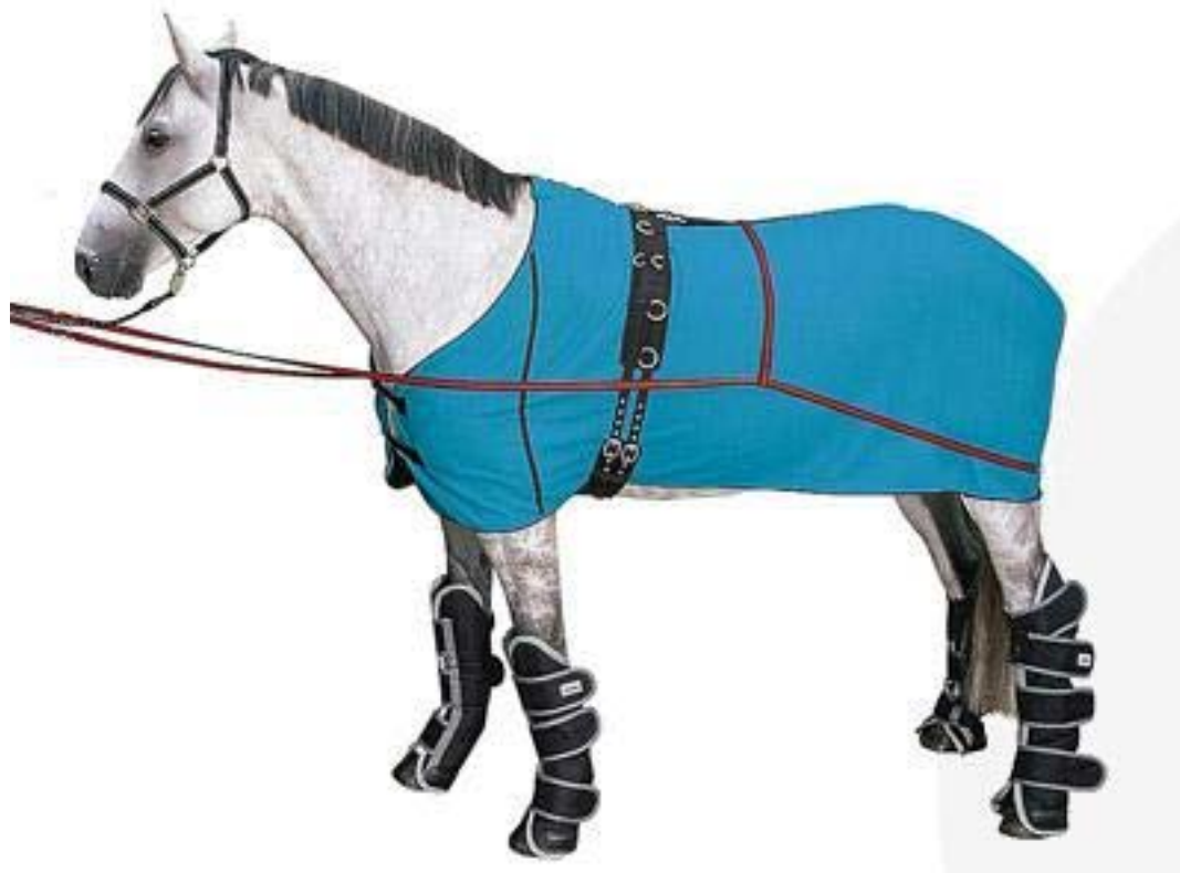
1. ábra Segítség a felvezetéshez

Ha nem ezek után sem sikerül a lovat felvezetni, akkor két segítő kötelet feszíthet ki a rámpa széleinél, hogy a ló kitörését megakadályozza. Ha megindul befelé, a köteleket keresztezzék a fara mögött, megakadályozva a lehátrálást.