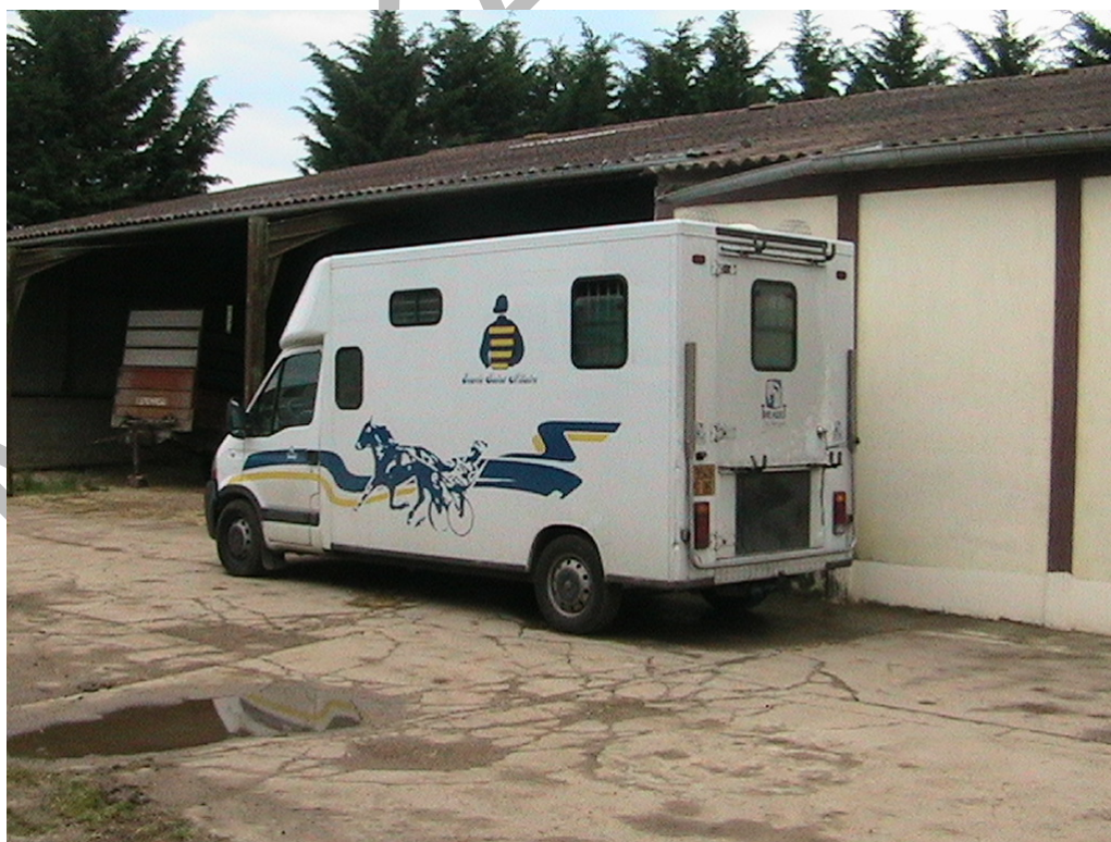
17. ábra Lószállító kisteherautó