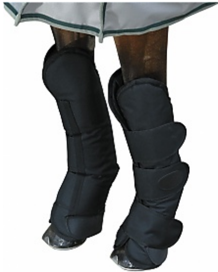
11. ábra Komplett lábvédő