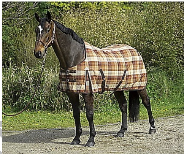
12. ábra Lótakaró