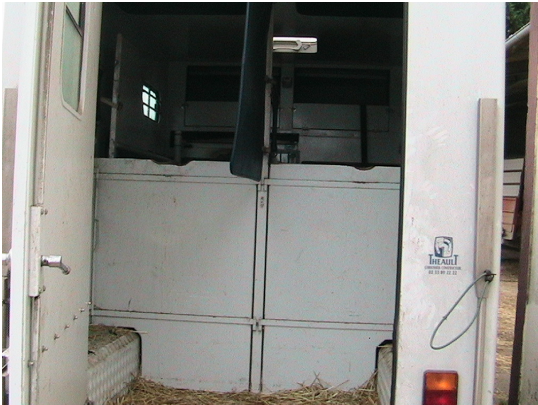
18. ábra A lószállító kisteherautó belülről

A lószállítóknak elhelyezhetjük a lovat a menetiránnyal szemben, a menetirányra ferdén (halszájkás elhelyezés), a menetirányra merőlegesen és háttal a menetiránynak. Kísérletek szerint a lovak maguktól a menetirányra ferdén állnak be menet közben a járművön. A 16. és 17. ábrán látható franciaországi lószállítóban a menetiránynak háttal utaznak a lovak. Ezt a megoldást azzal indokolták, hogy fékezéskor az egyensúlyozáshoz azokat az izmait használja, mint az előre irányuló mozgásnál. Így a ló kevésbé fárad el az út során.