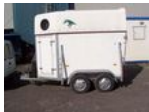
16. ábra Lószállító utánfutó

A szállítójárművel szemben támasztott követelmények: