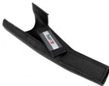
13. ábra Farokvédő