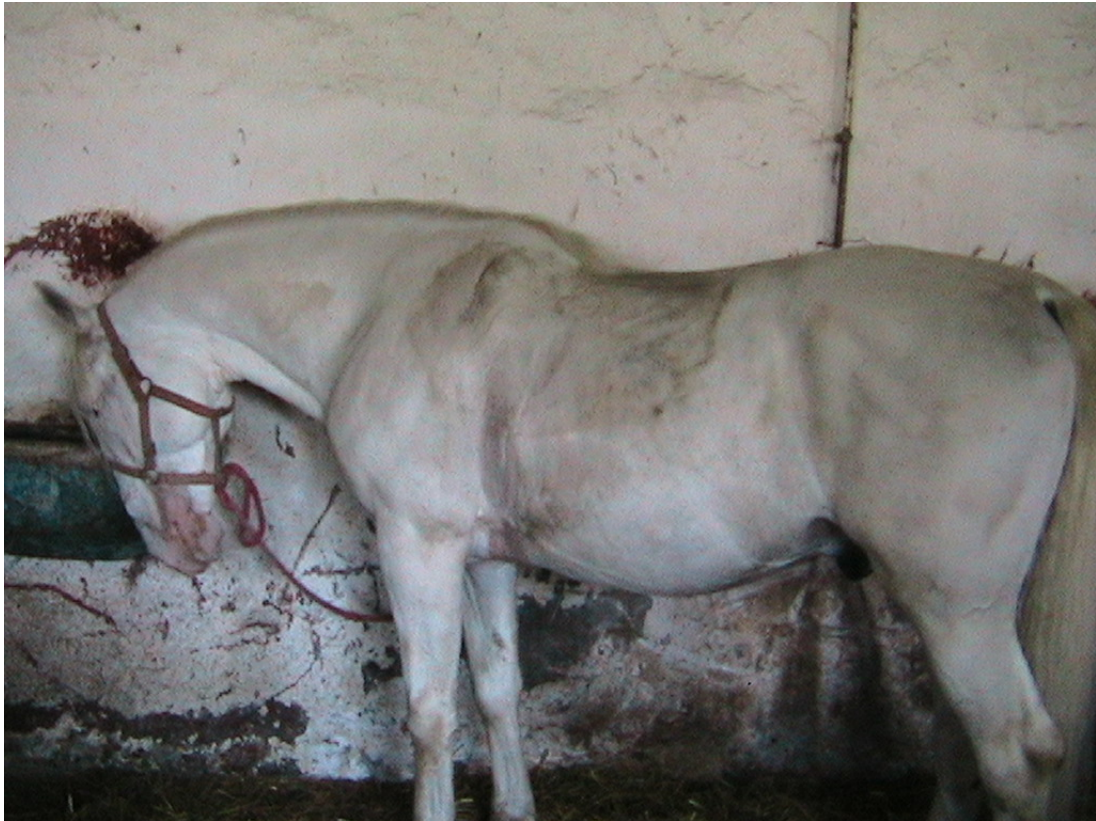
3. ábra. Munka után, ápolás előtt

Ápoláskor legyünk határozottak, de türelmesek. Soha ne bánjunk durván a lóval!