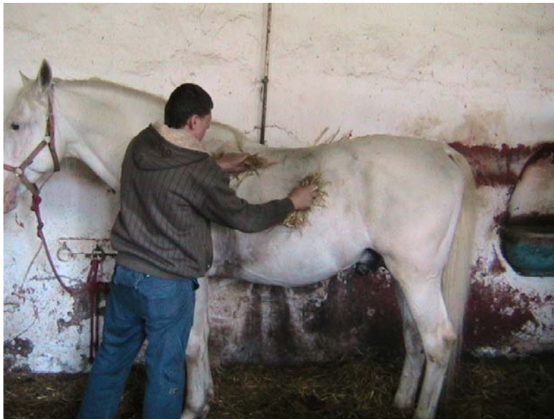
2. ábra. Szalmacsutak használata

A reggeli órákban végezzük a lovak napi főápolását az istállóban vagy nyáron a szabadban. Keményre tekert szalmacsutakkal mindkét kézzel a ló egész testét végigdörzsöljük a fejtől a végtagokig. A makacsabb szennyeződések a lóvakaróval az ún. tepsivakaróval vagy gyökérkefével távolíthatjuk el. A vékonyabb bőrrel borított részeken és a lábak ízületein csak óvatosan használjuk! Ezzel fellazítjuk a szennyeződések. A fellazított szennyréteg eltávolítását a szórkefével végezzük. A kefét a szőrzet fekvésének irányába húzzuk. A vakaró segítségével távolítjuk el a keféből a "lóport". A vakaróból időnként kiütjük a port. Az ápolás befejeztével puha vászon vagy pamut ruhával töröljük át a ló egész testét.