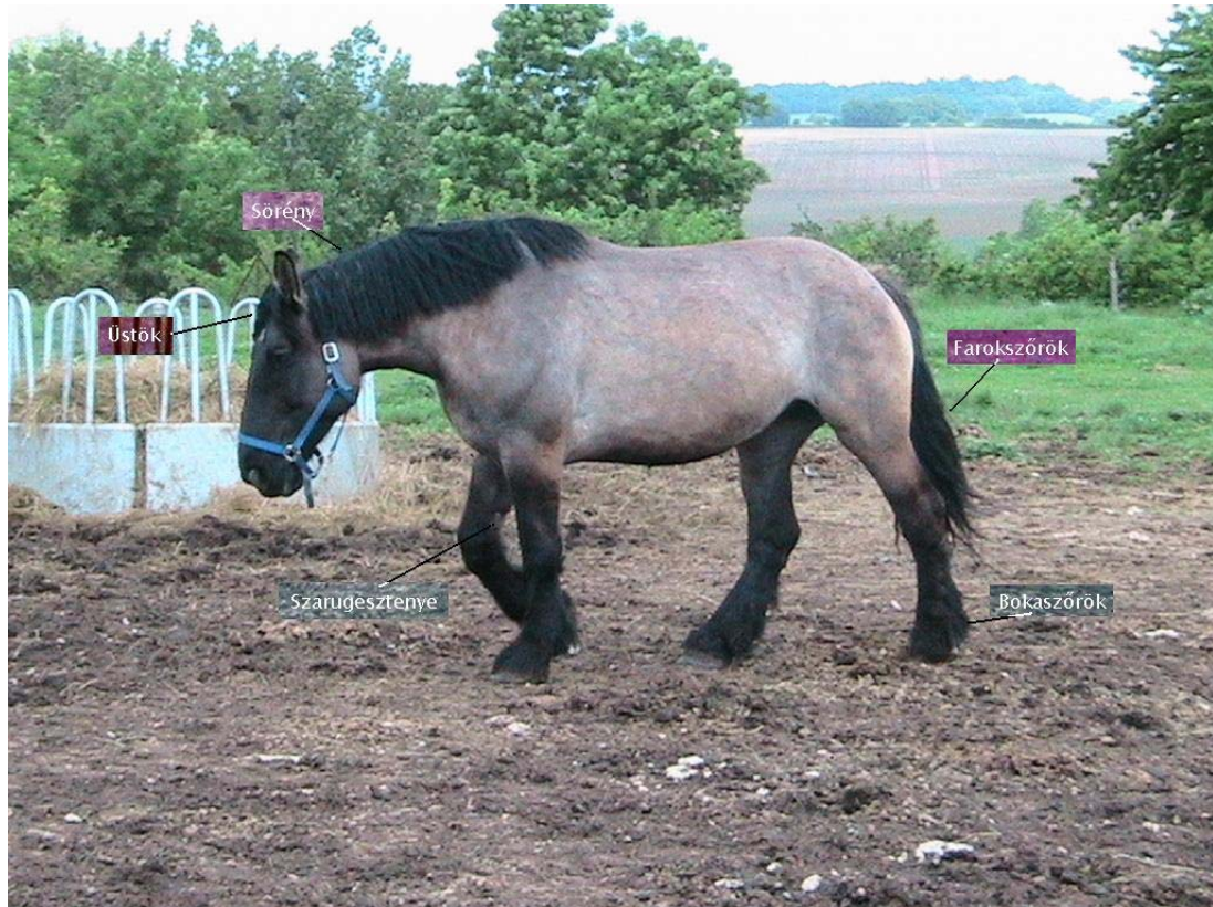
1. ábra. Hosszúszőrök