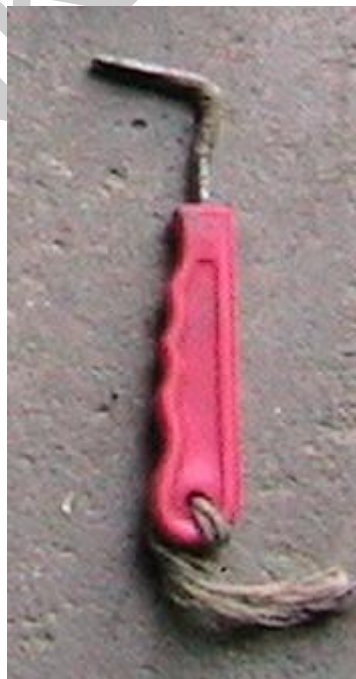
9. ábra. Patakaparó