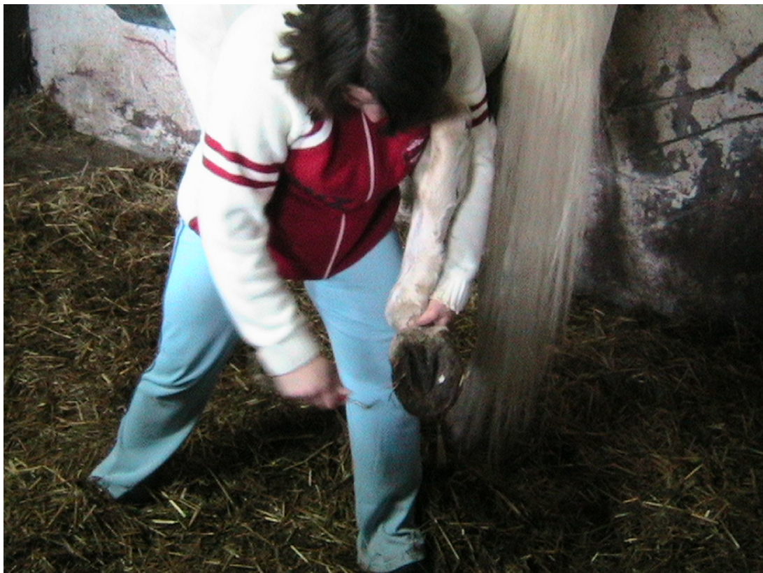
10. ábra. Patatisztítás