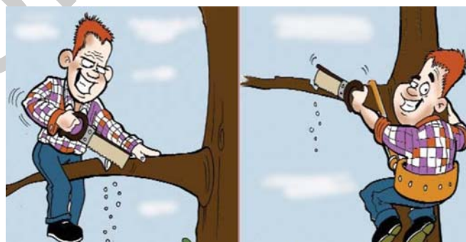
1. ábra. Munkavállaló felelőssége 1